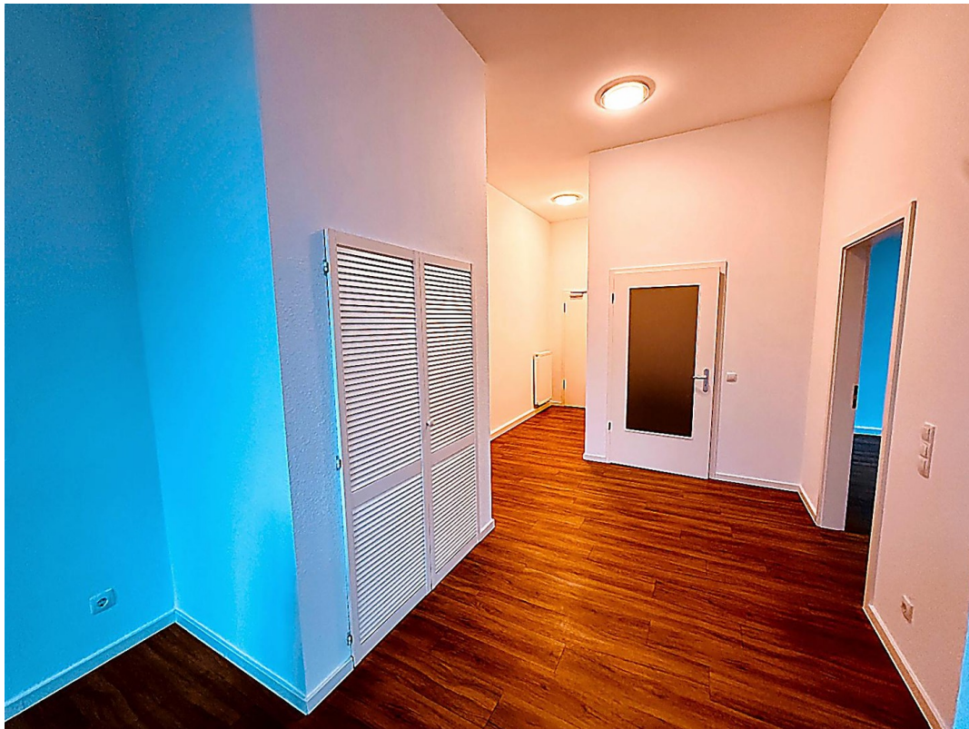
Flur Richtung Eingang