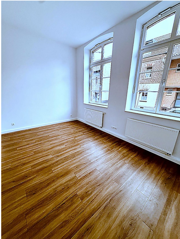
Schlafzimmer Richtung Fenster