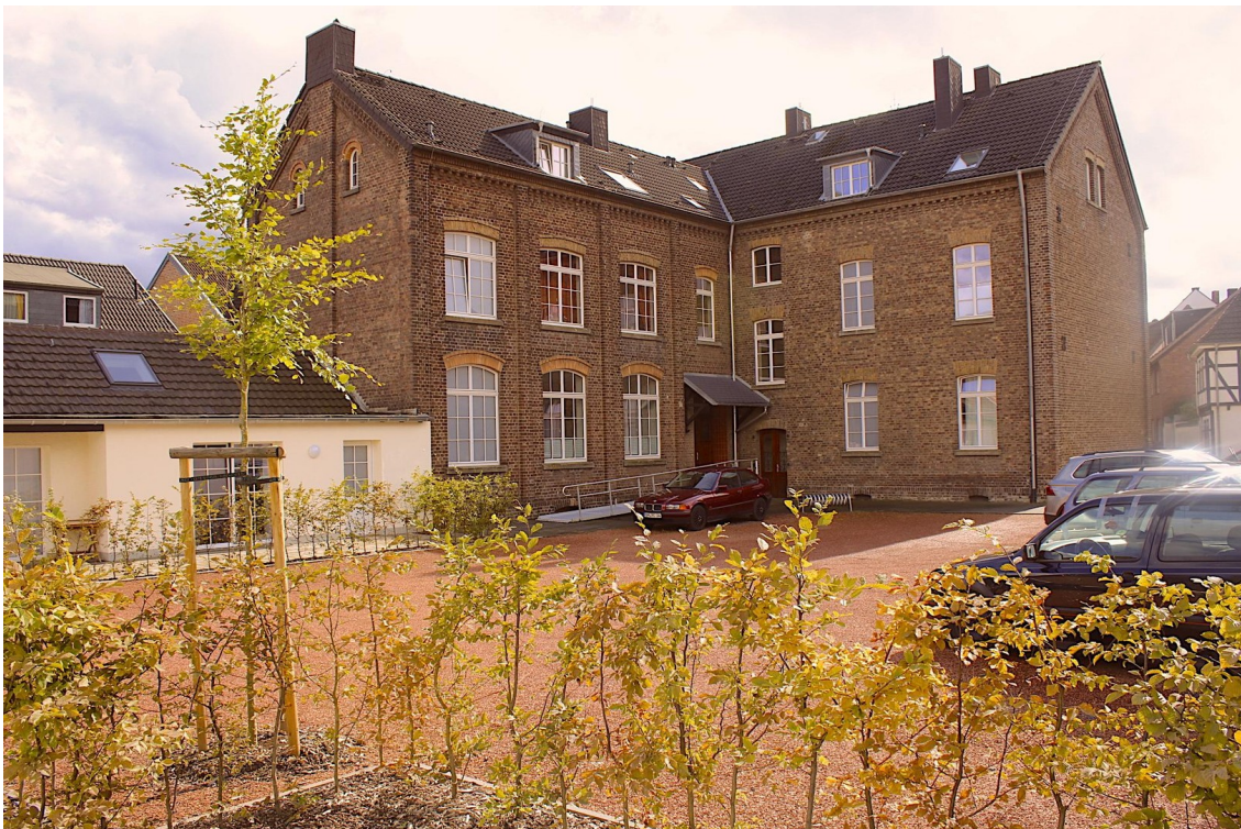
Innenhof der Ahl Schull