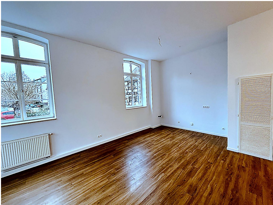
Wohnzimmer Richtung Küche