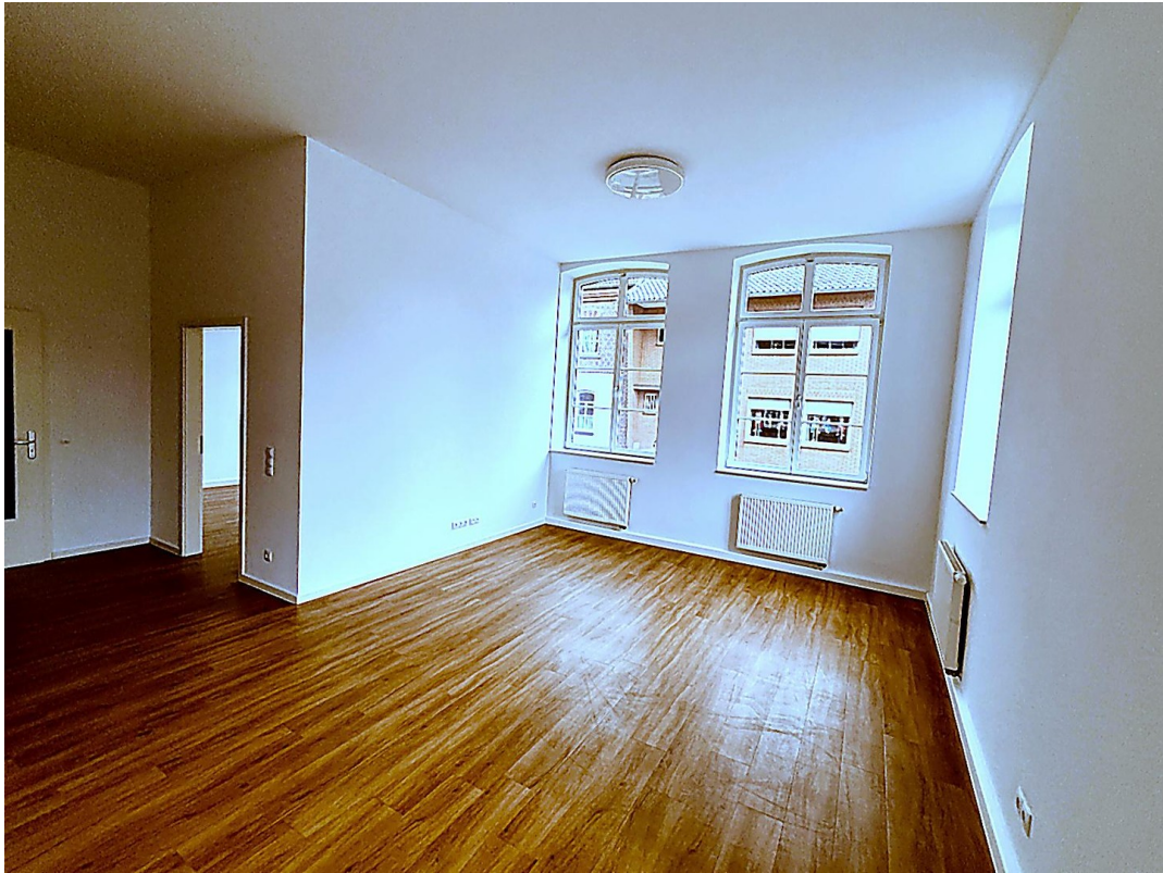
Blick Richtung Wohnzimmer