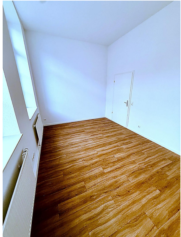
Schlafzimmer Richtung Türe