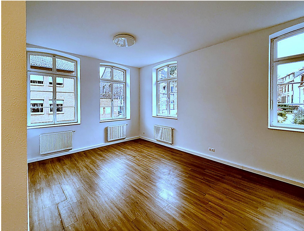
Wohnzimmer Richtung Dorfplatz