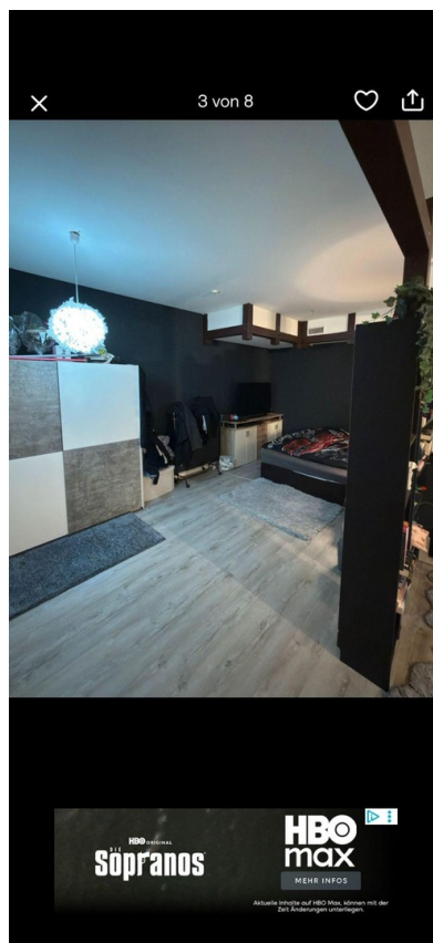
halb abgetrennter Schlafbereich