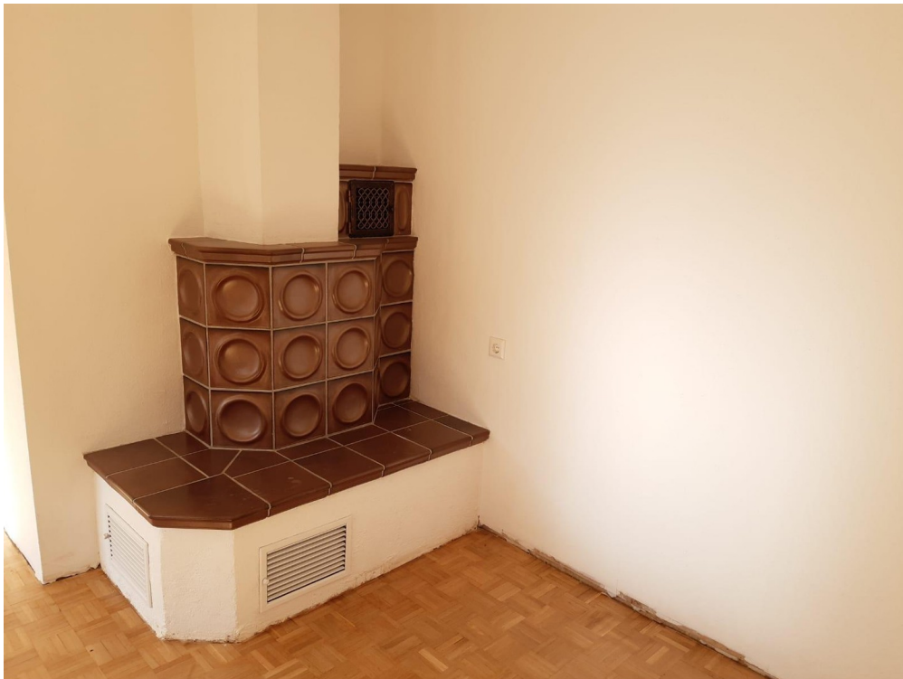
Kamin im Wohnzimmer