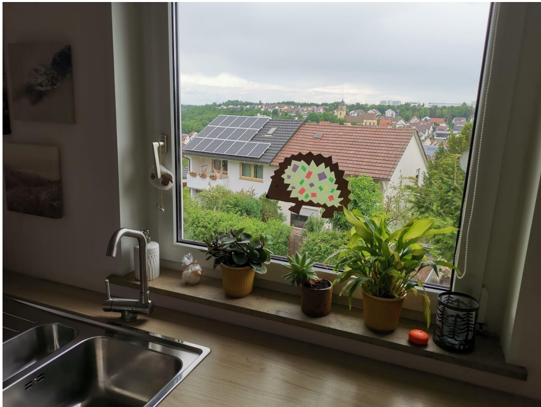
Küche mit Ausblick