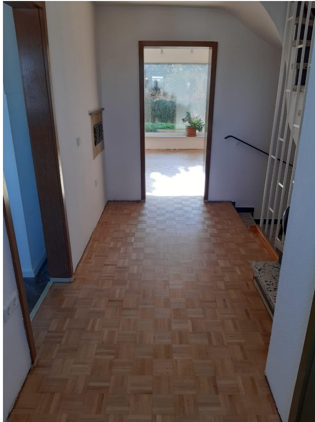
Flur mit Blick zum Wohnzimmer