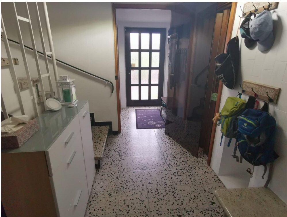
Flur und Eingangstür