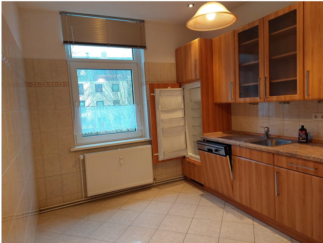
Küche mit mögl.Essplatz