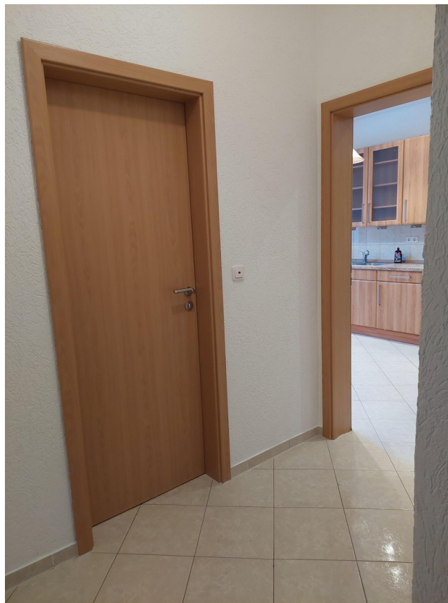
Blick Zwischenflur auf Küche