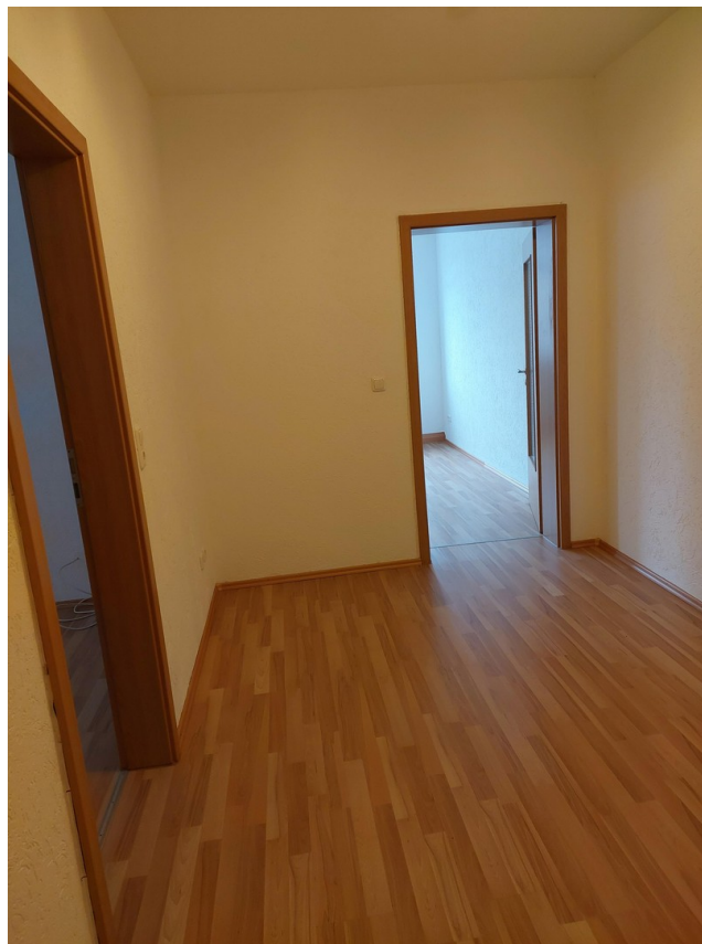
Blick von Flur zu Wohn-/Essz.