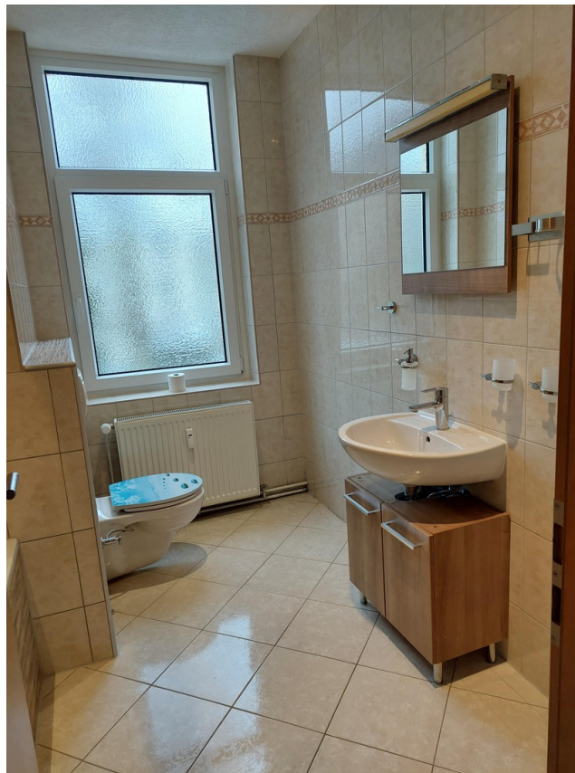
Bad mit Fenster