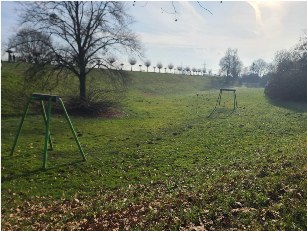
Spielplatz am Seniorenheim