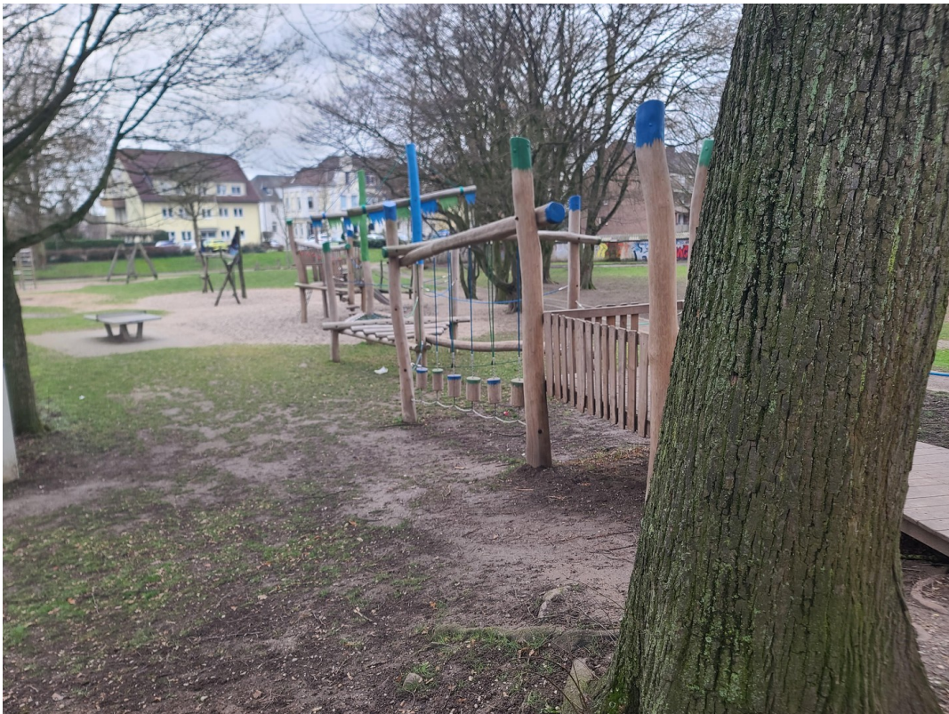
Spielplatz an der Grundschule