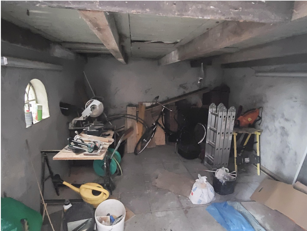
Schuppen ca.4,91 x 3,50