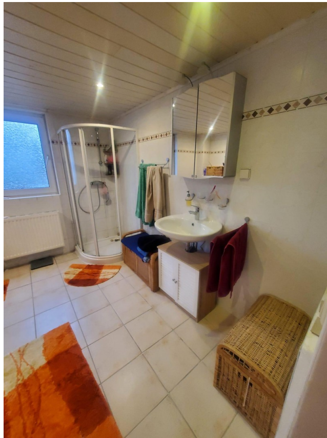
Oberes Badezimmer 2