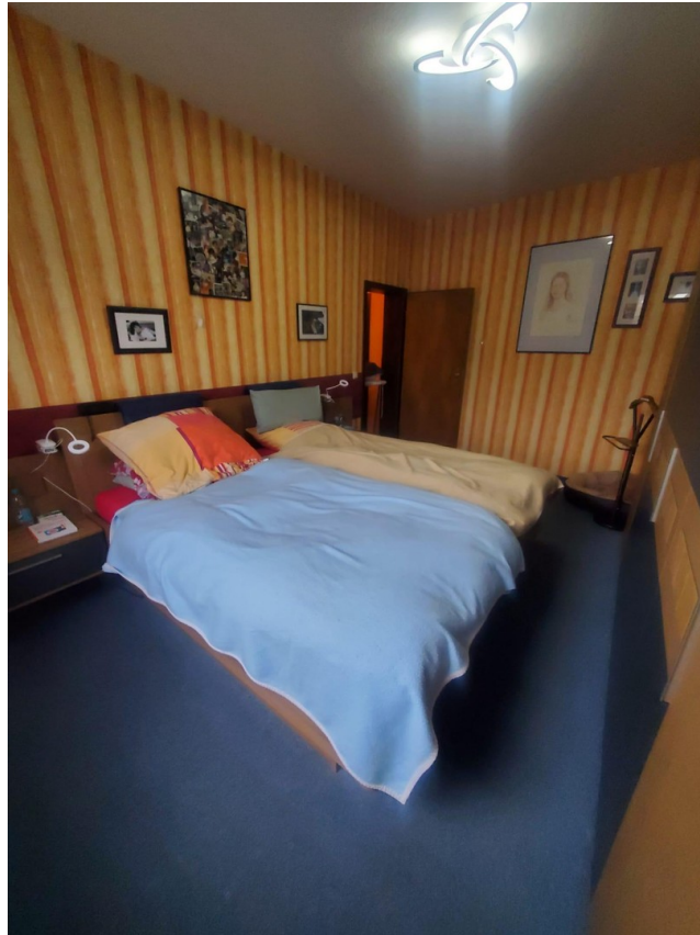
Schlafzimmer 1. Etage