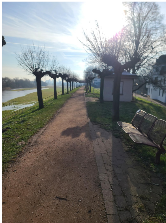
Rheindeich im Winter 2