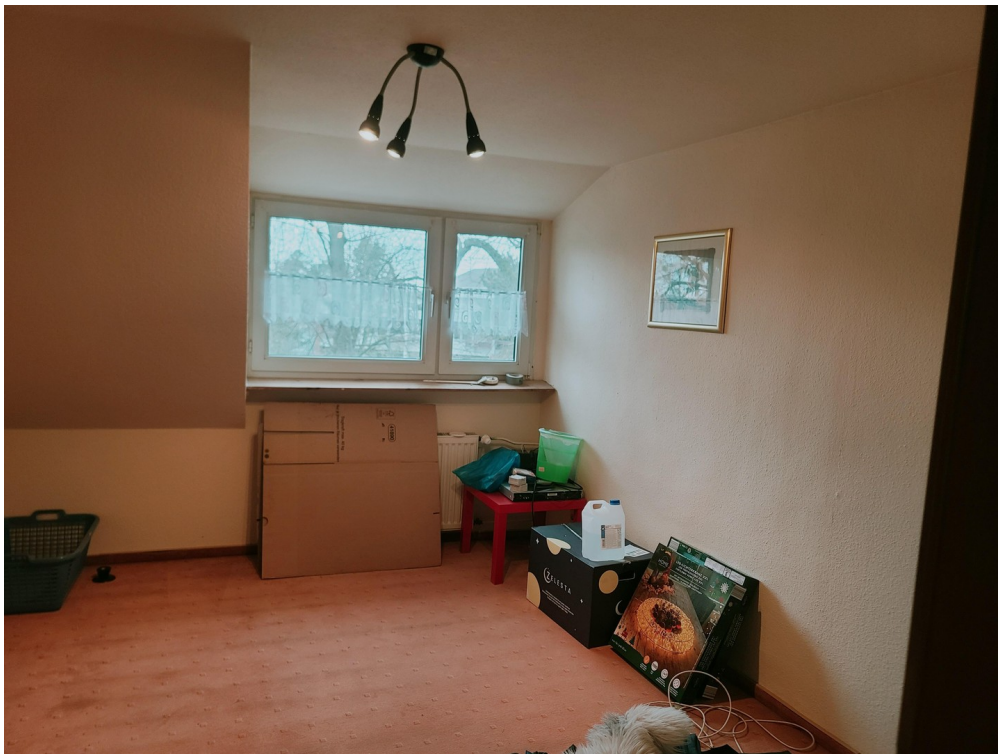
Schlafz. / Gästezimmer 2.Etage