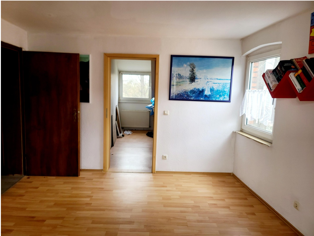
Wohnz./klein. Schlafz. 2.Etage