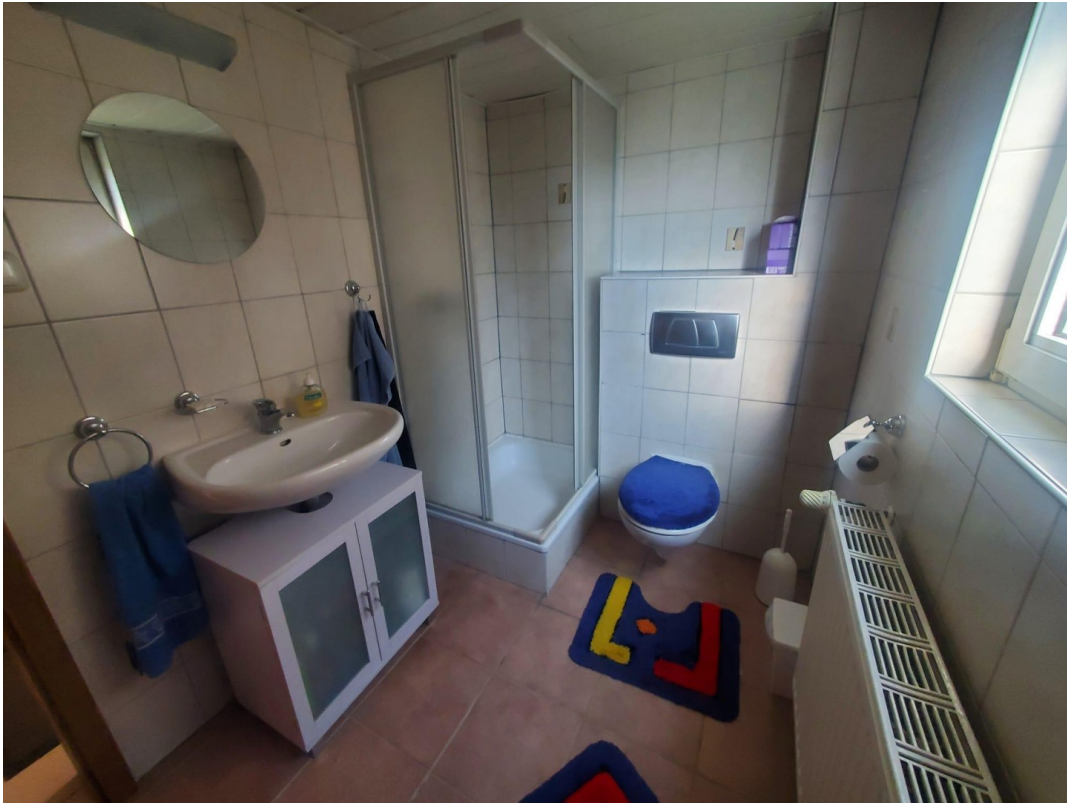
Bad unten 2