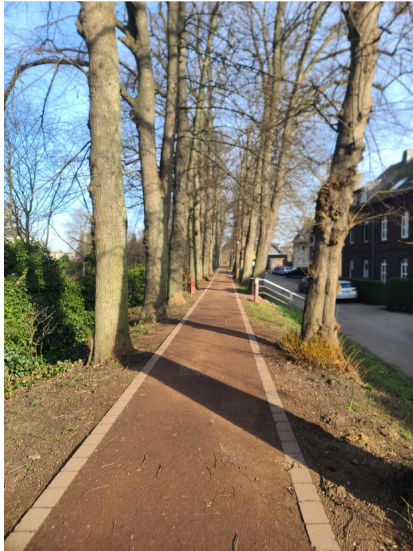
Rundweg 1 im Winter