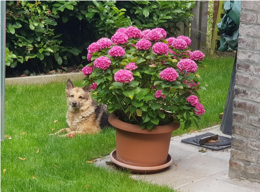
Hund fühlt sich auch wohl!