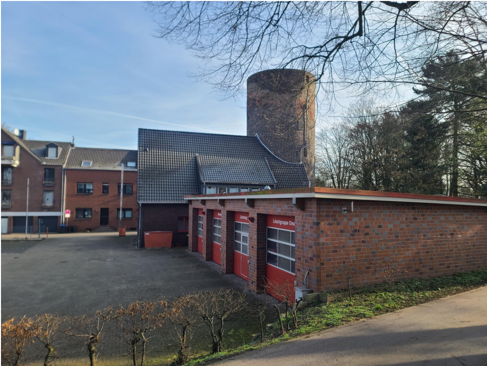
Pulverturm und Feuerwache