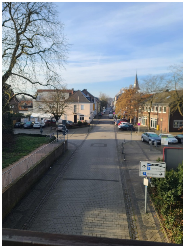
Hauptstasse Richtung Ortsmitte