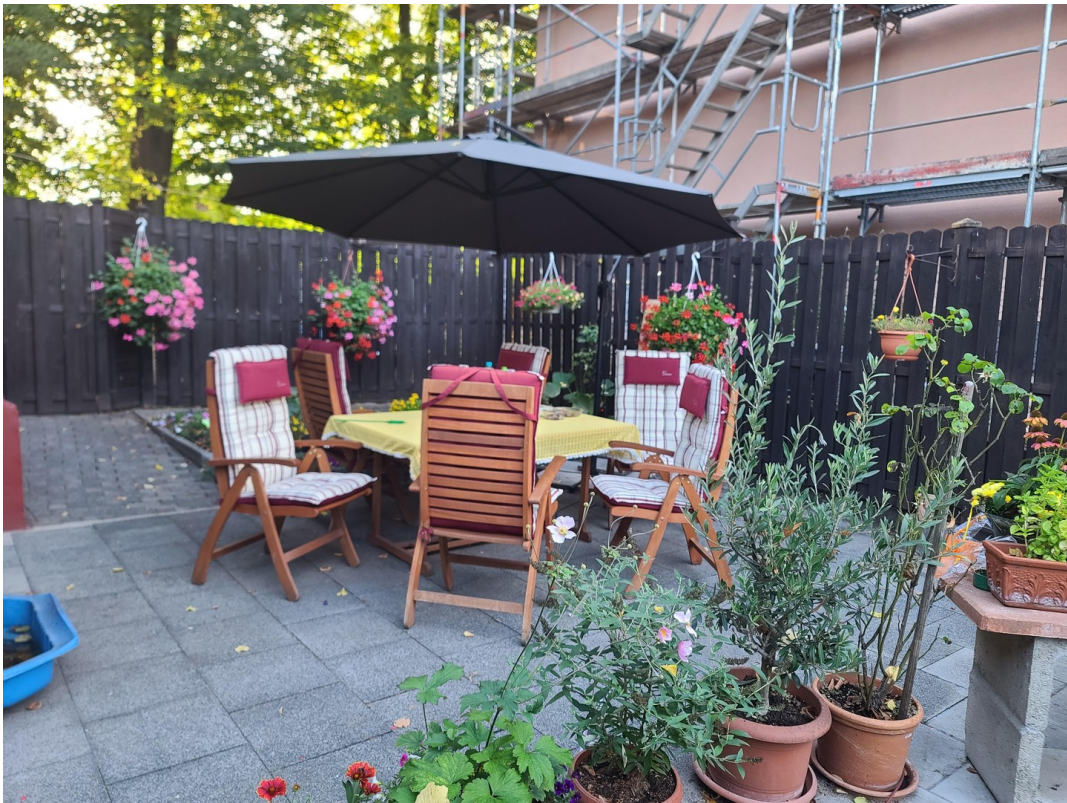
Sitzgruppe im Garten