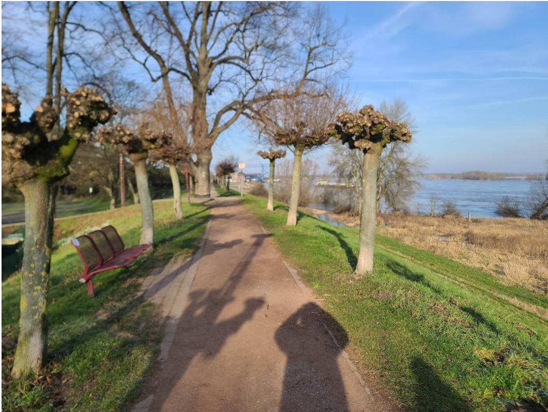
Rheindeich im Winter 1