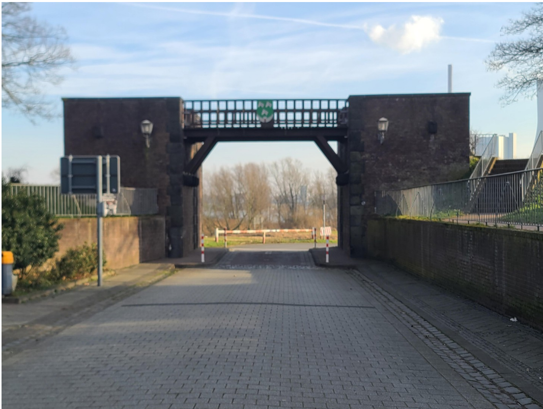
Rheintor Richtung Fähre