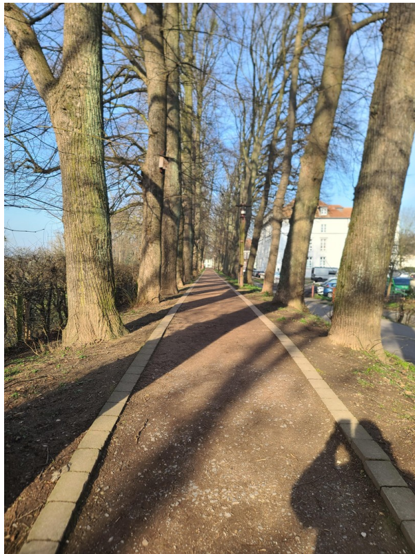
Rundweg 2 im Winter