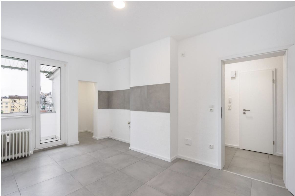
Küche mit Balkon