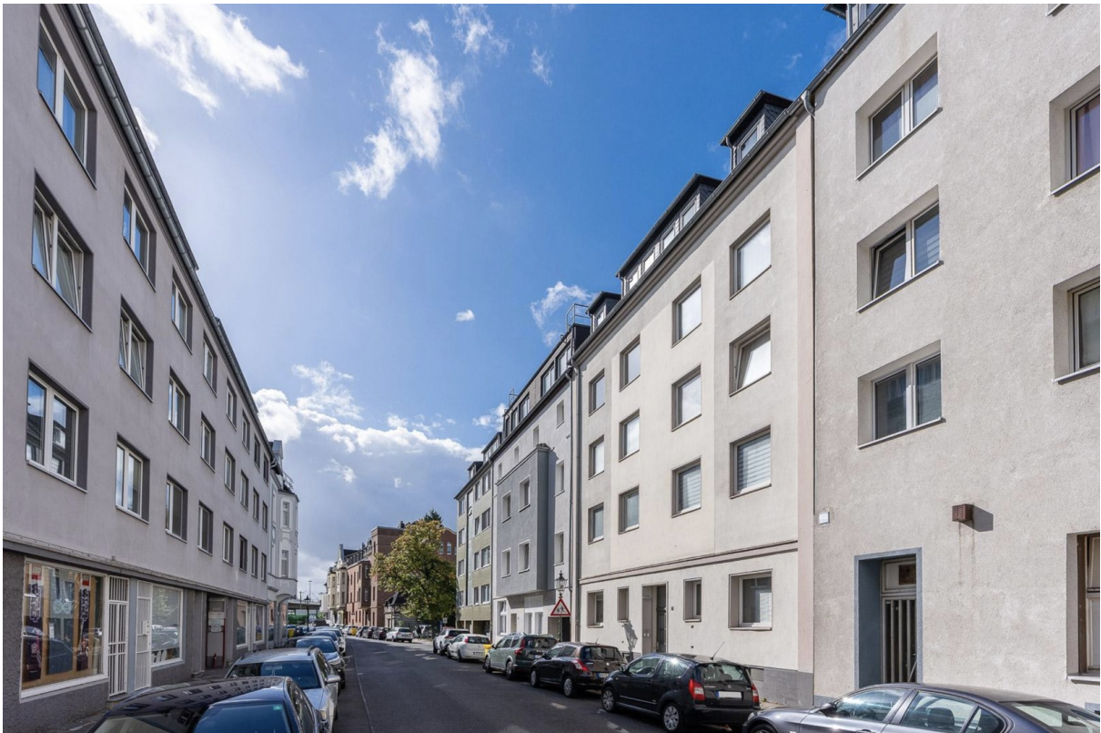
Straße und Haus