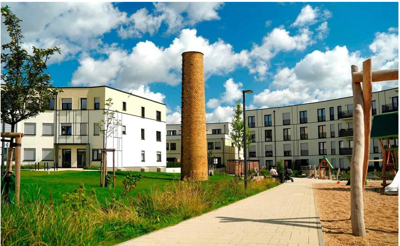
Spielplatz im Quartier