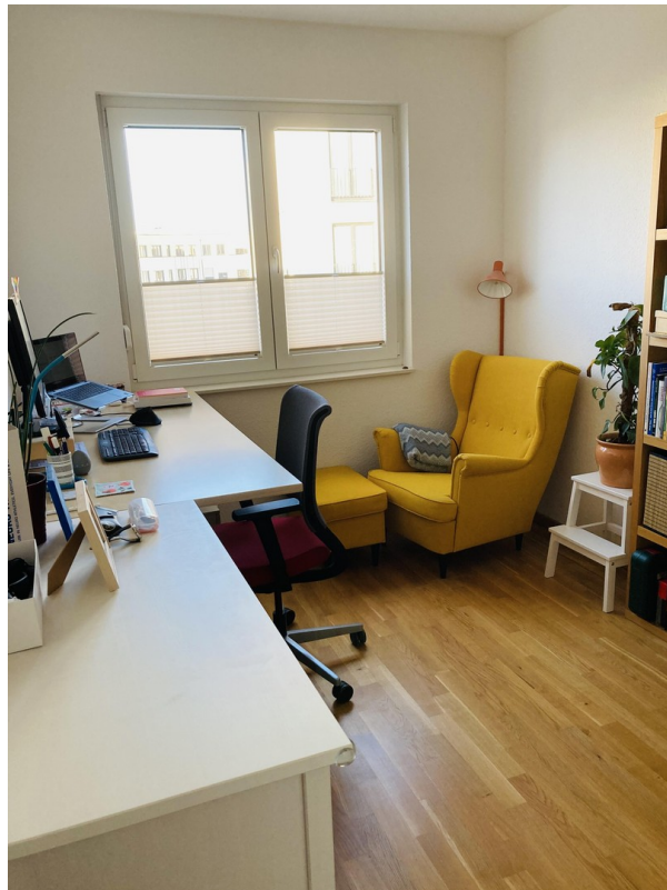
Kinder- oder Arbeitszimmer