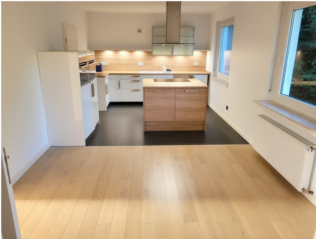
Offene Küche und Essplatz