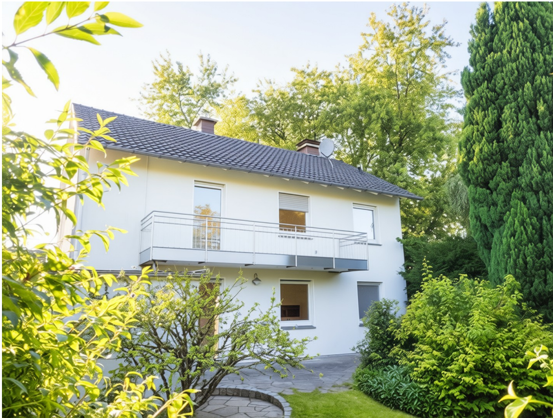
Ansicht aus dem Garten