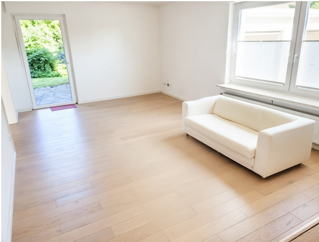
Wohnzimmer mit Gartenausgang