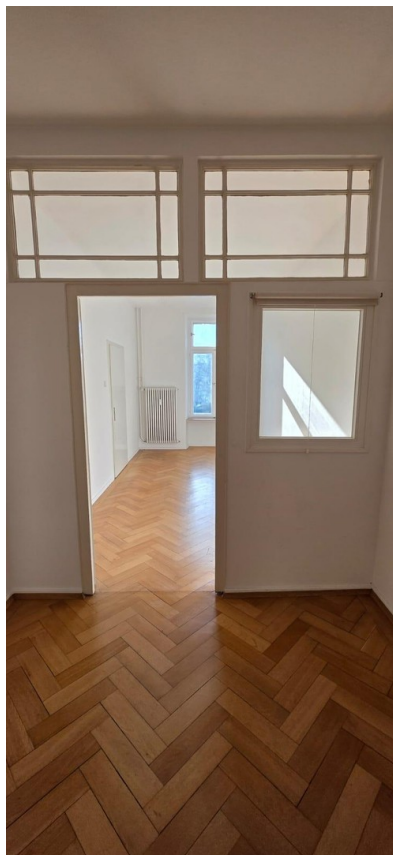
Raum 2 /Vorraum