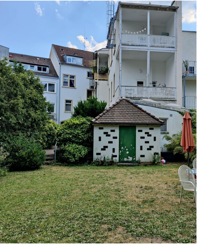
Von der Gartenseite