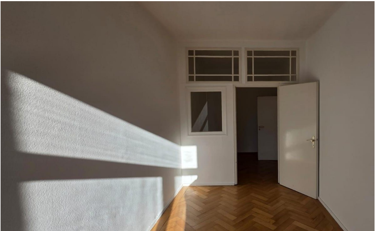
Raum2 zum Vorraum