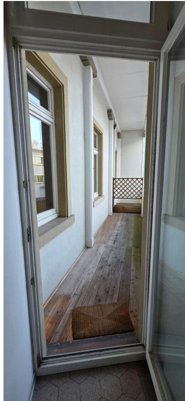
Balkon zum Hof