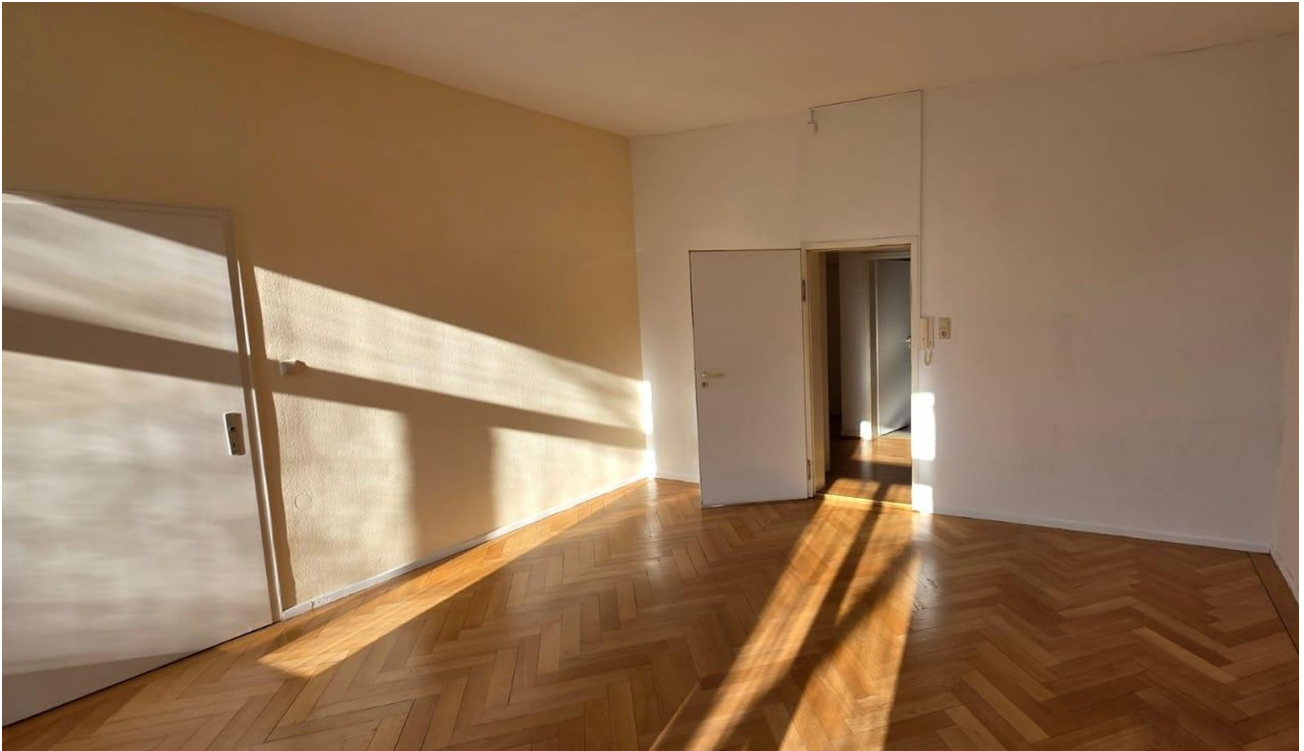
Raum 1 zum Flur