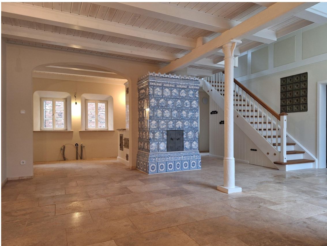
Offenes wohnen / Konzept