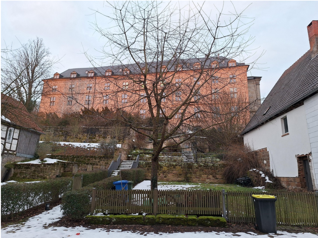
Freie Blick auf Schloss