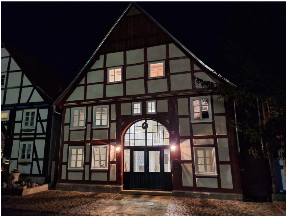
Repräsentativ - in der Nacht