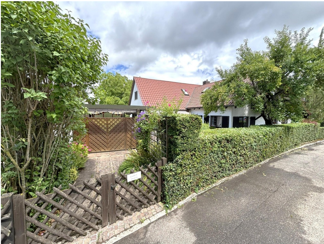
Hausansicht m. Zufahrt Carport