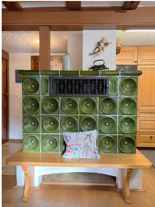
Kachelofen in Wohnküche