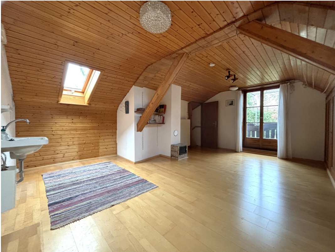
Zimmer - DG (Altbau)