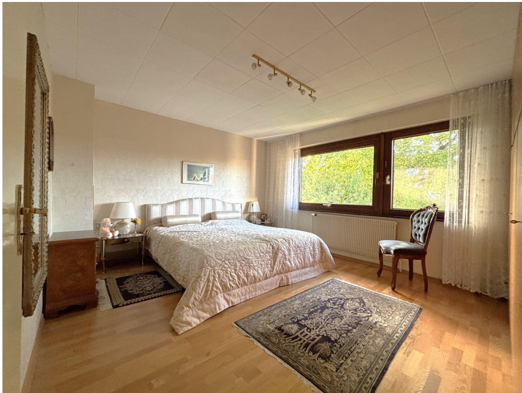
Zimmer - EG (Neubau)