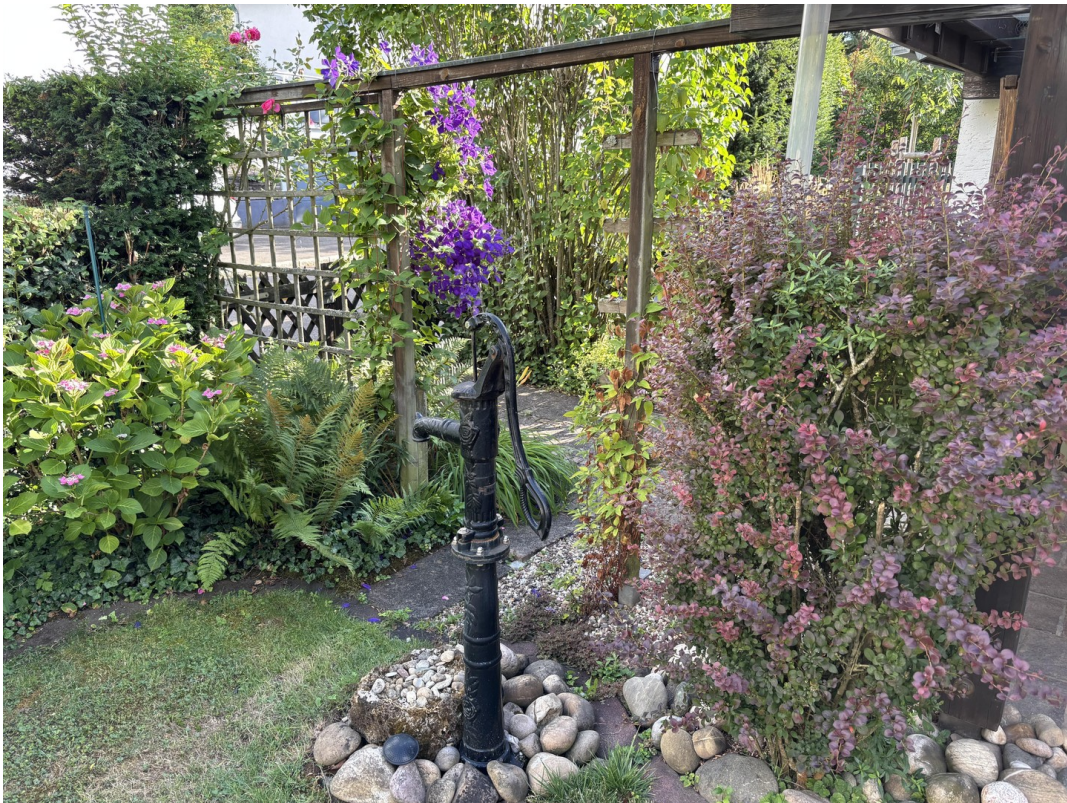
Garten auf EG-Ebene