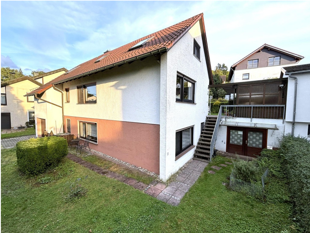
Hausansicht und Geräteraum