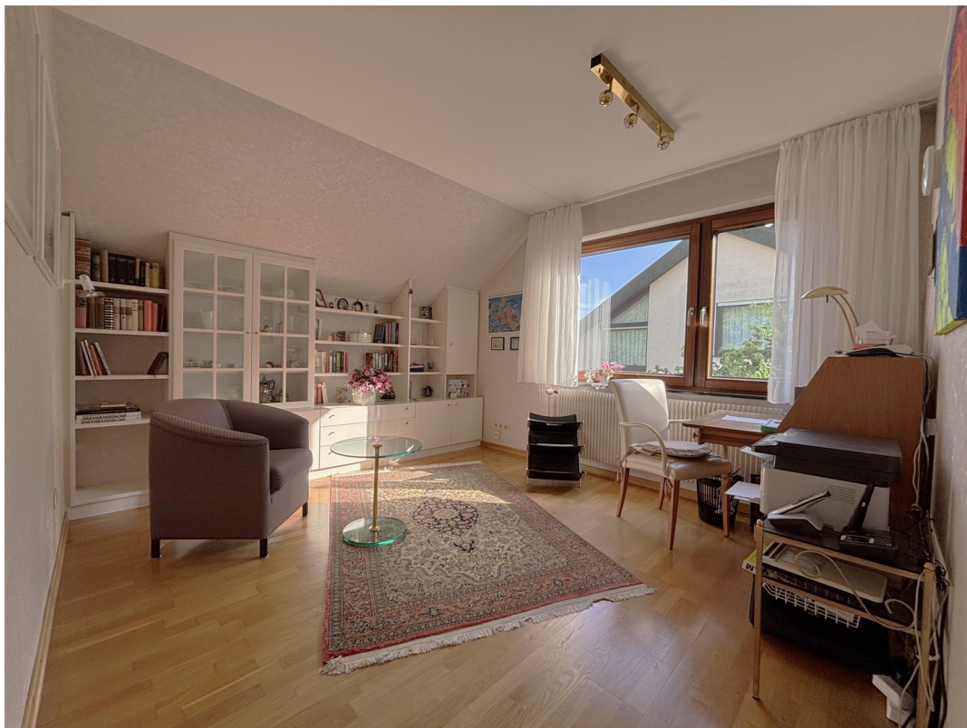
Zimmer - EG (Neubau)