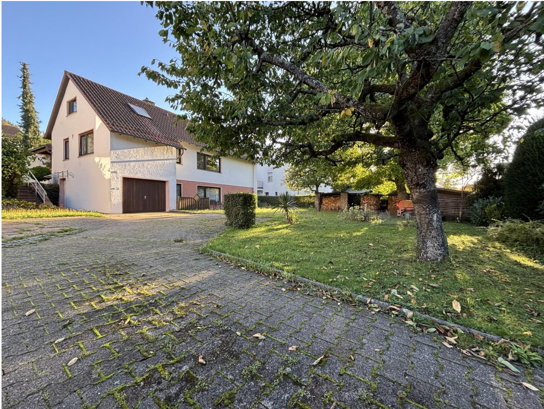
Hausansicht von Zufahrt im UG