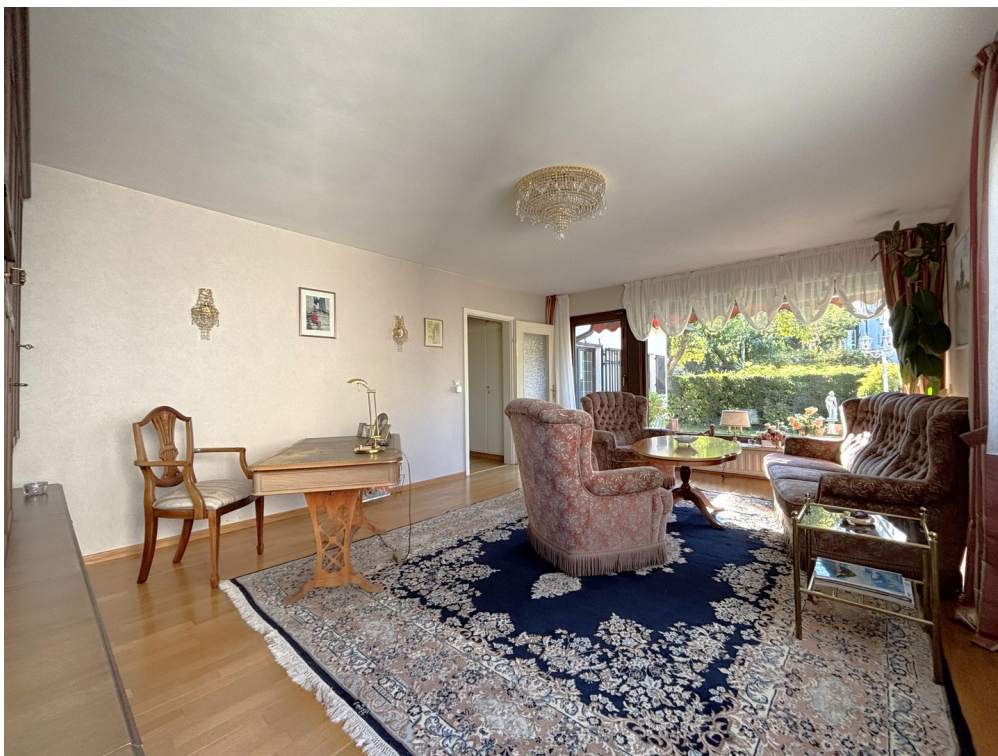
Wohnzimmer - EG (Neubau)