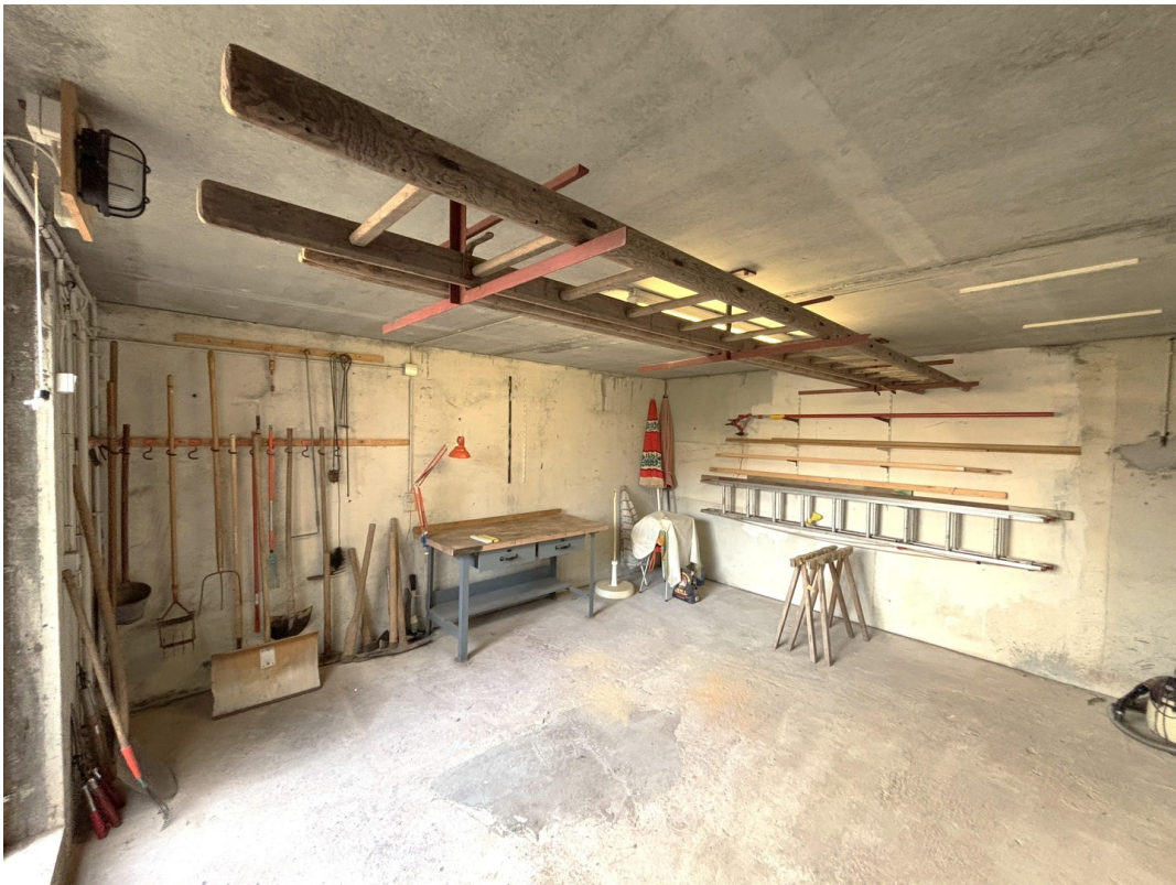
Geräteraum im UG