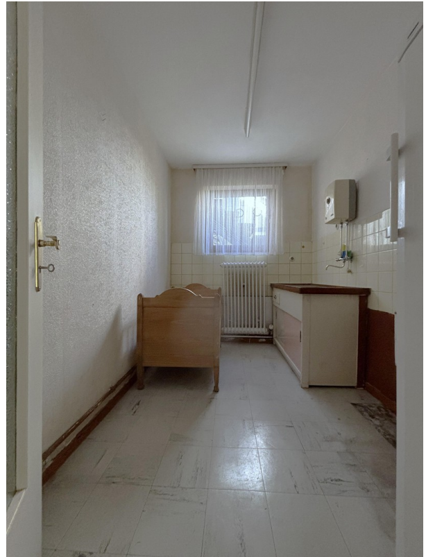
ehem. Küche - UG (Neubau)