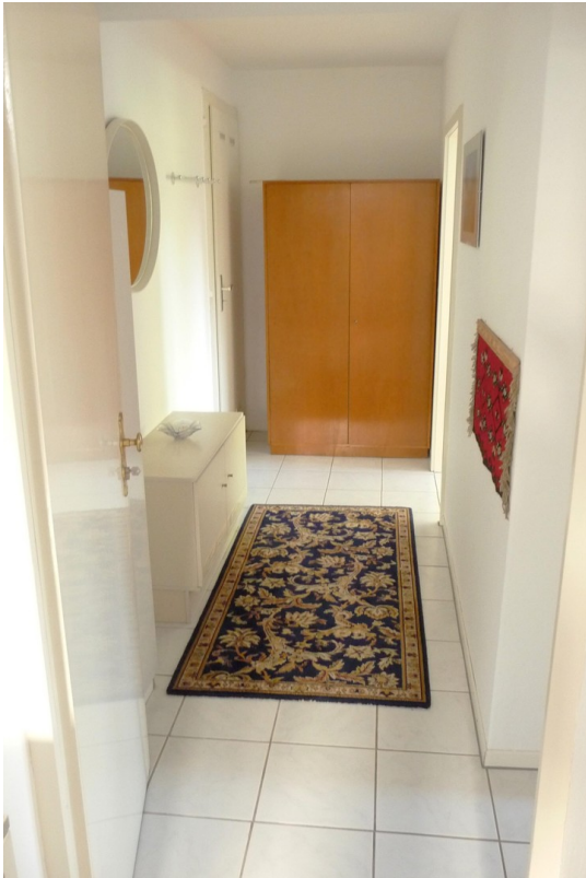
Flur - UG (Neubau)