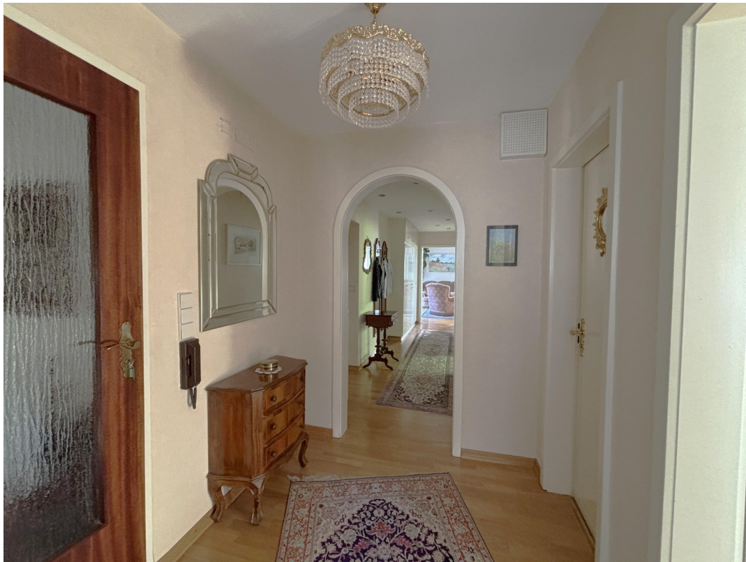
Foyer - EG (Neubau)