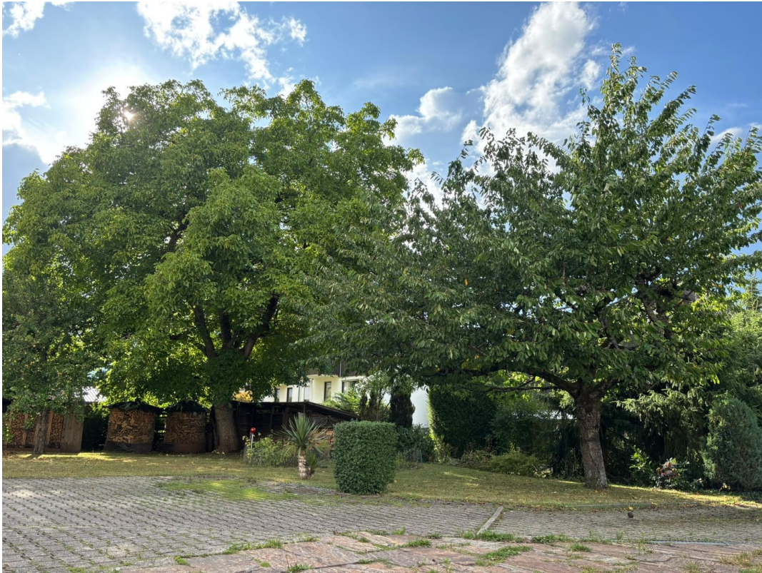
Nussbaum und Kirschbaum