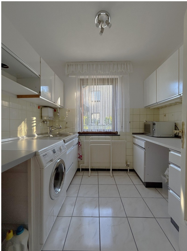
Arbeitsraum - EG (Neubau)