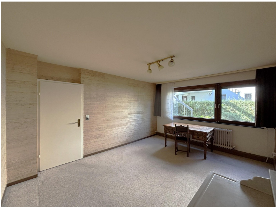
Zimmer - UG (Neubau)