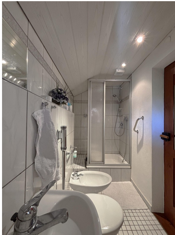
Gäste-WC m. Dusche - EG Altbau