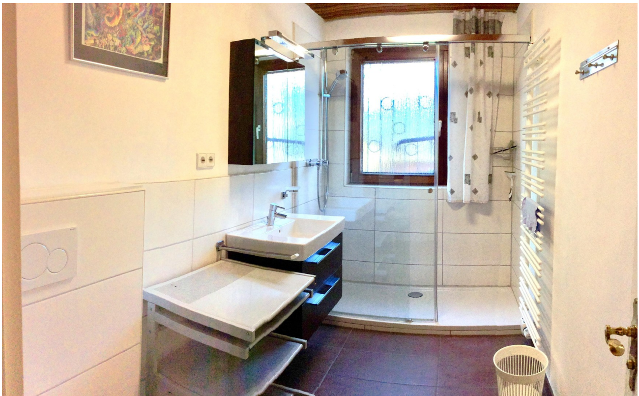
Duschbad - UG (Neubau)