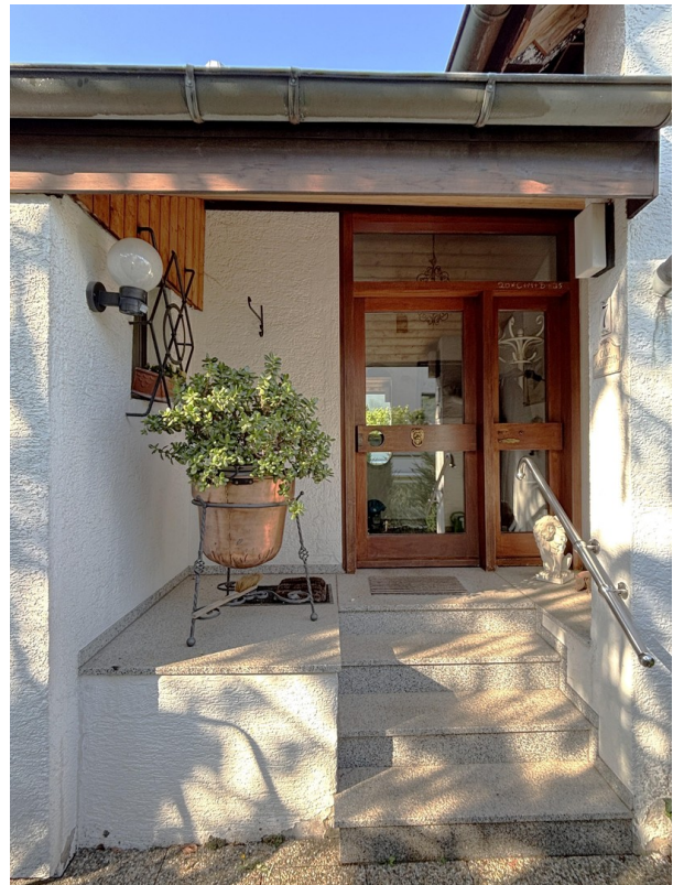
Eingang Windfang - EG