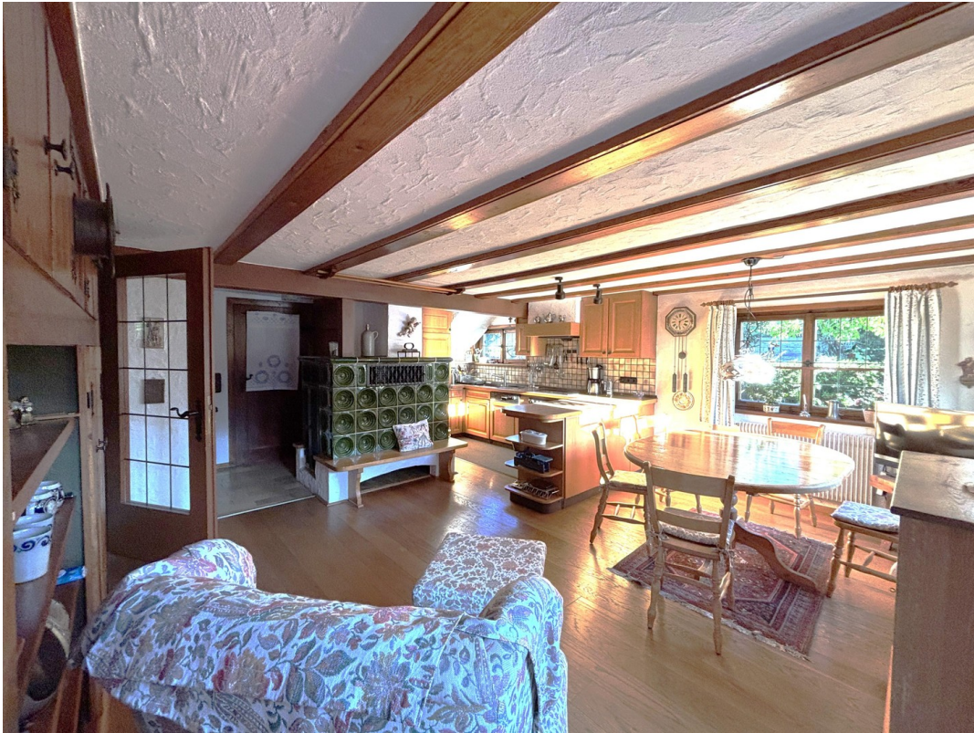
Wohnküche - EG (Altbau)