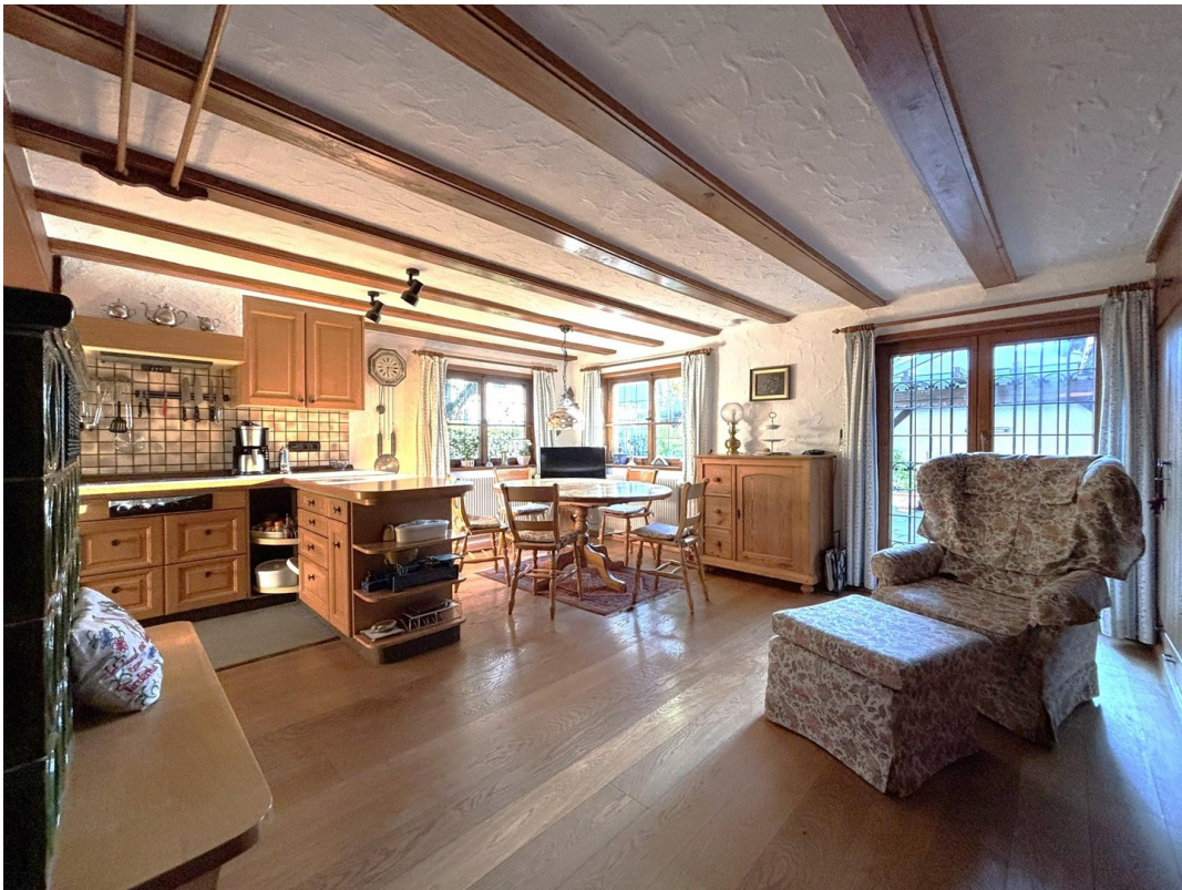
Wohnküche - EG (Altbau)