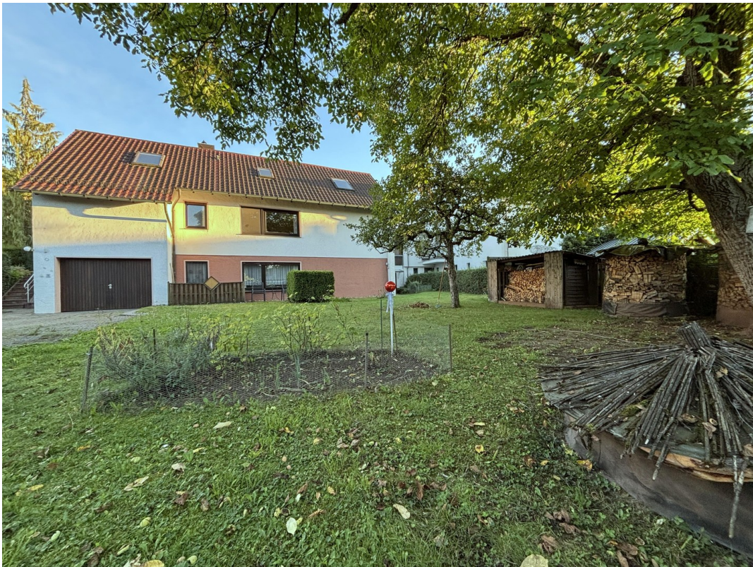
Hausansicht vom Garten im UG