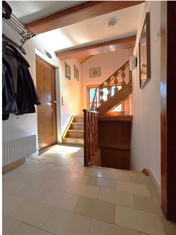
Diele - EG (Altbau)