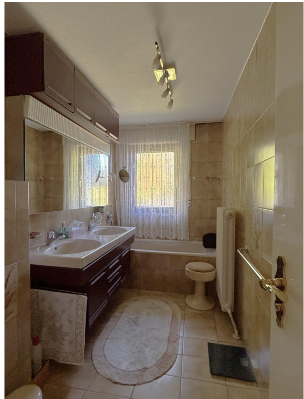
Bad - EG (Neubau)