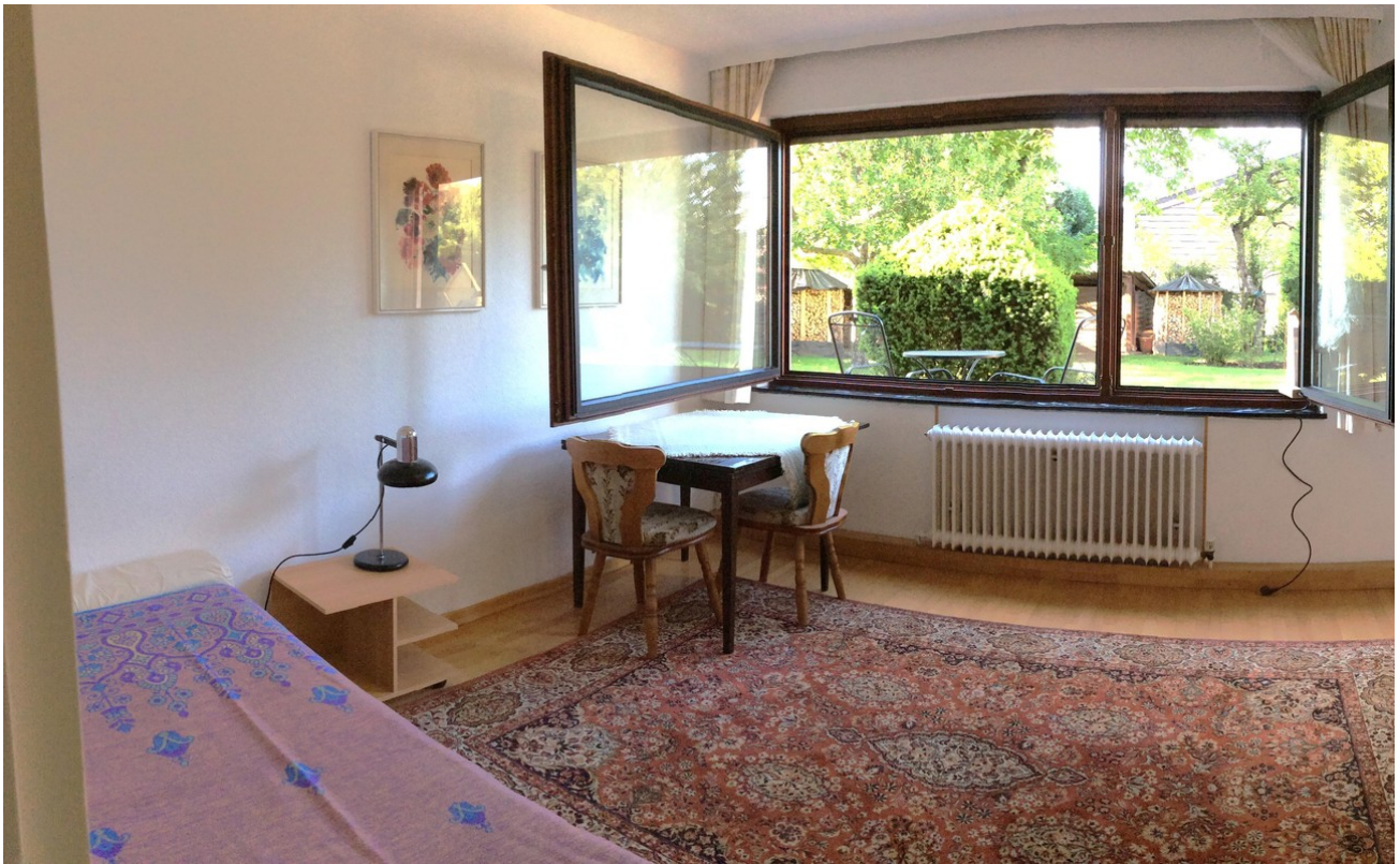
Zimmer - UG (Neubau)