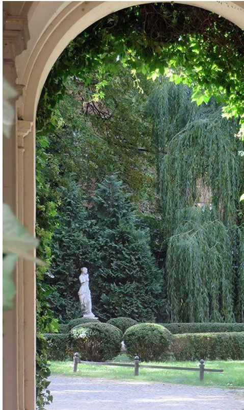
Durchfahrt zum Hofgarten