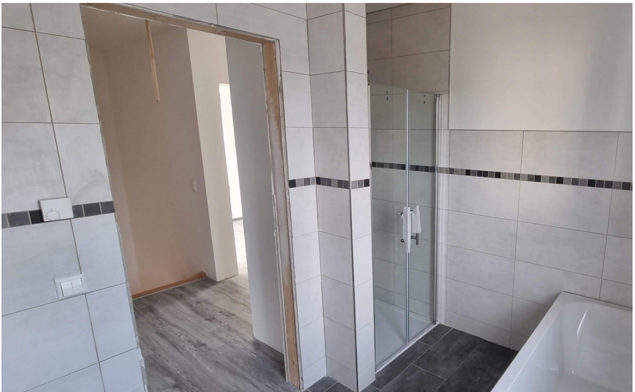
Vollbad mit Dusche