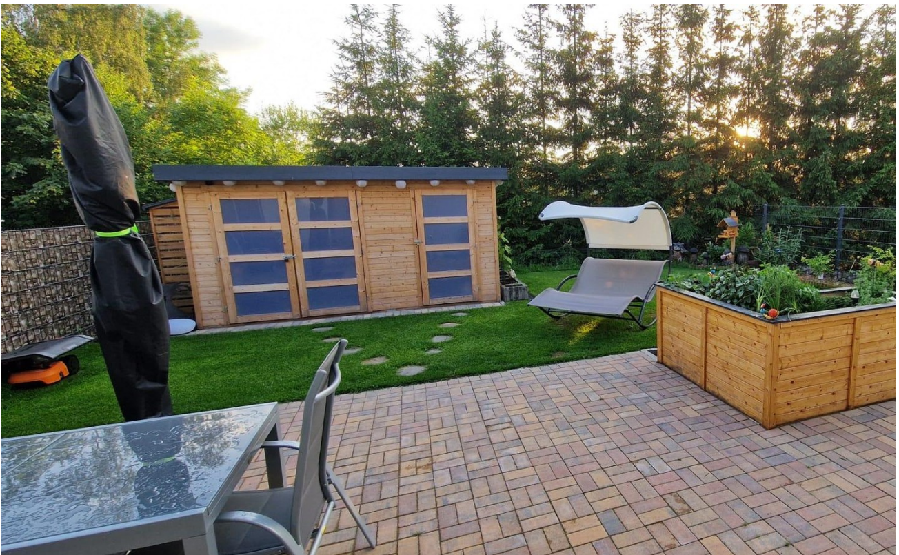
Terrasse, Gartenhaus, Hochbeet