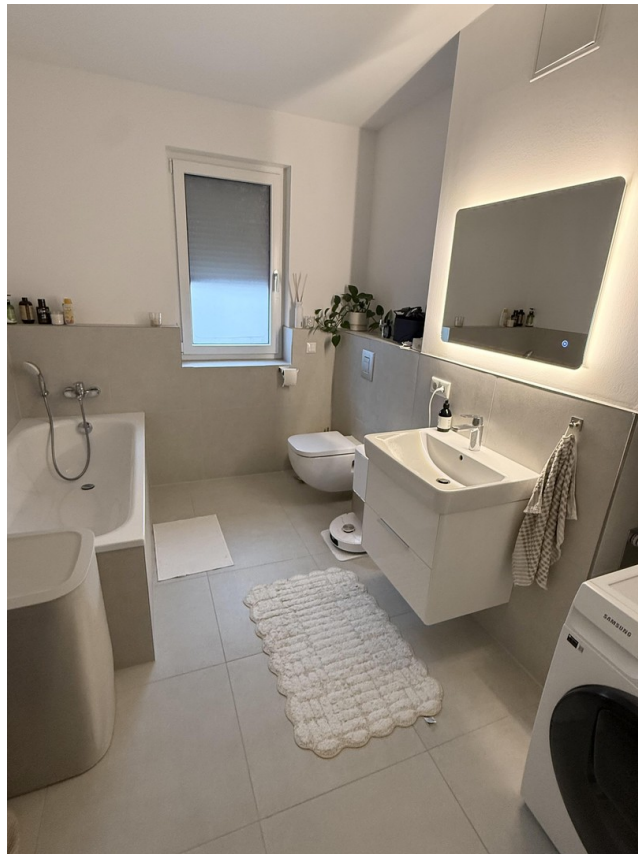
Großes Bad mit Badewanne