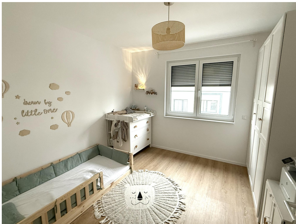
Kinder- oder Arbeitszimmer