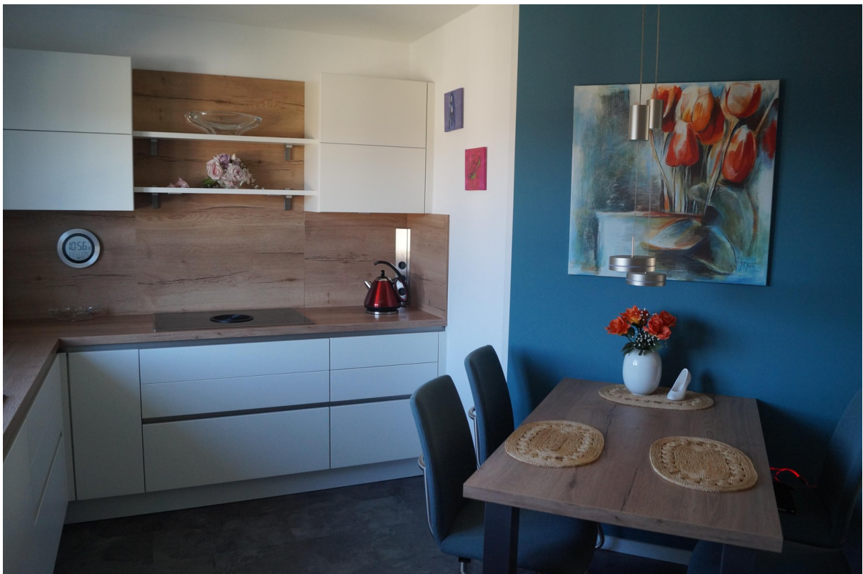
Küche und Essecke