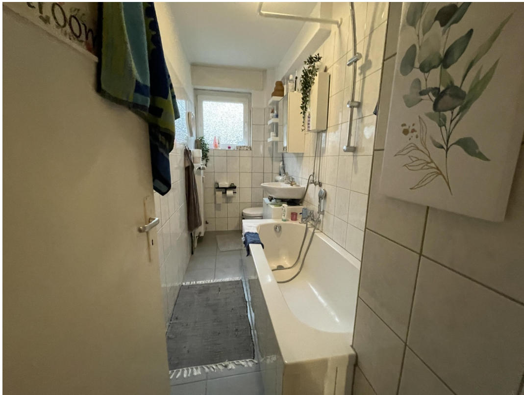
Vollbad mit Fenster