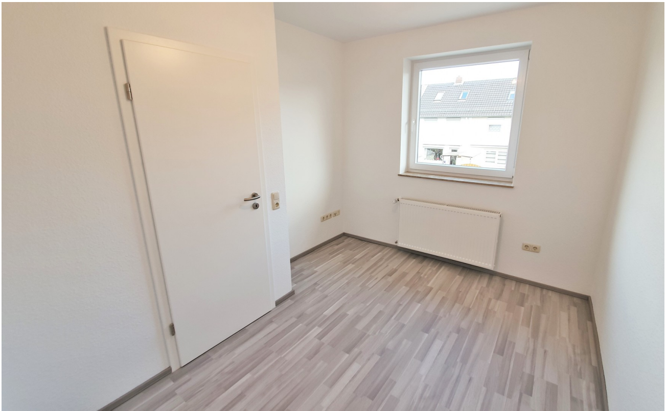
Kinderzimmer im 1. OG