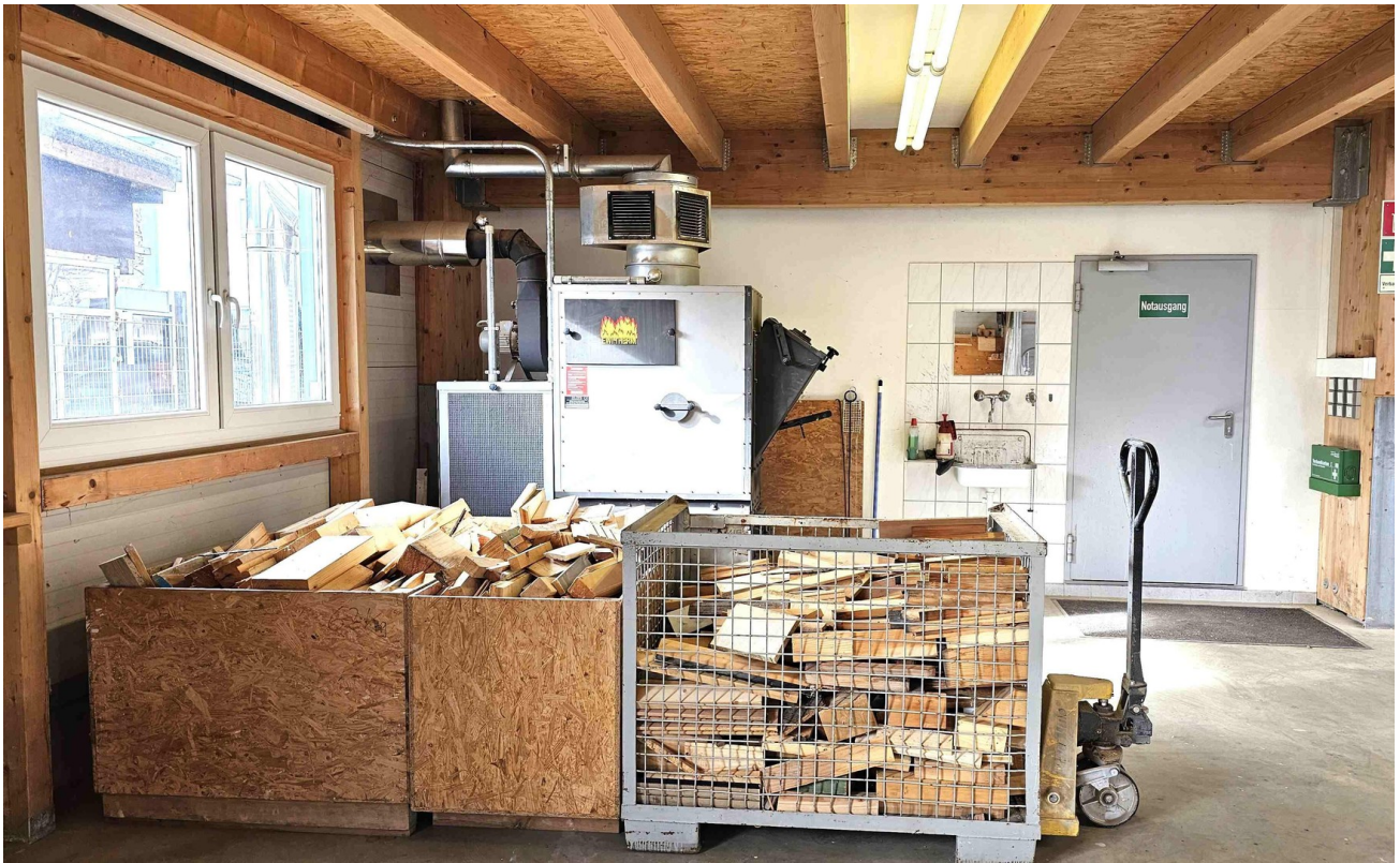
Holzheizung Variante A