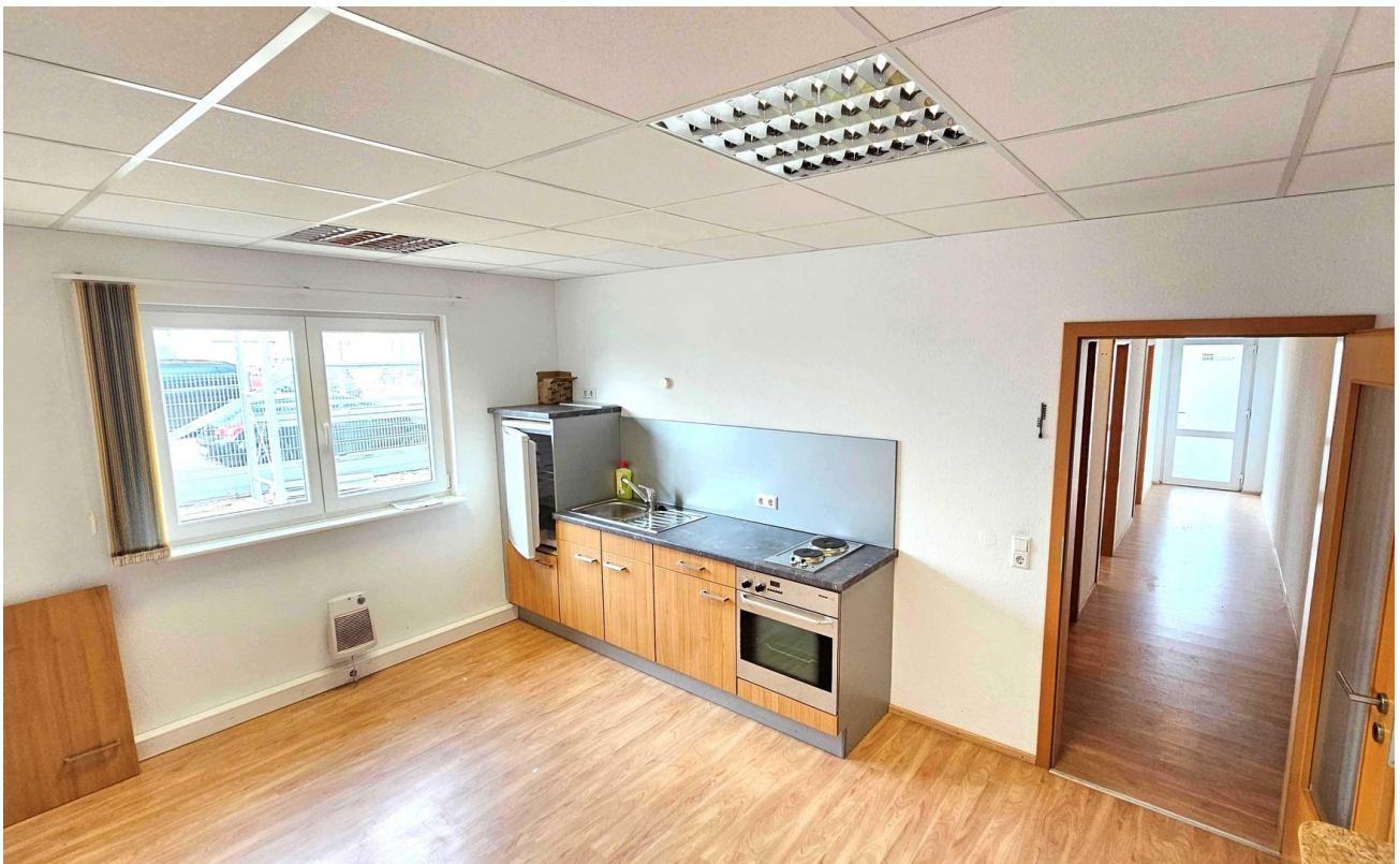
Aufenthaltsraum mit Teeküche