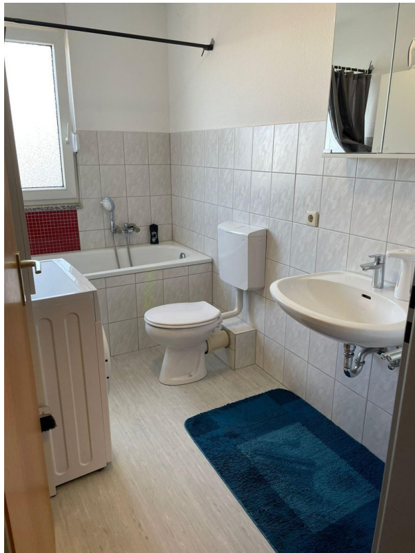
Wannenbad m. Fenster