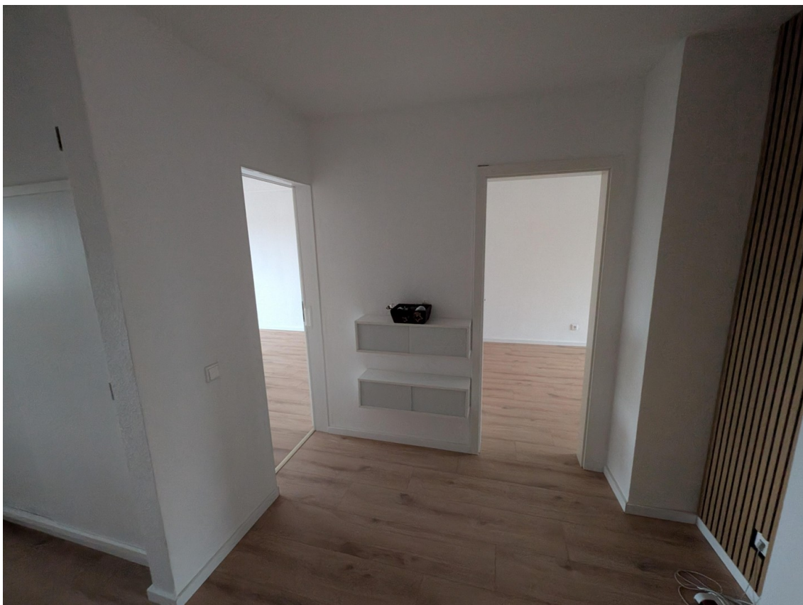
Flur von Eingangstür