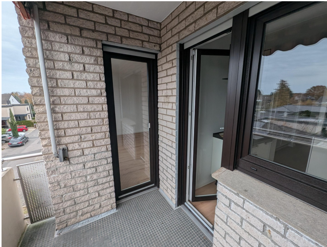
Balkon mit 2 Durchgängen