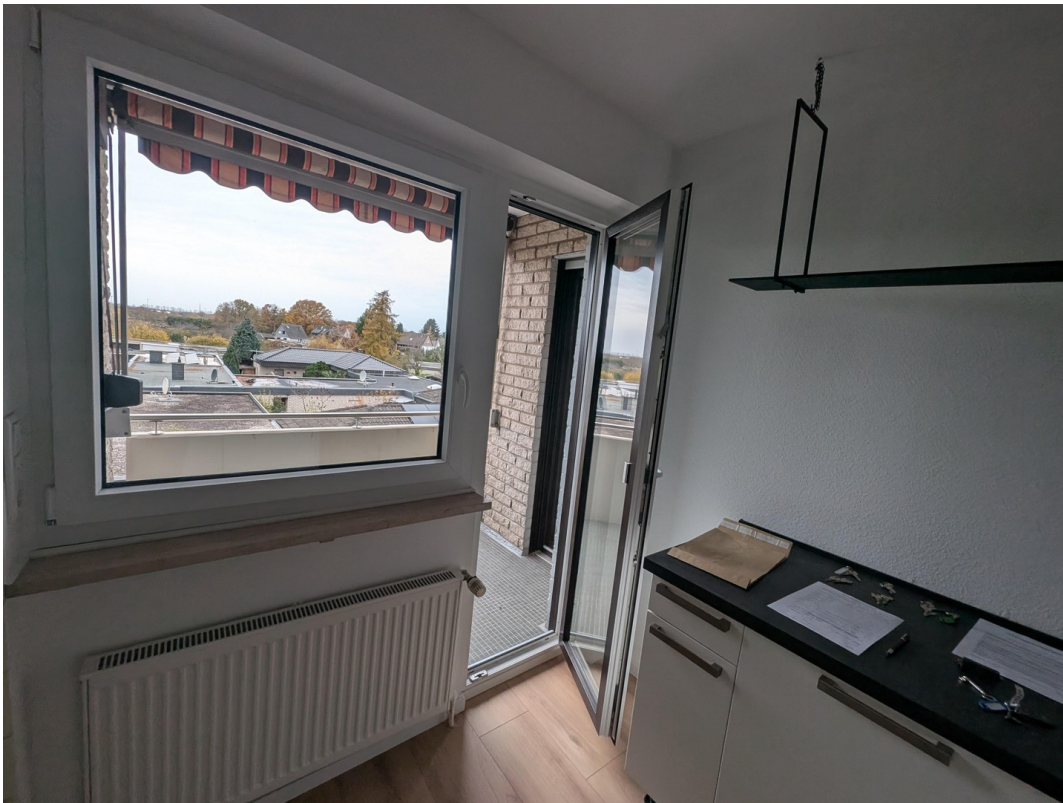
Küche mit Balkontür