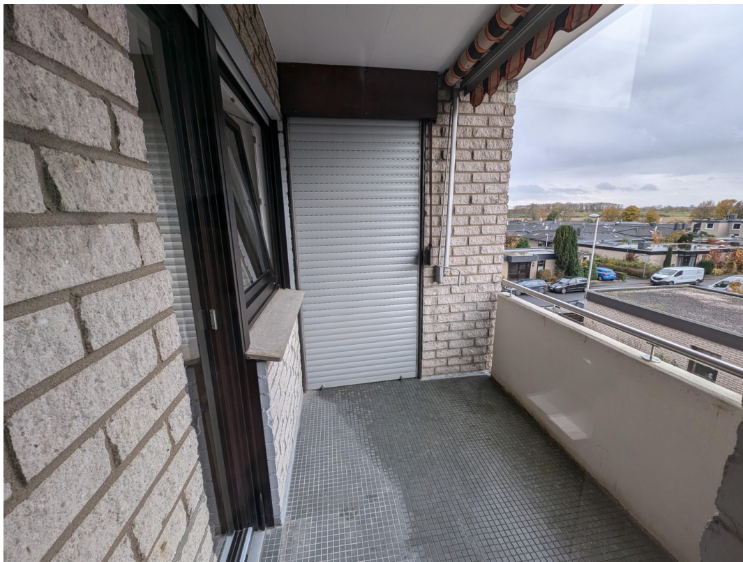
Balkon aus Wohnzimmertür