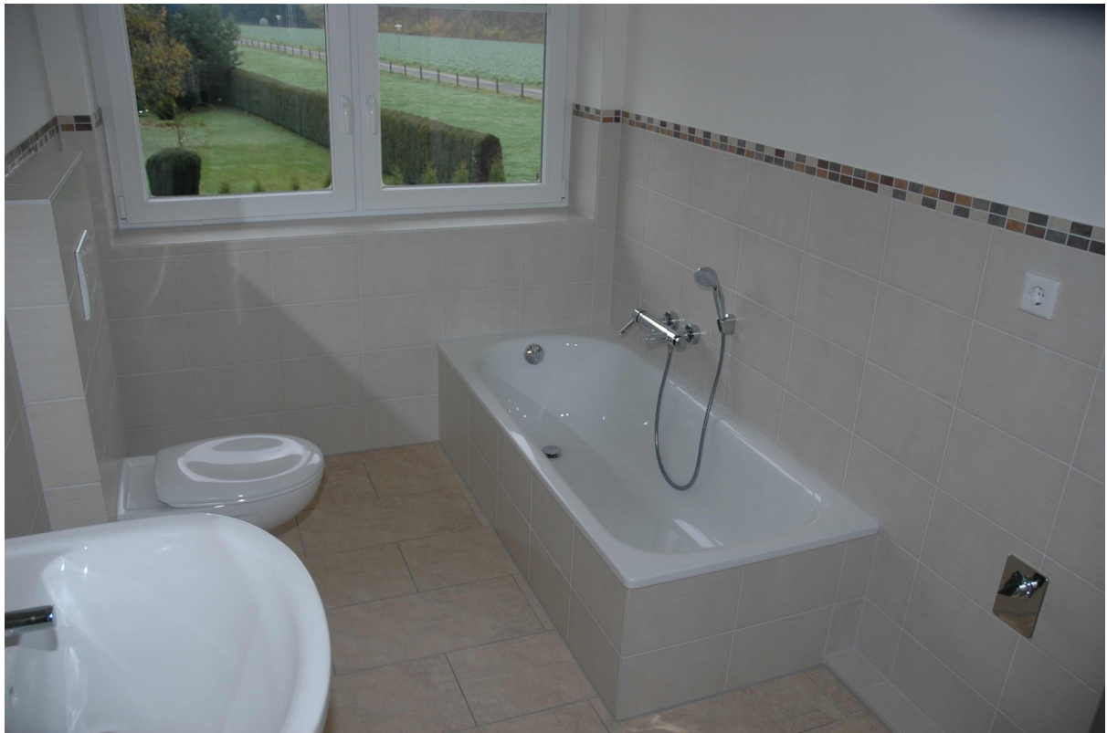
Bad Foto II