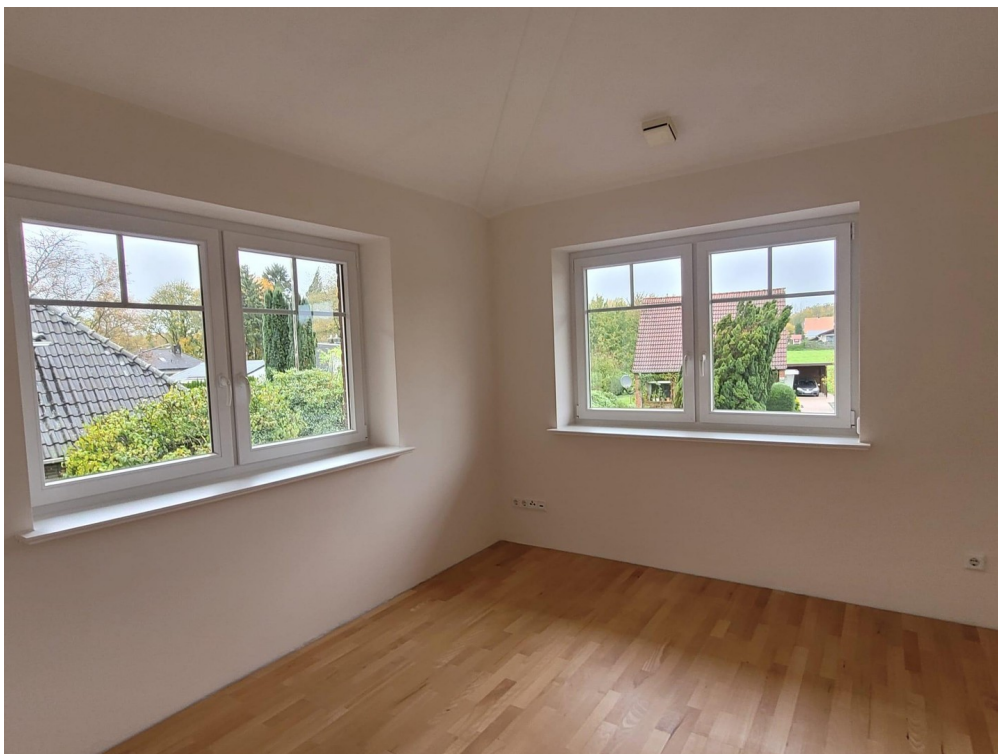
Arbeits- /Kinderzimmer Foto I