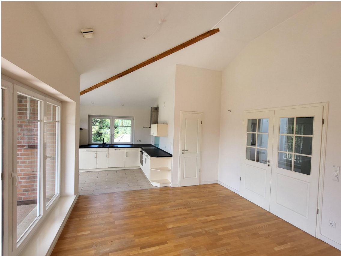
Wohnen mit offener Küche