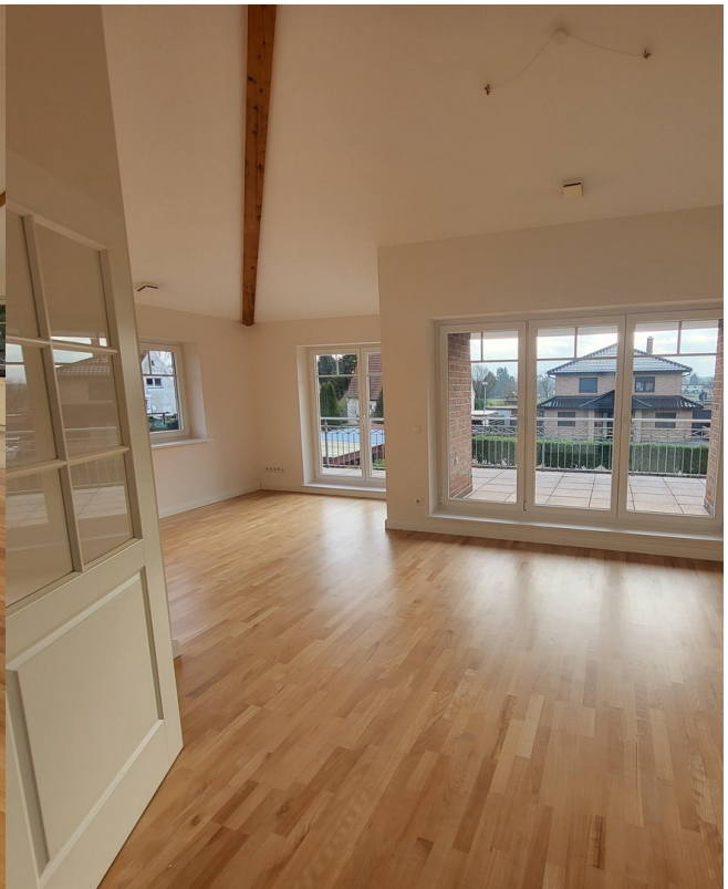
Wohnbereich Foto II