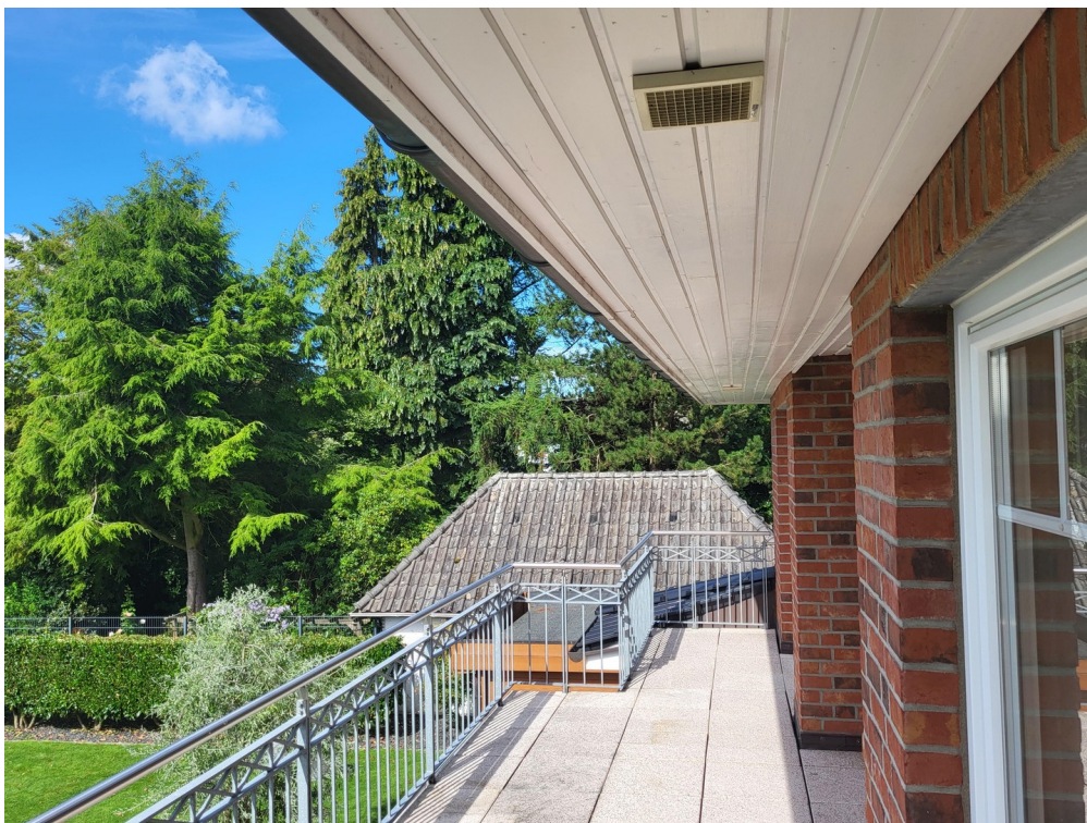
Dachterasse Foto I