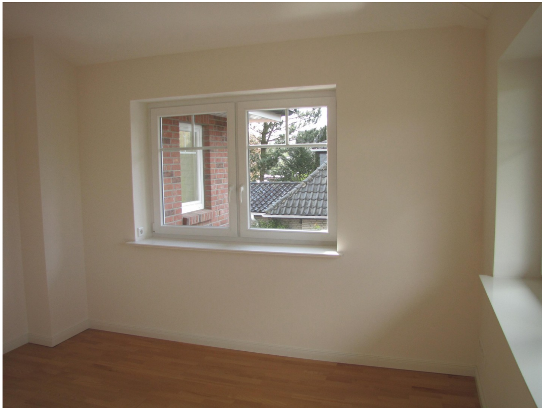
Arbeits-/Kinderzimmer Foto II