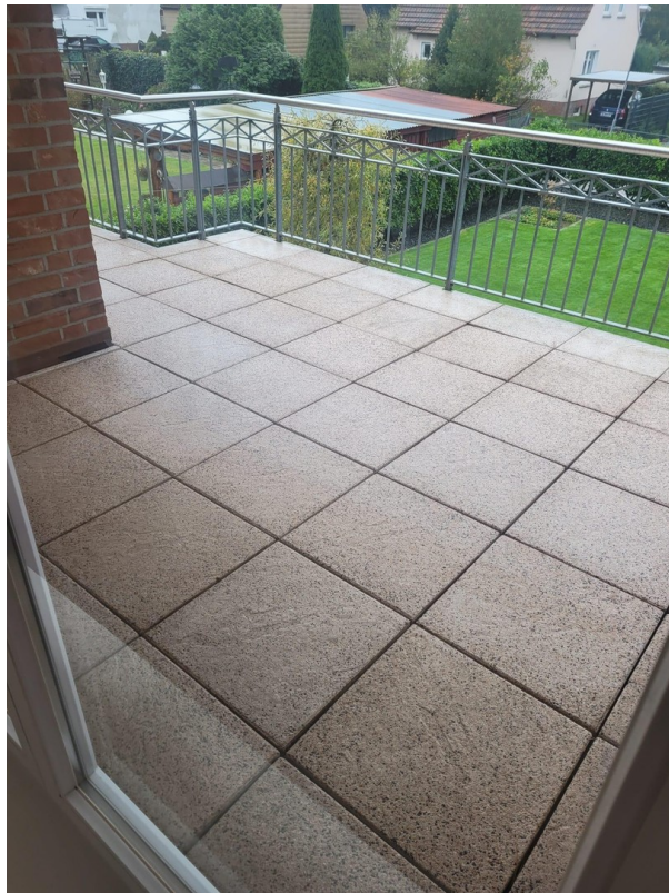
Dachterasse Foto III