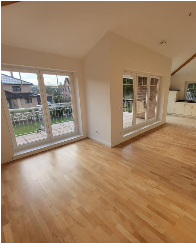
Wohnbereich Foto I