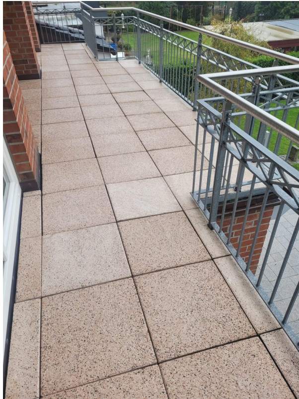
Dachterasse Foto II