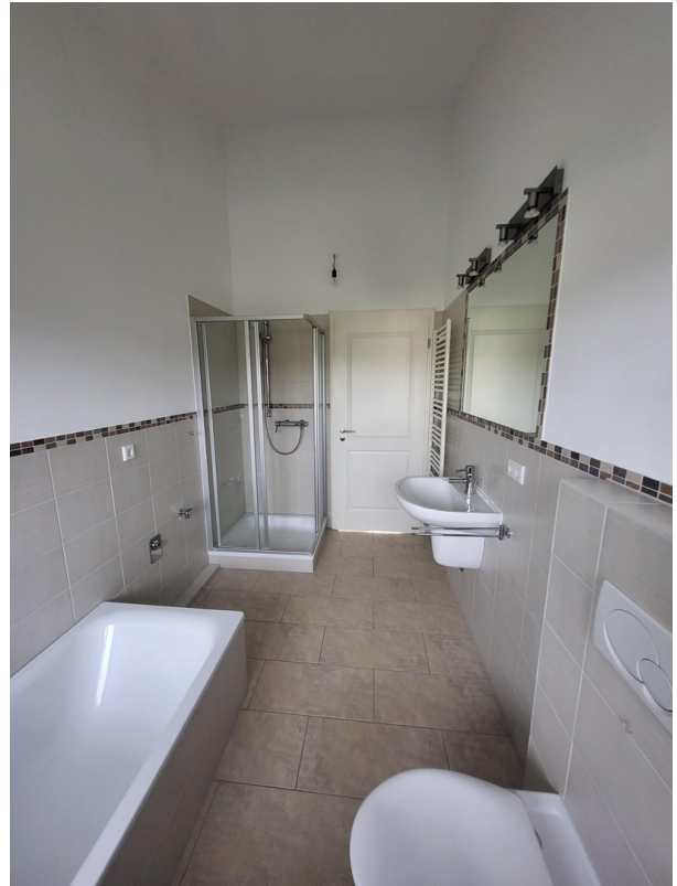
Bad Foto I