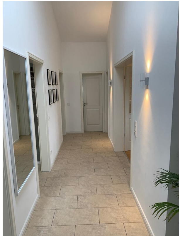
Flur Foto I