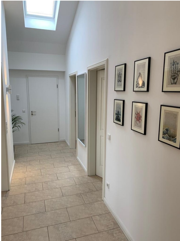
Flur Foto II