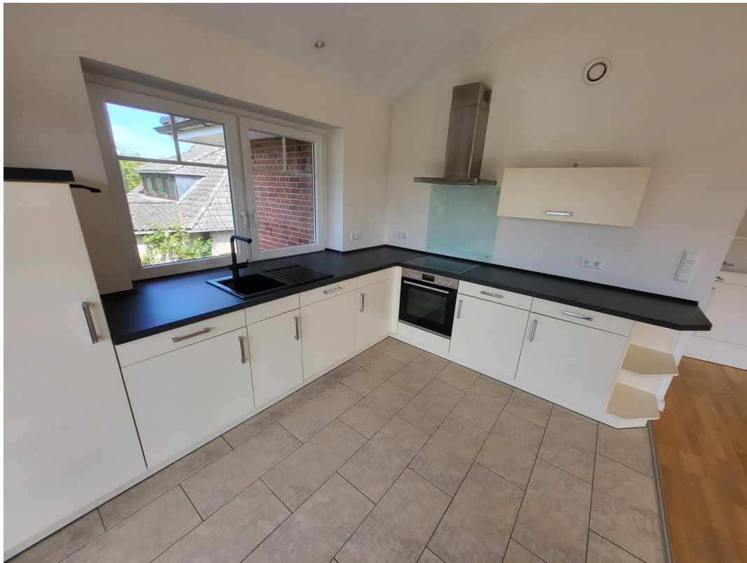
Küche Foto I