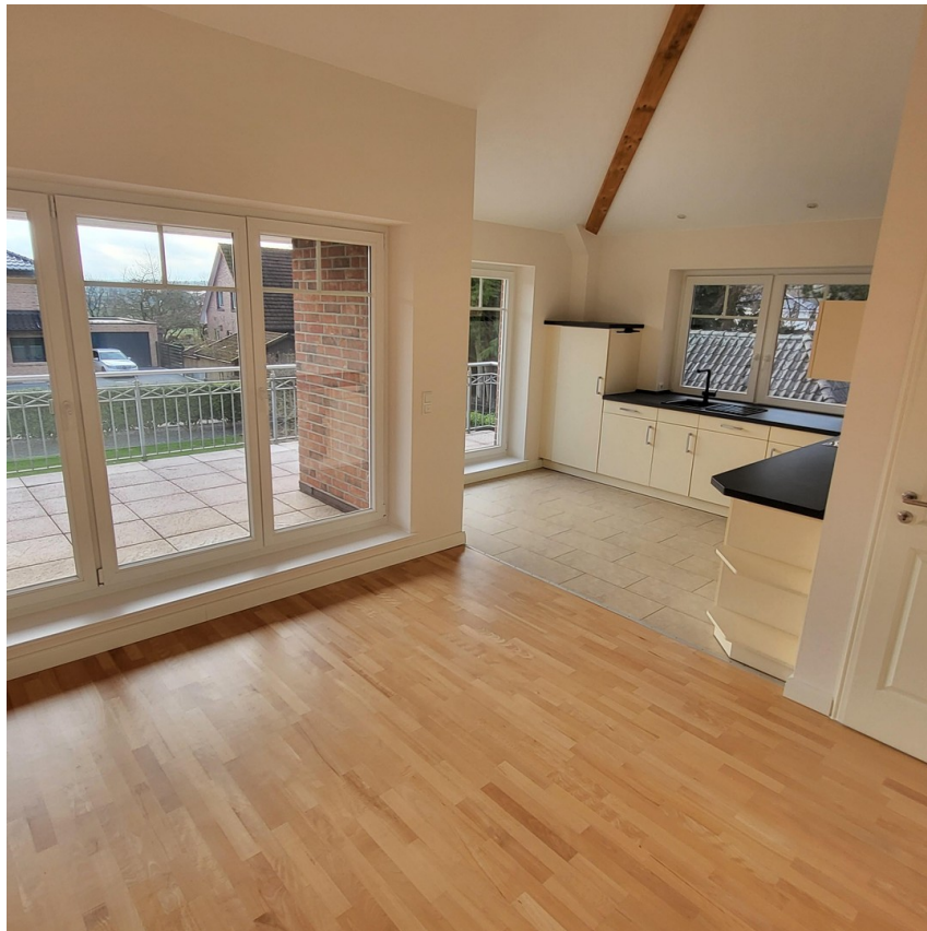
Wohnbereich Foto III