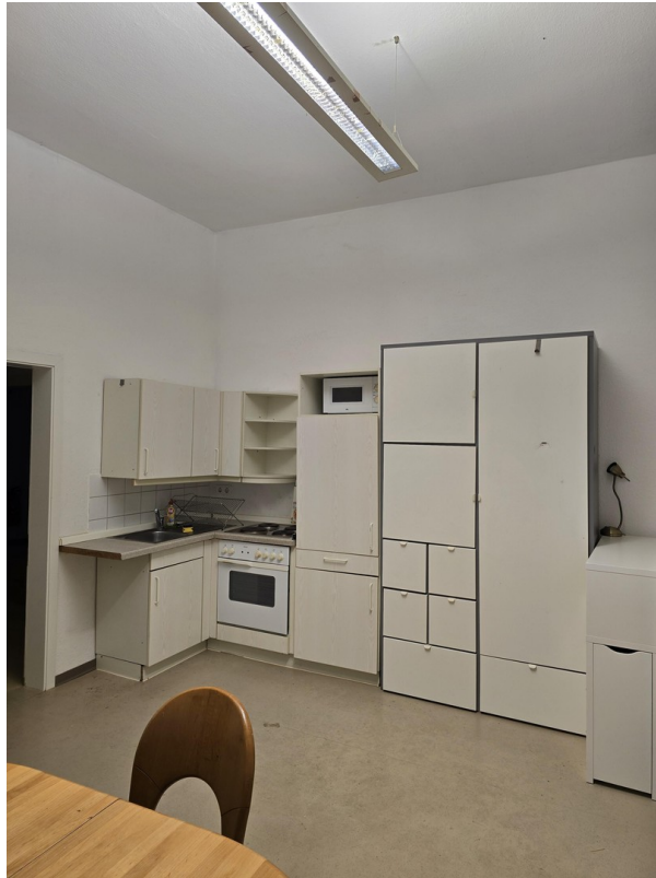
Küchenbereich alte Möblierung