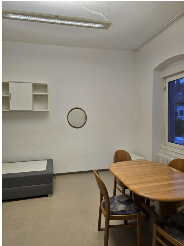
Zimmeransicht alte Möblierung