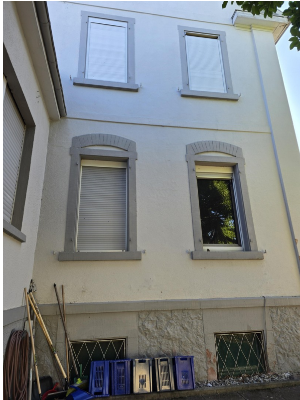
Außenansicht auf die Zimmerfen