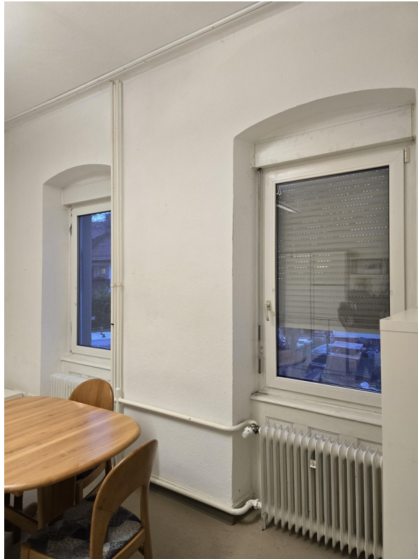
Zimmeransicht alte Möblierung