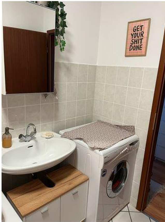
Waschmaschine 50,- €