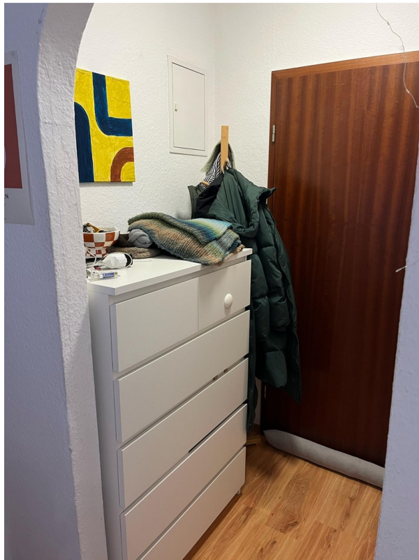
Kommode 40,- €