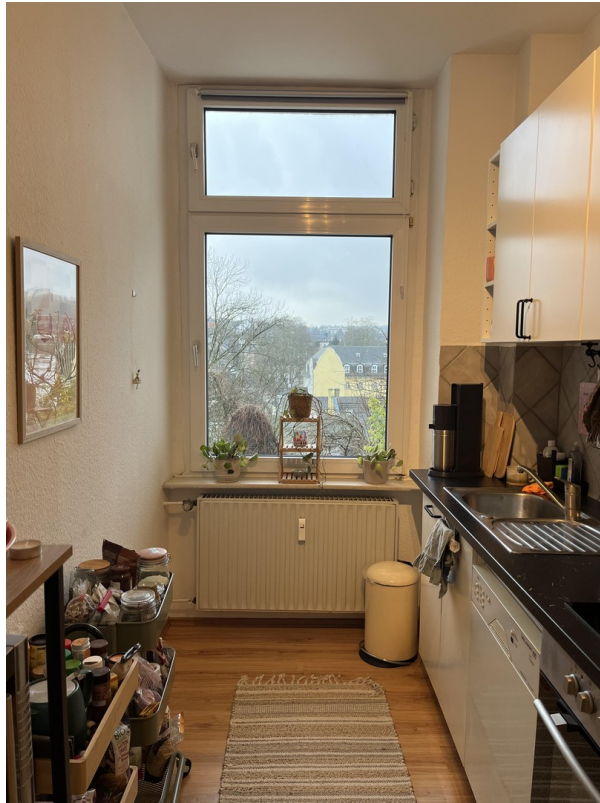
Blick Richtung Nordstadt/Süden