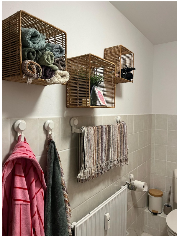
Bad Regale u. Unterschr. 50,-