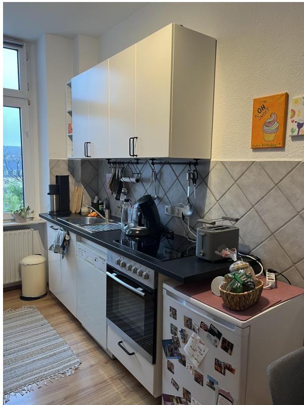
Küche 300,- € komplett