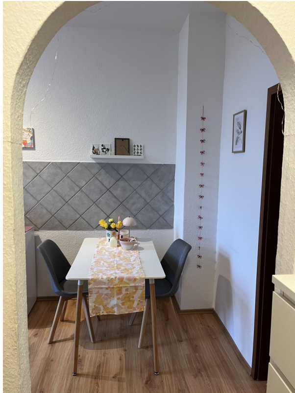
Tisch u. Stühle VB 50,- €