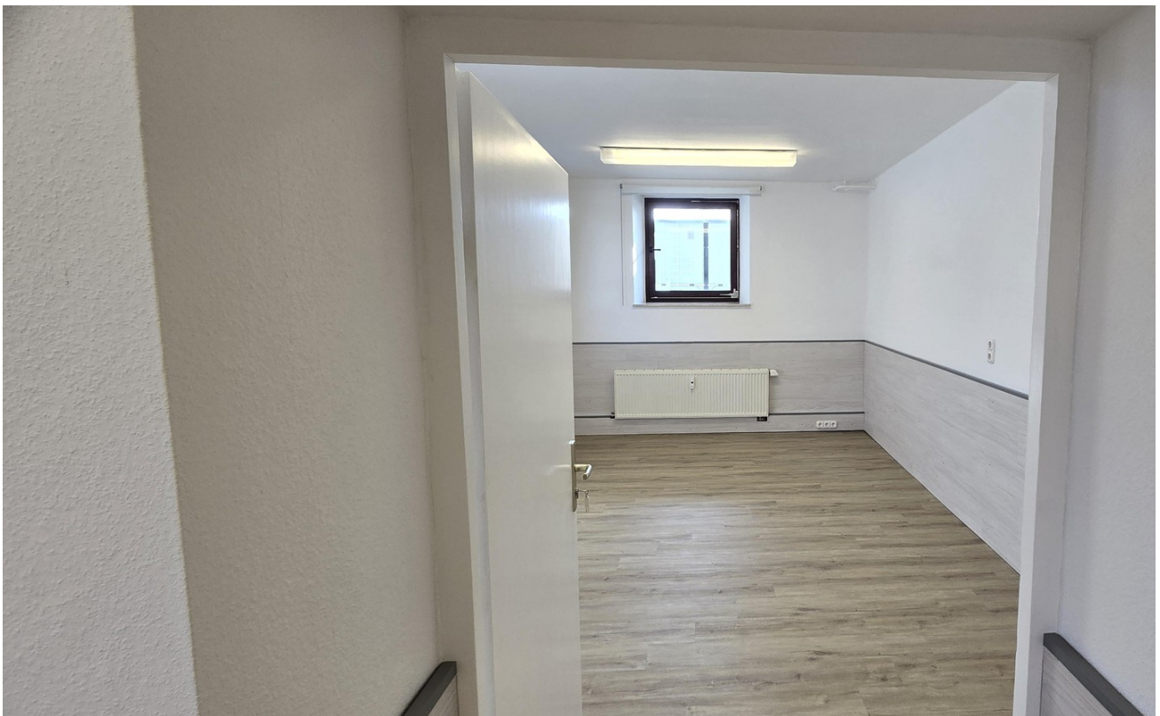
Eingang Büroraum 2