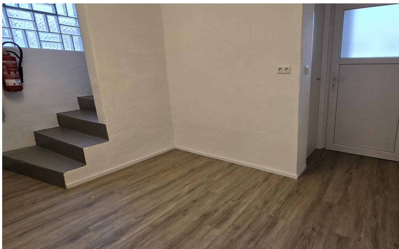
Haupteingang / Garderrobe