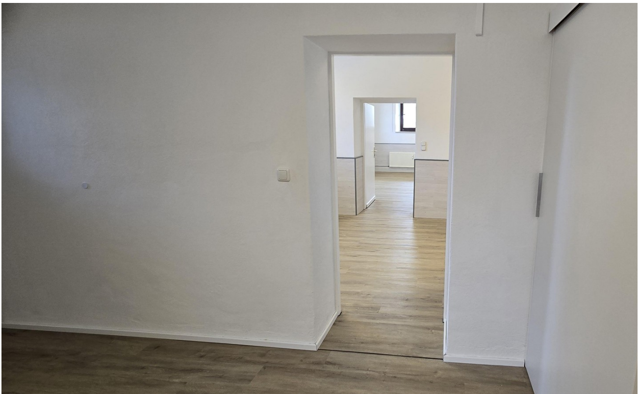
Eingang zu den Büroräumen