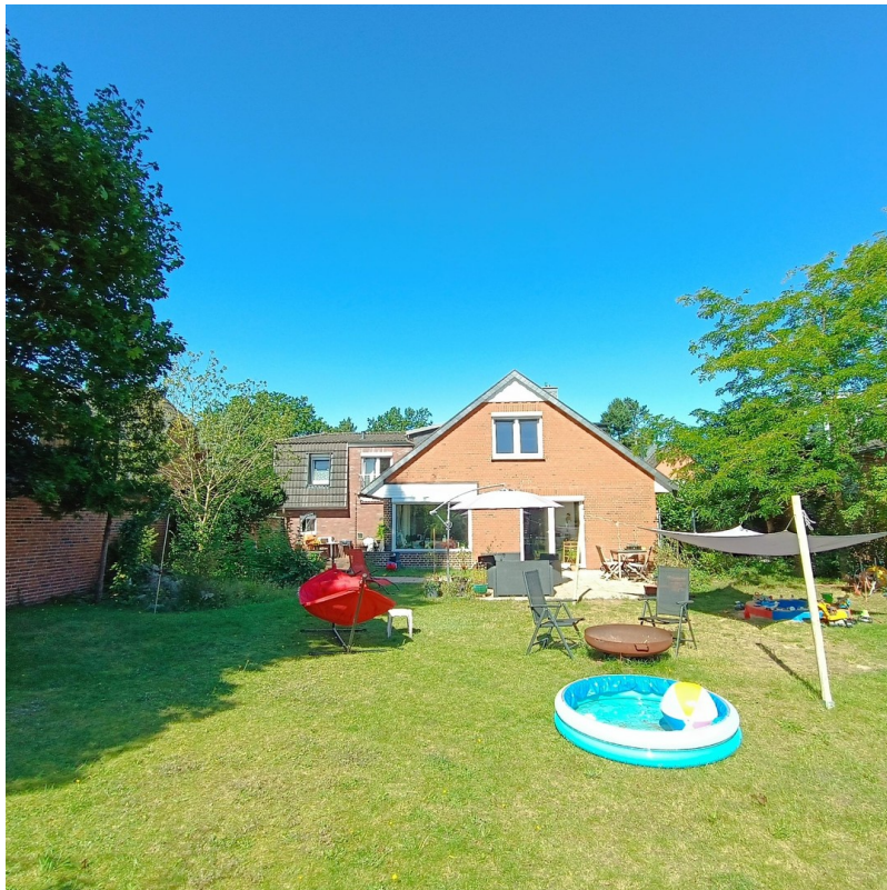
Haus_ weitere Flucht