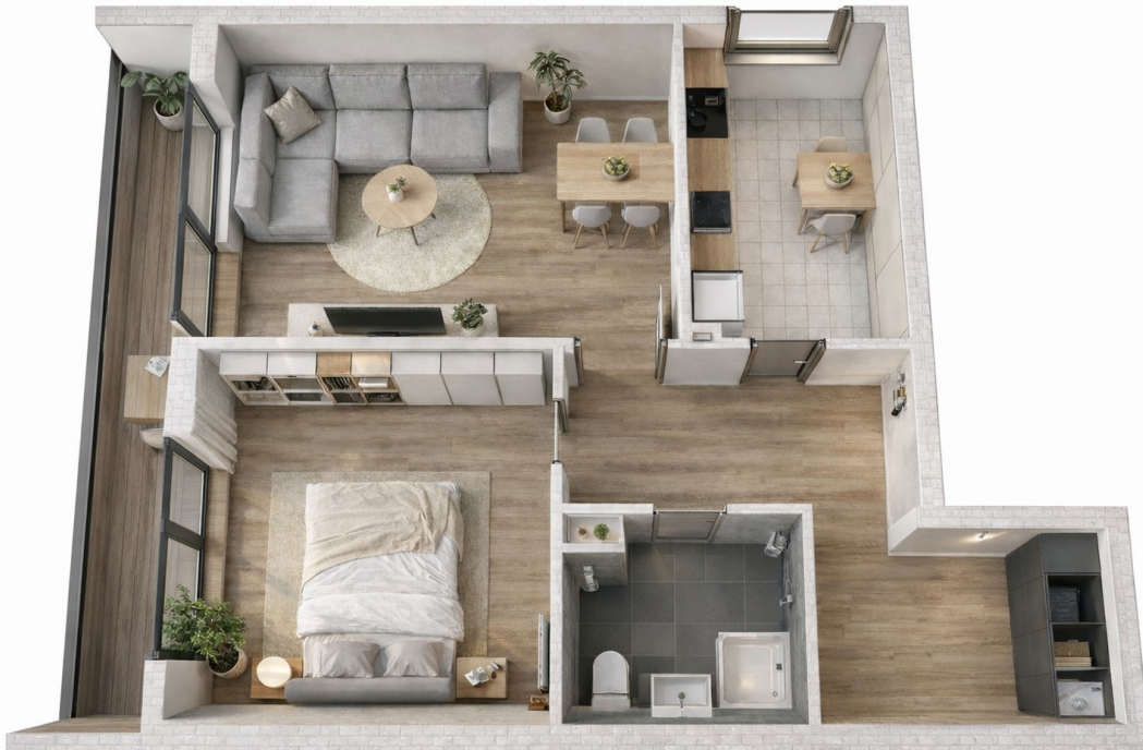
Beispielmöblierung mittels KI