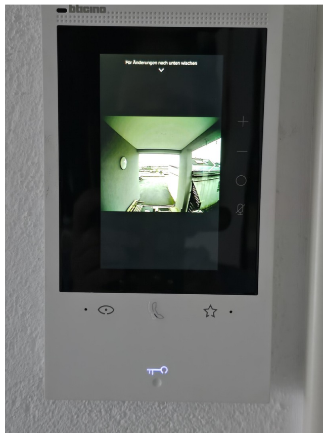
Videosprechanlage im EG und OG