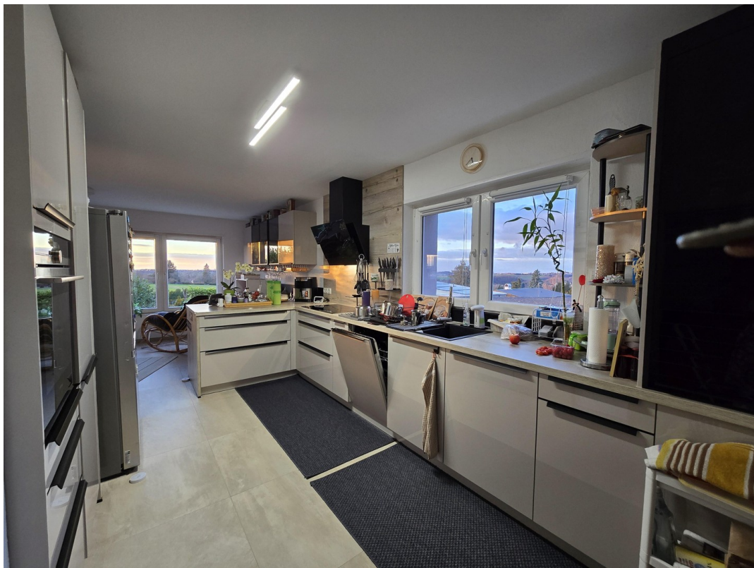
moderne Küche OG