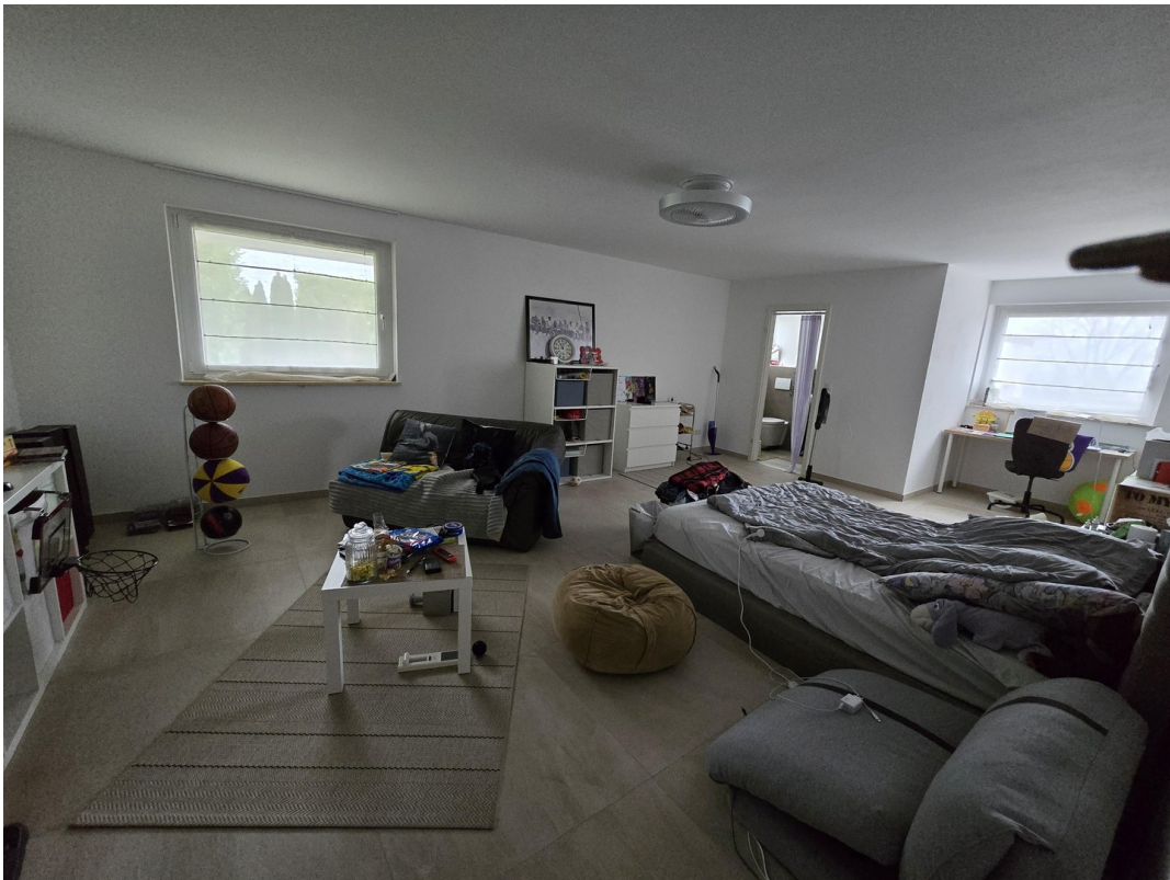
Schlafz. mit Bad en Suite EG