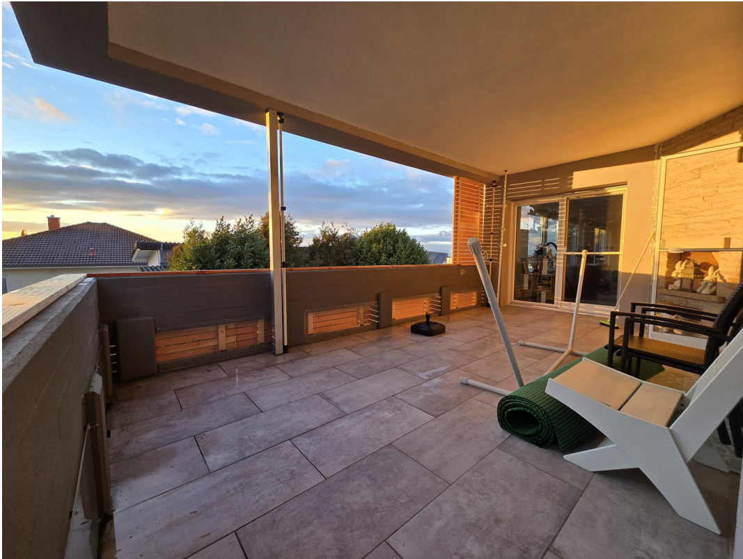
großer Balkon mit Kamin OG