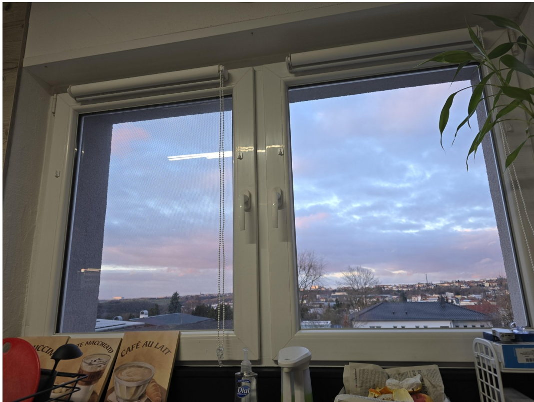
Ausblick Küche OG