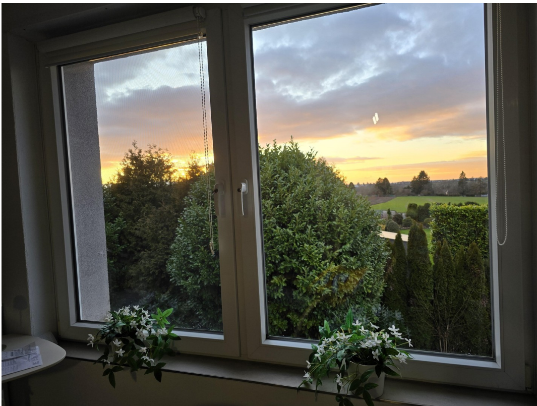
Ausblick Esszimmer OG