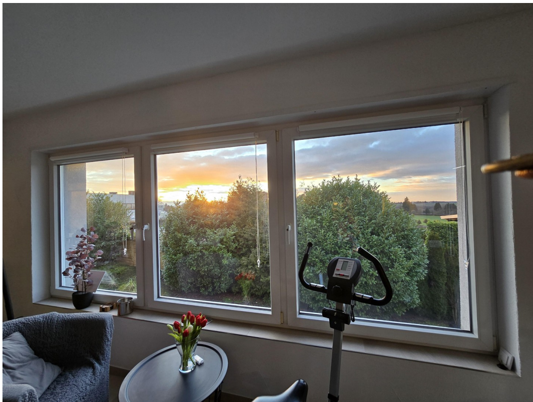
Ausblick Wohnzimmer OG