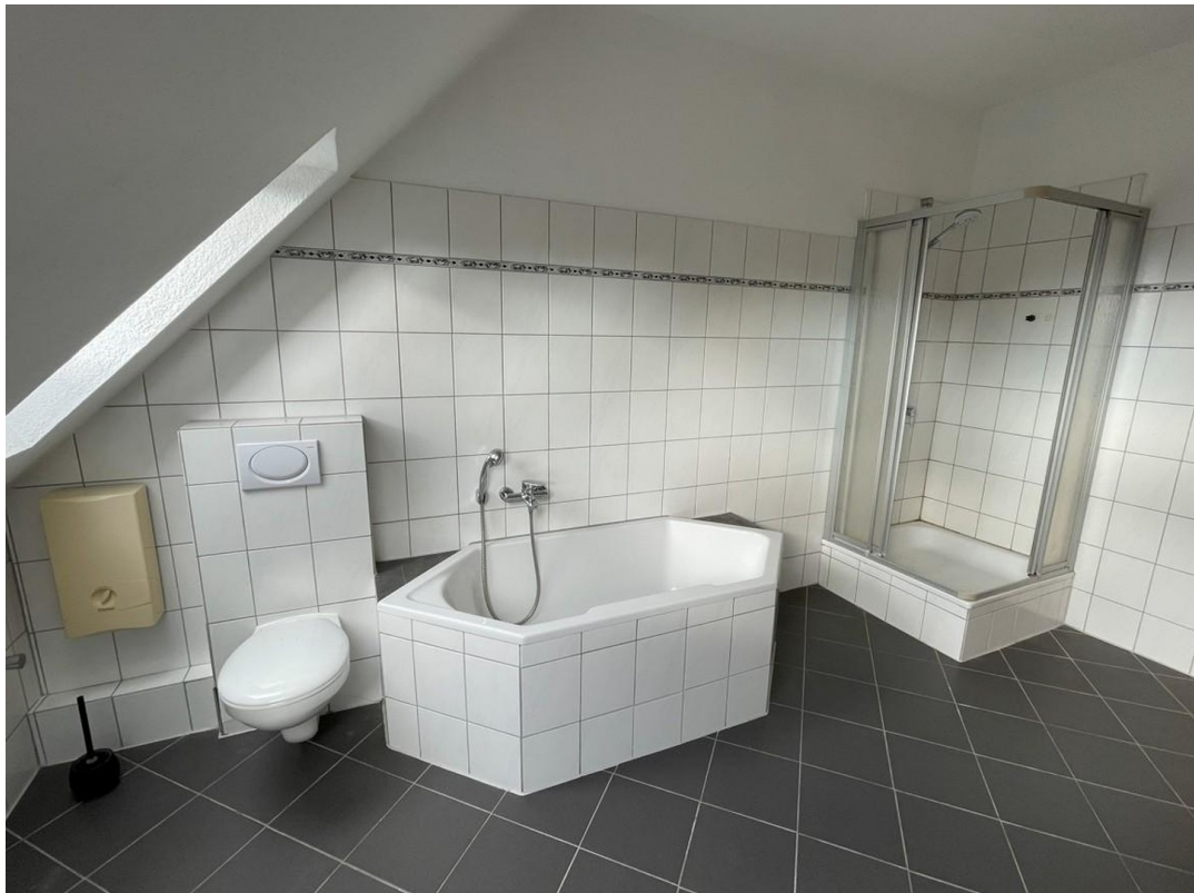
Bad 1 mit Dusche und Wanne