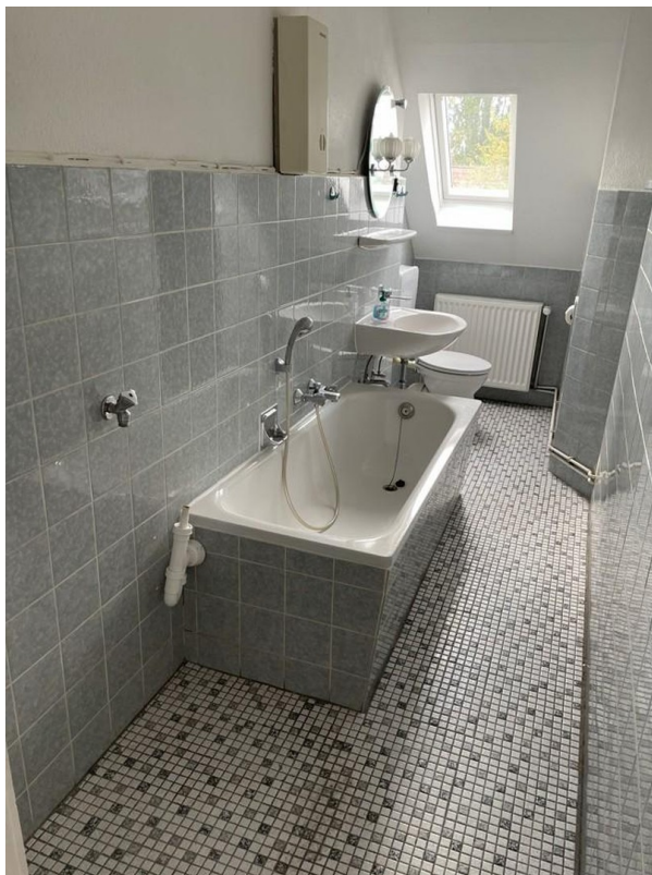
Bad 2 mit Wanne