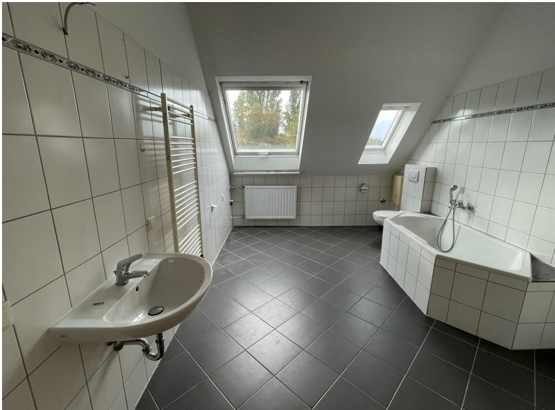
Bad 1 mit Dusche und Wanne