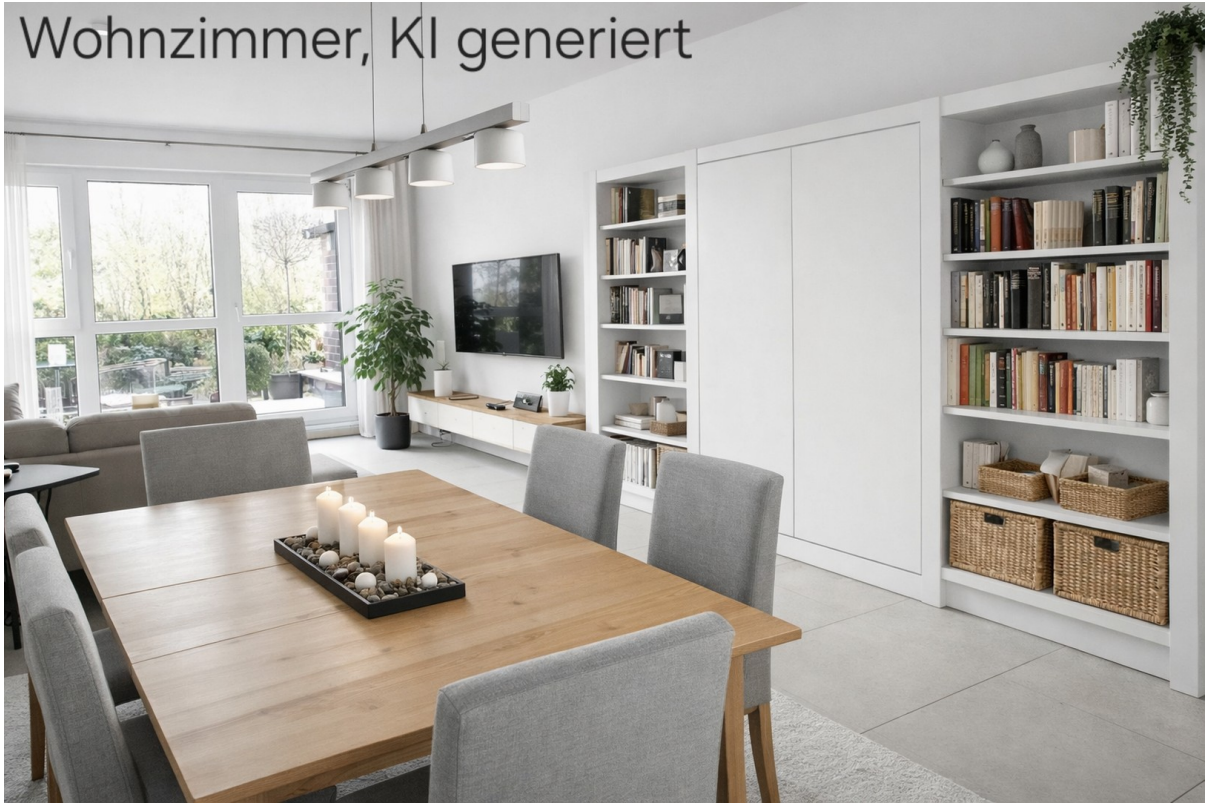
Wohnzimmer, KI generiert