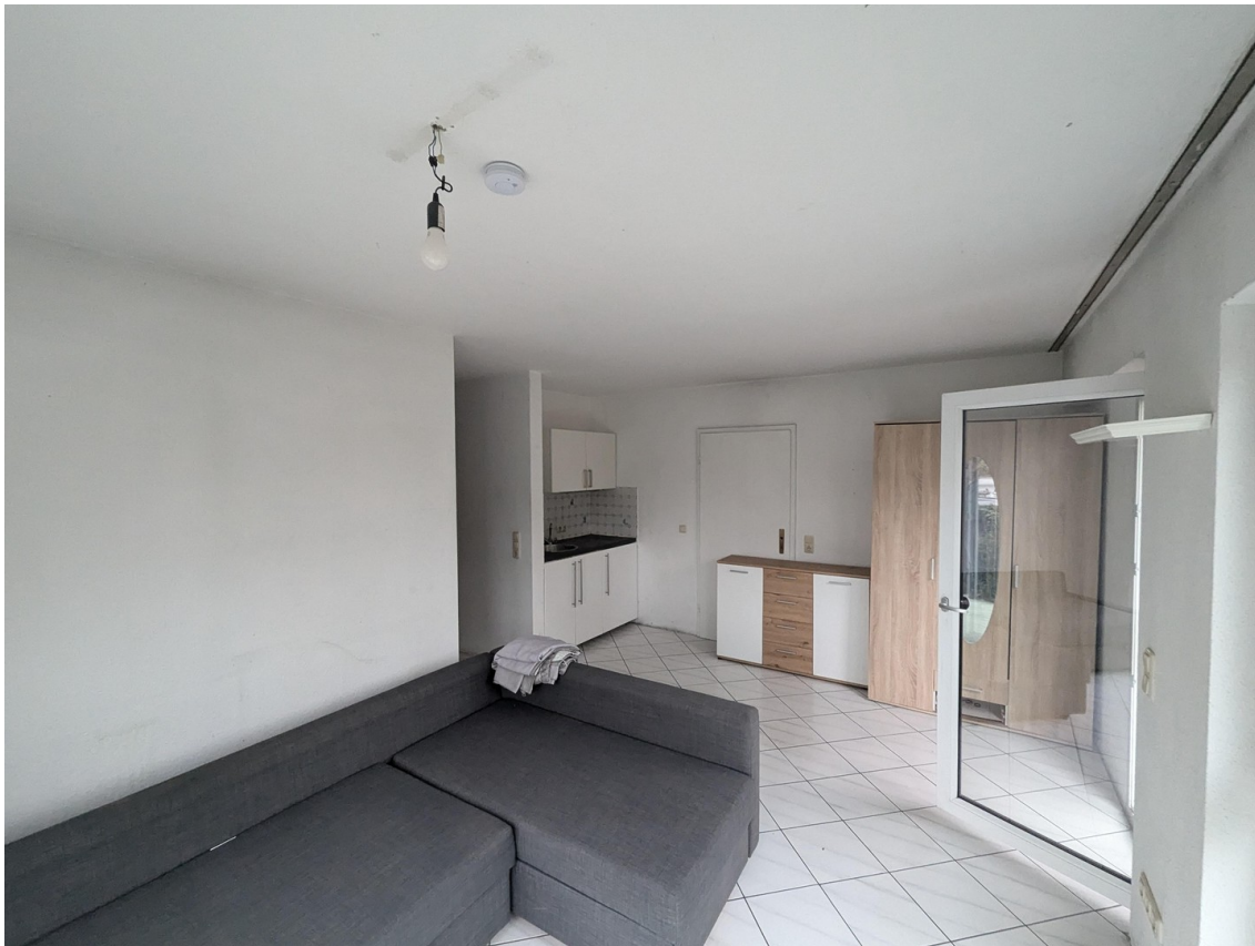
Zimmer von Fenstereite