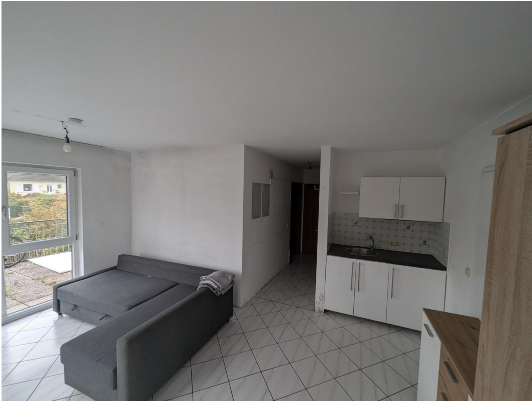
Zimmer von Terrassentür