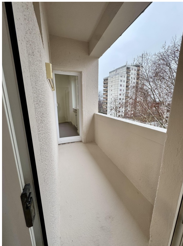
Zugang zur Loggia aus Zimmer 3