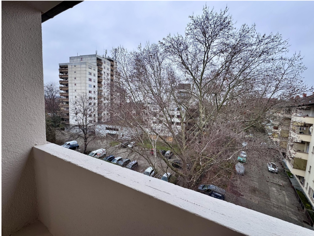
Aussicht von der Loggia