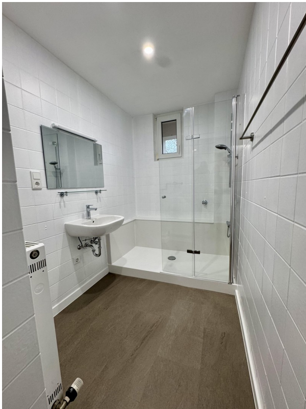
Bad mit großer Dusche