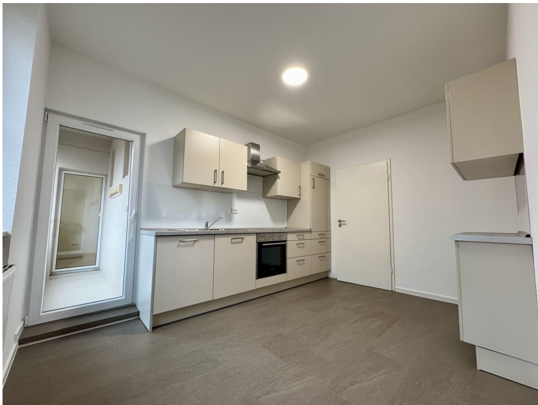
Küche mit Zugang zur Loggia