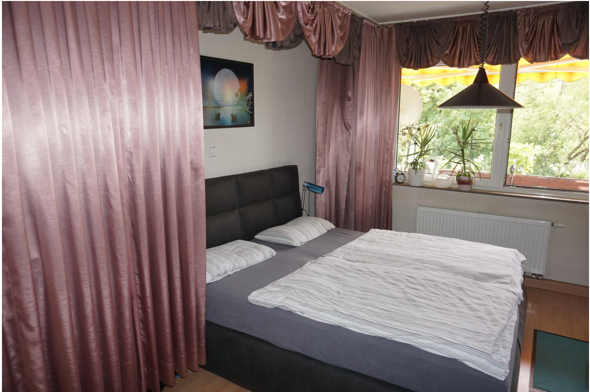
Schlafzimmer Bild 1