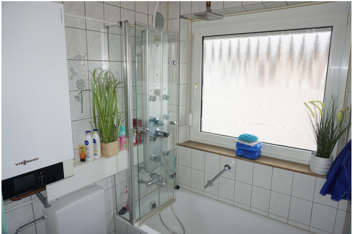
Badezimmer Bild 2