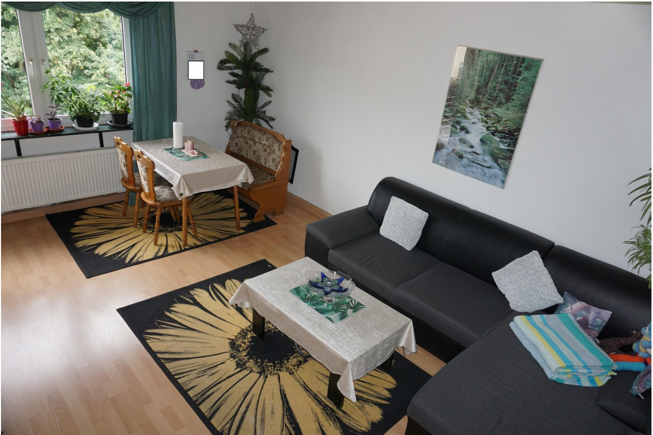
Wohnzimmer Bild 2