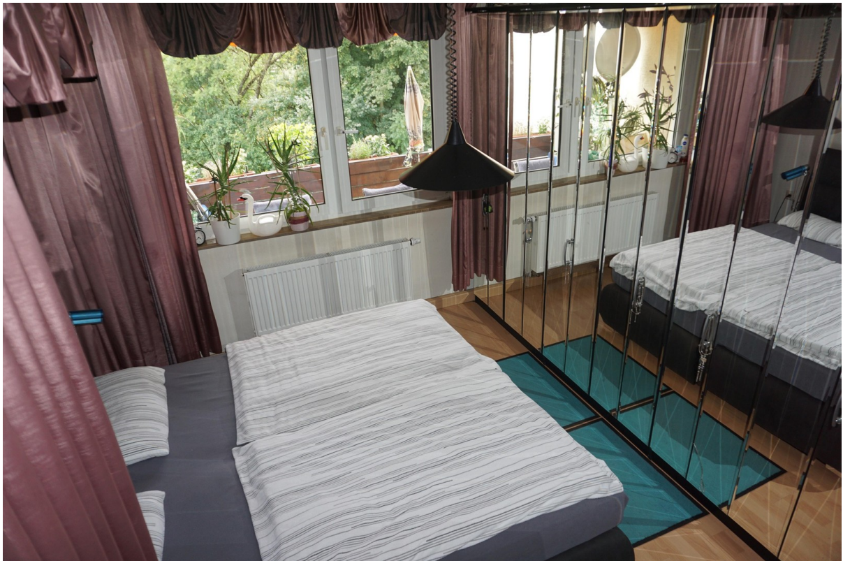
Schlafzimmer Bild 2