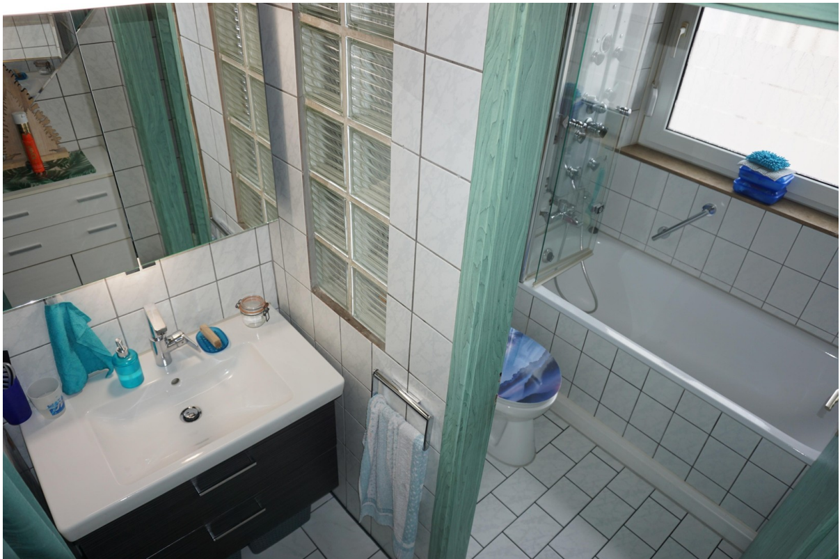
Badezimmer Bild 1