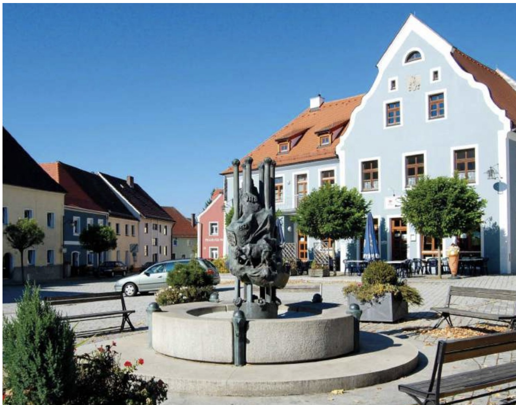
Im Herzen von Pfreimd