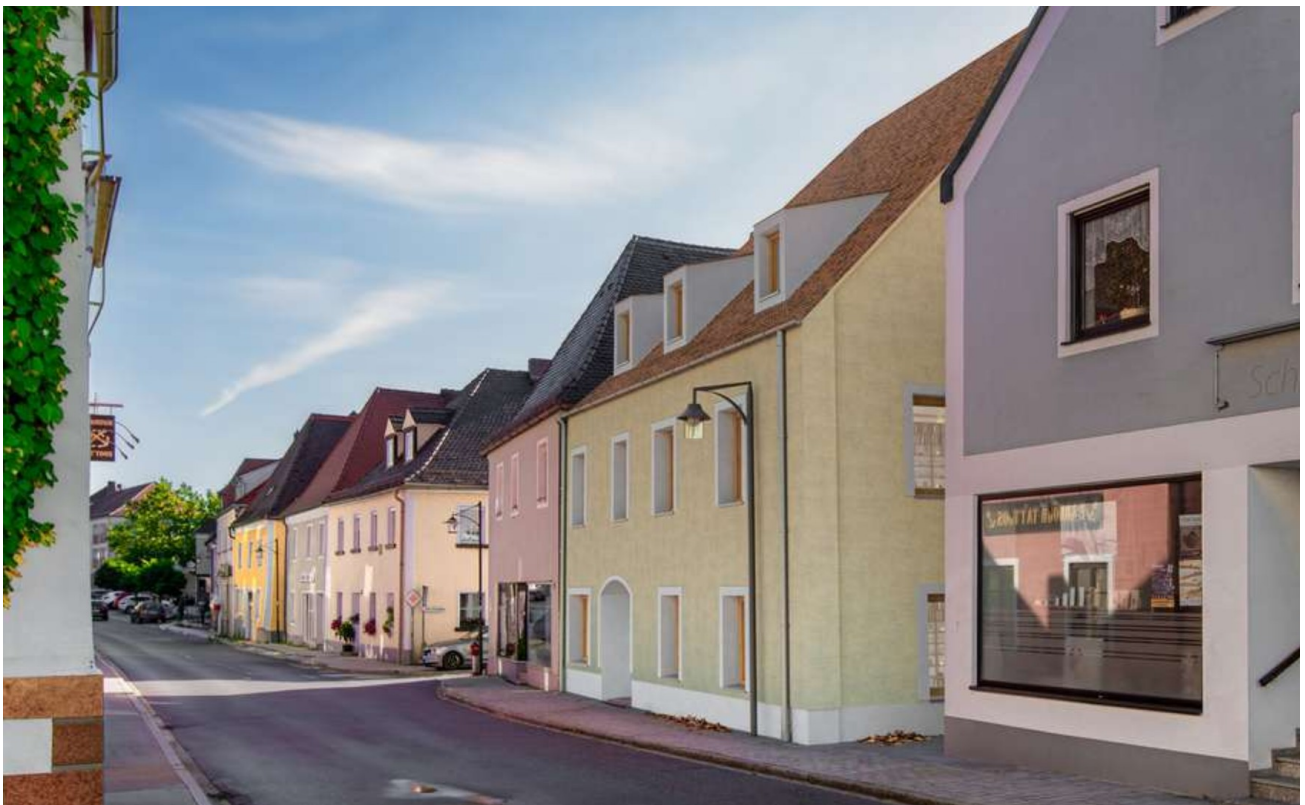
Im Herzen von Pfreimd