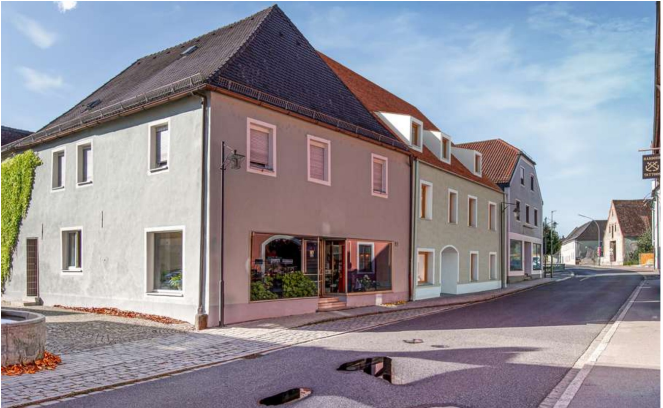
Im Herzen von Pfreimd