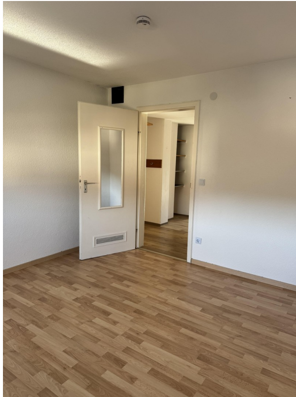
Blick SchlaZi Richtung Küche