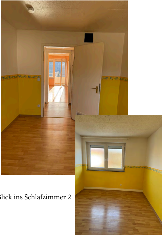
Blick ins Schlafzimmer 2