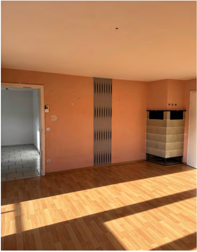
Blick ins Wohnzimmer und Kamin