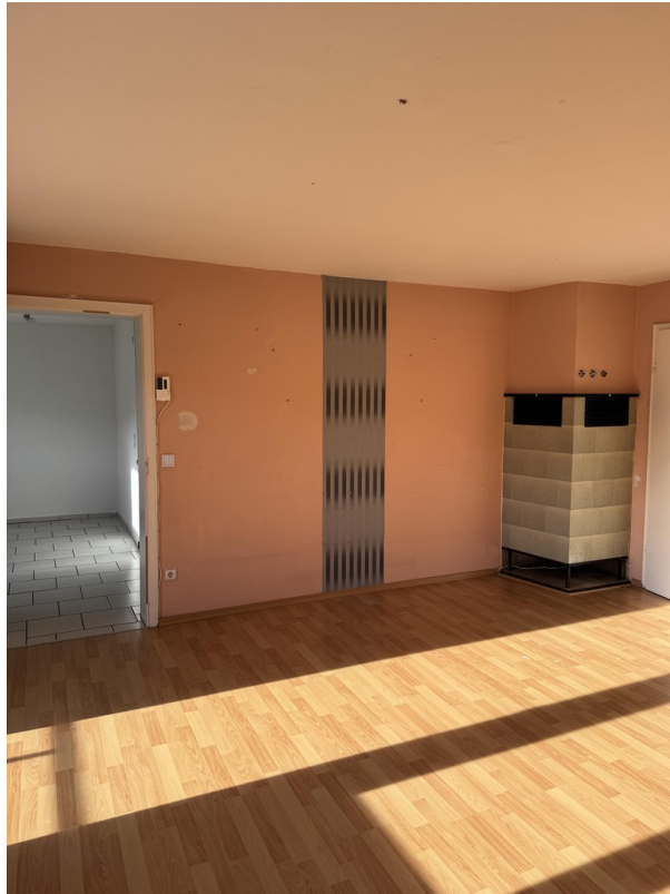
Wohnzimmer - Kamin - Essecke