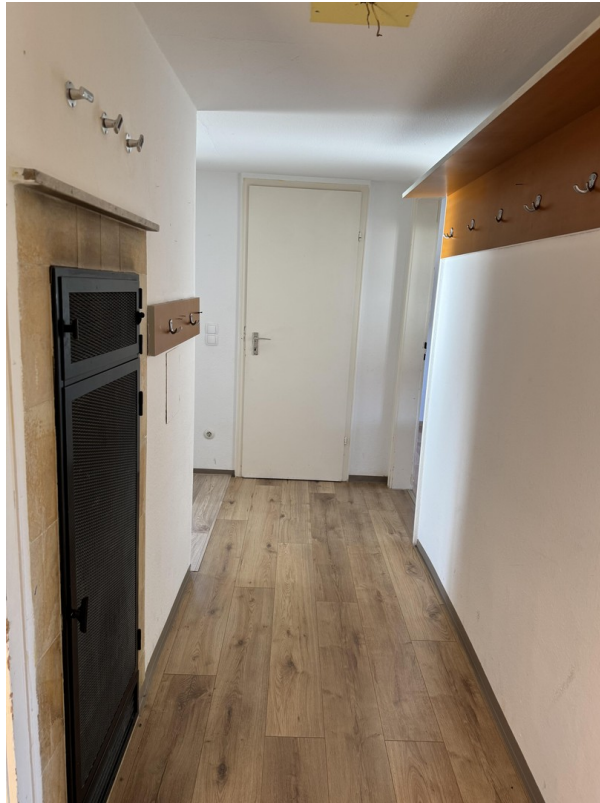
Flur mit Ofen Tür Abstellraum