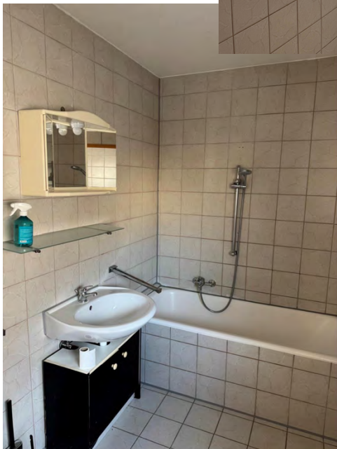
Bad - mit Platz für Waschmaschine