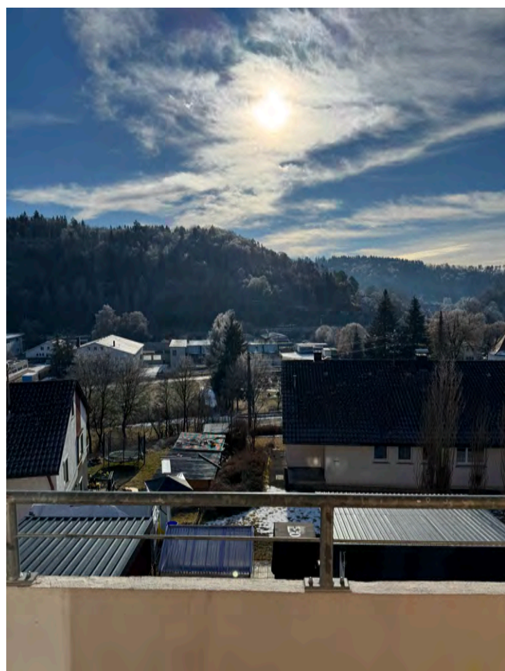
Blick aufs Tal