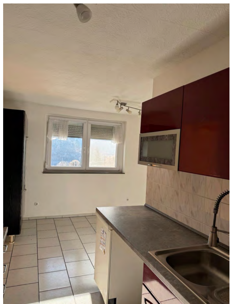
Küche Richtung Esszimmer