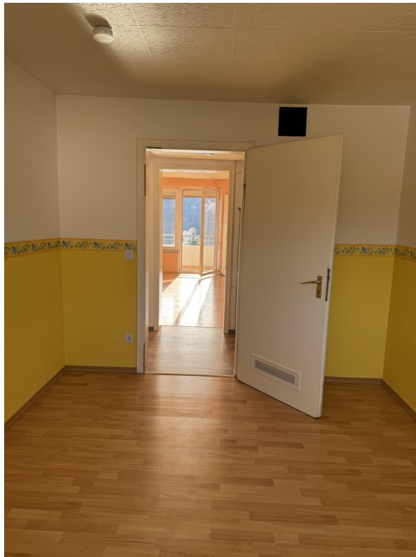
Blick Kinderzi Richtung WoZi