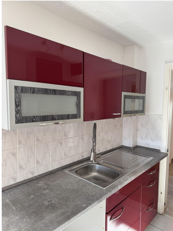
Küche - ohne Geräte