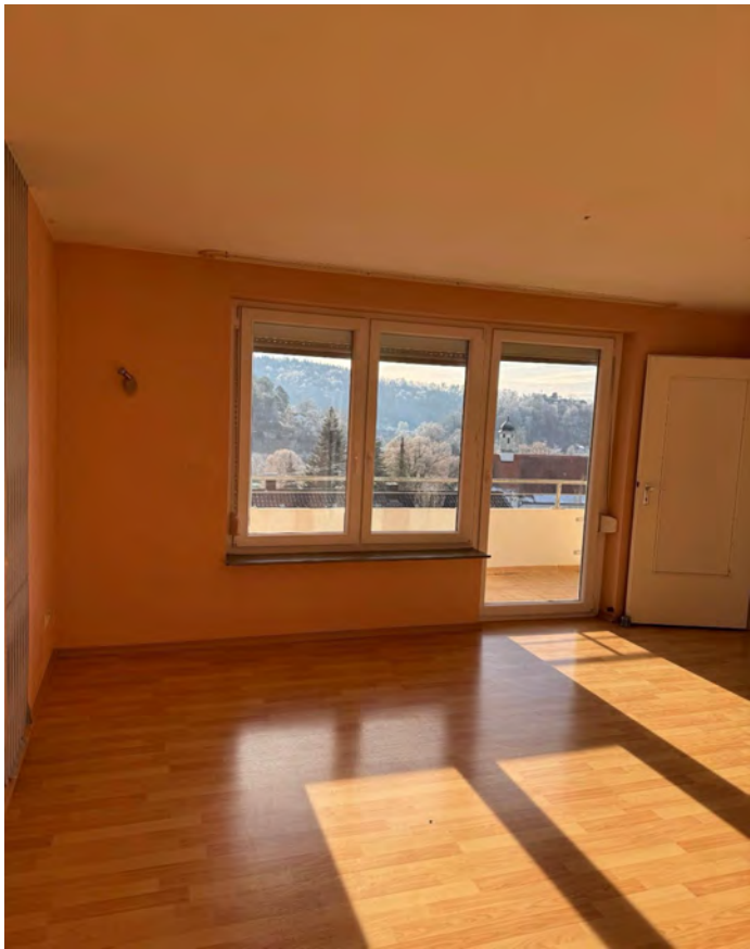
Wohnzimmer mit Blick