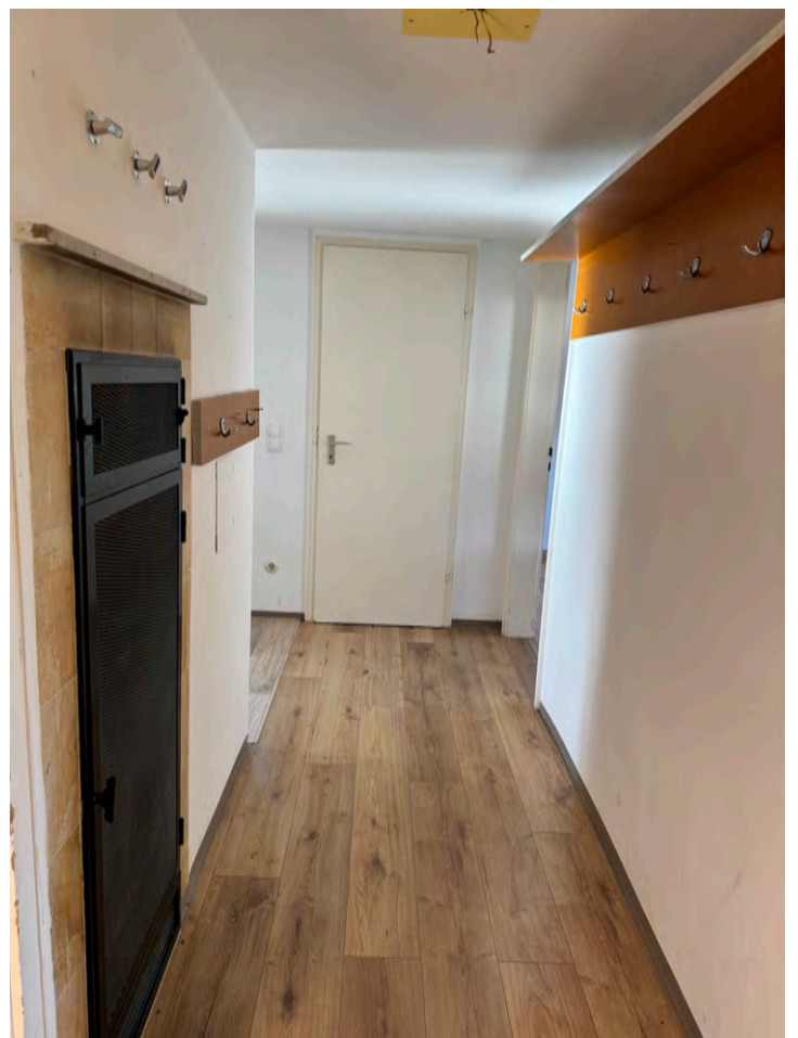
Flur mit Ofen/Heizung