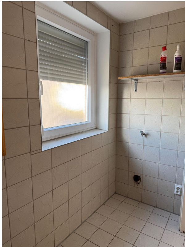
Fenster und Platz Waschm