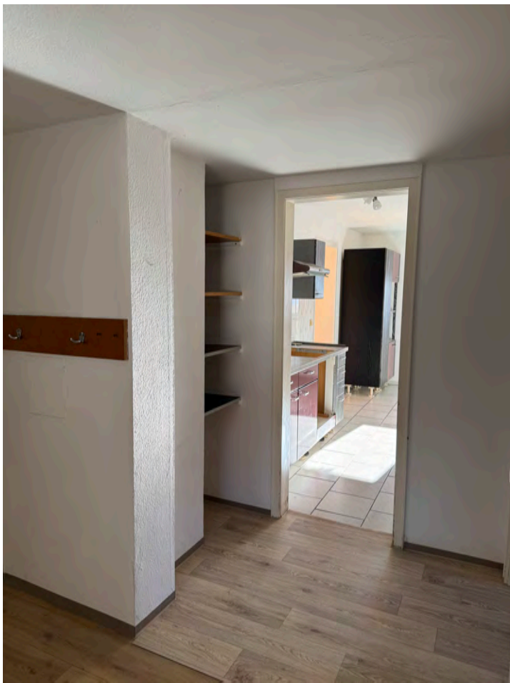
Flur mit Einbauregal