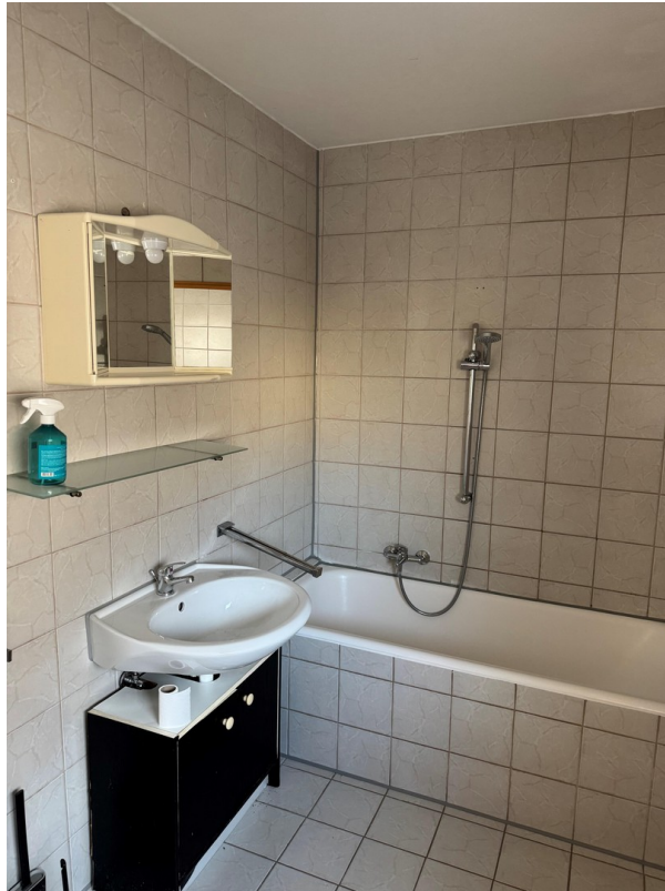
Bad mit Wanne