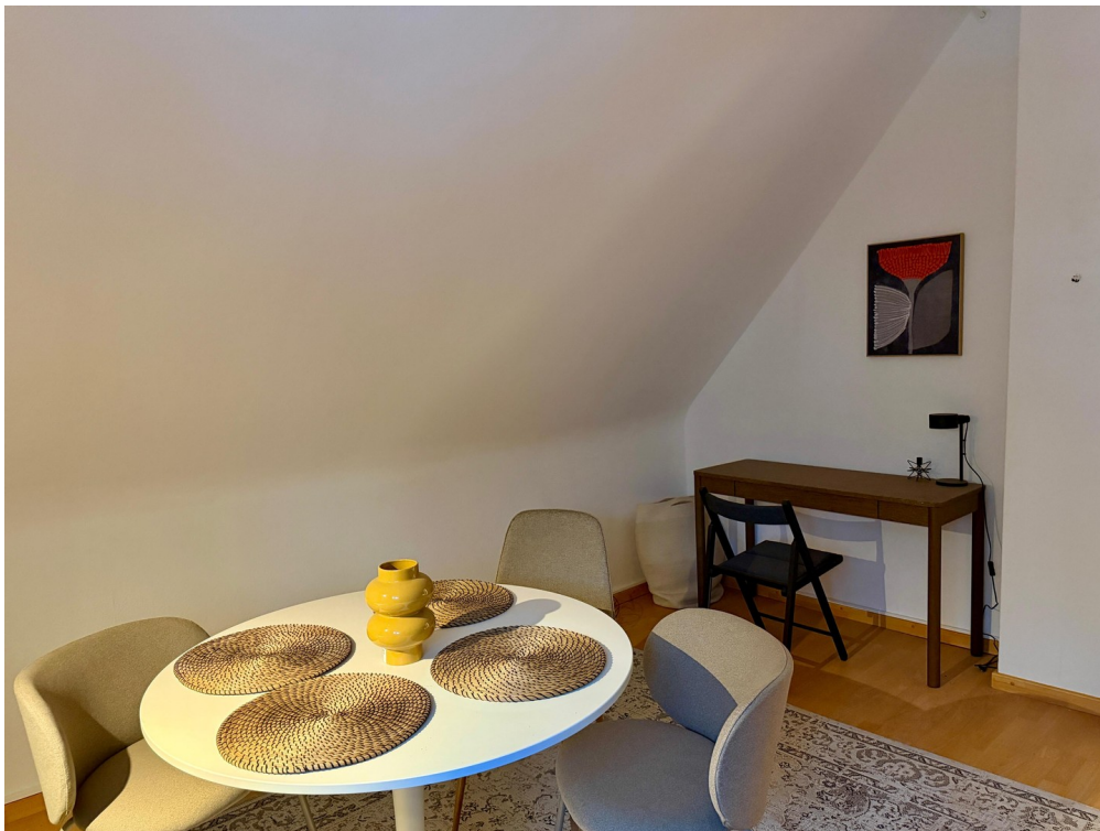
Essen & Arbeiten