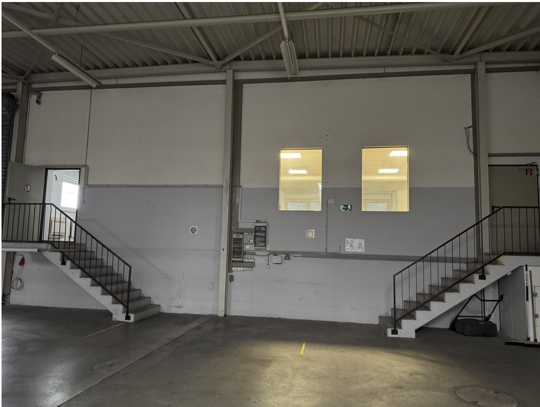
Zugang Halle zu Büro