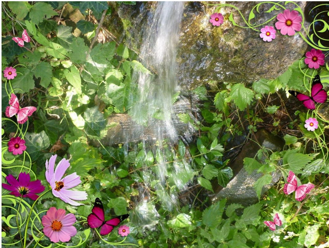
Quelle am Platz