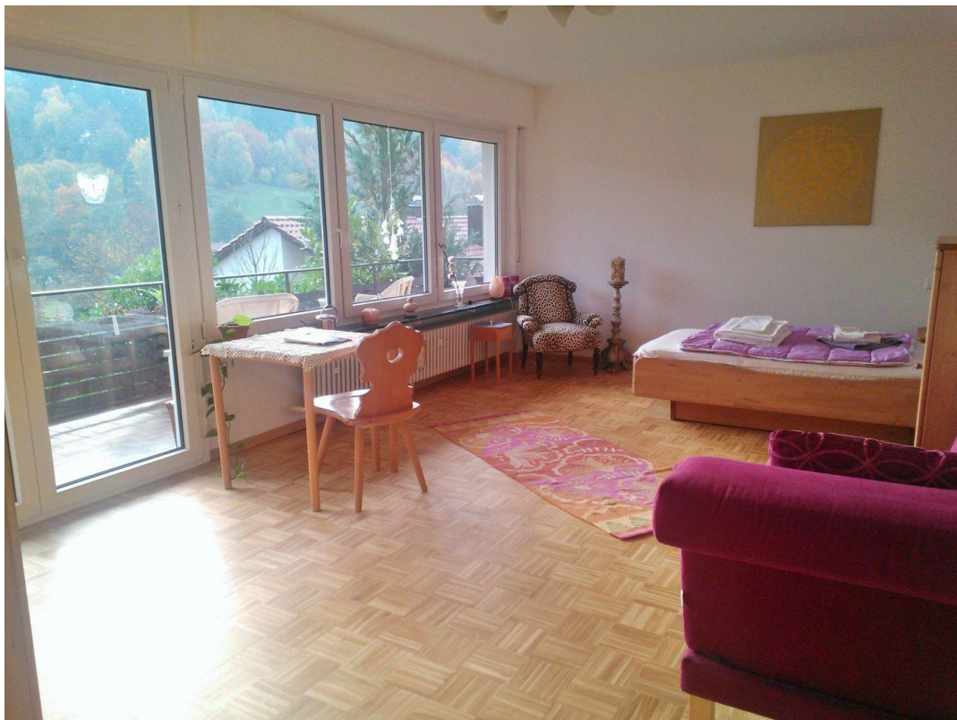
Schlafzimmer mit Balkon 23qm