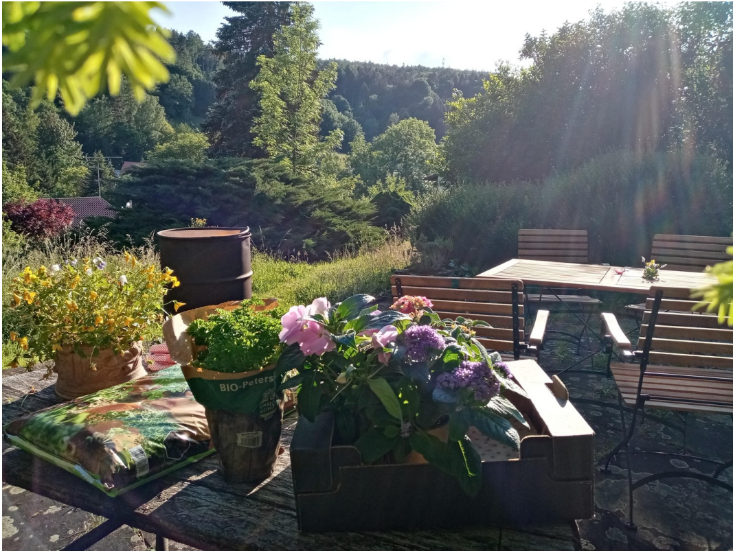
im Garten sein & tun