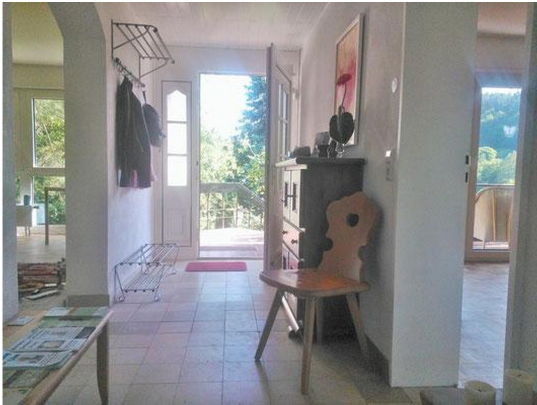
Hauseingang / Flur