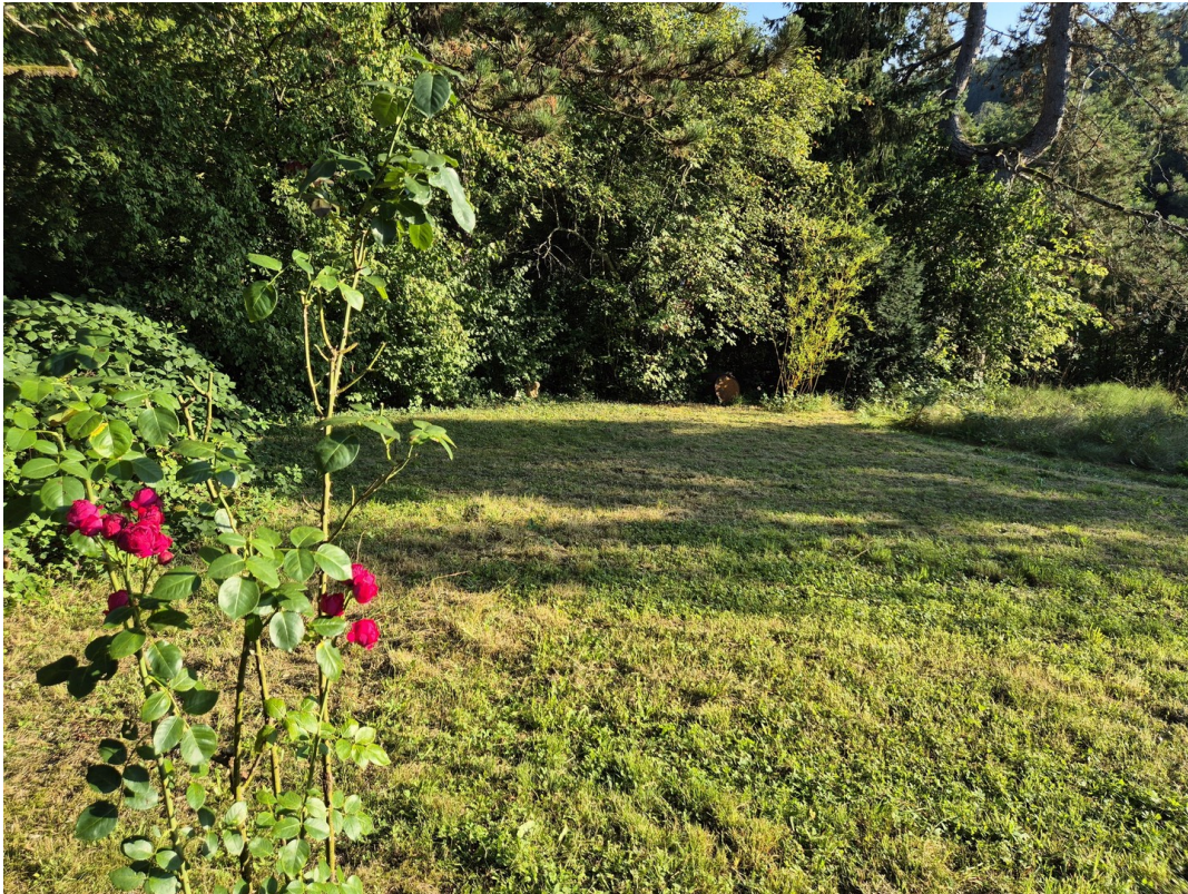
Garten für eigene Ideen