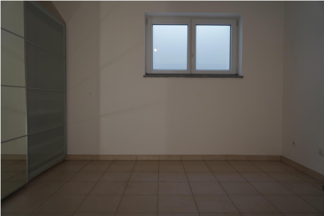
Schlaf- oder Hobbyraum