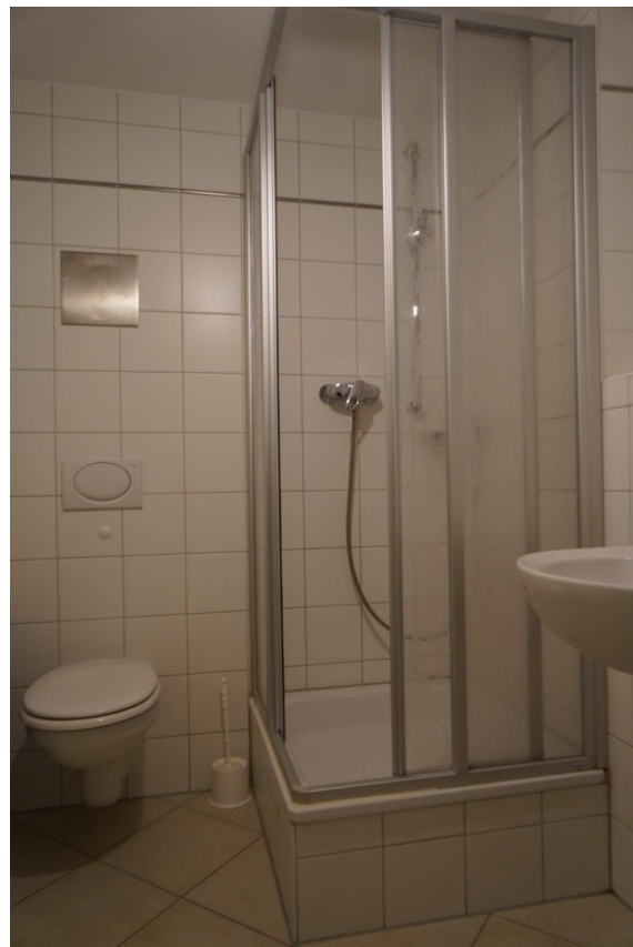
Dusche/WC im UG