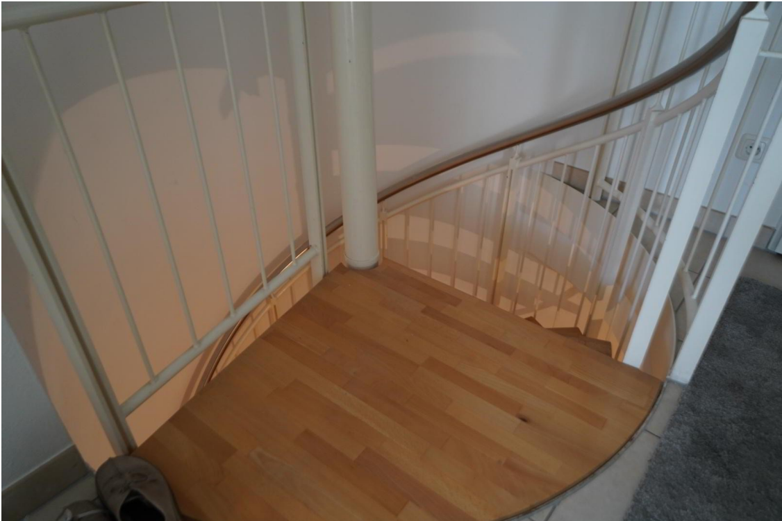
Treppe zum UG