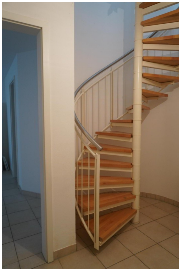
Treppe im UG