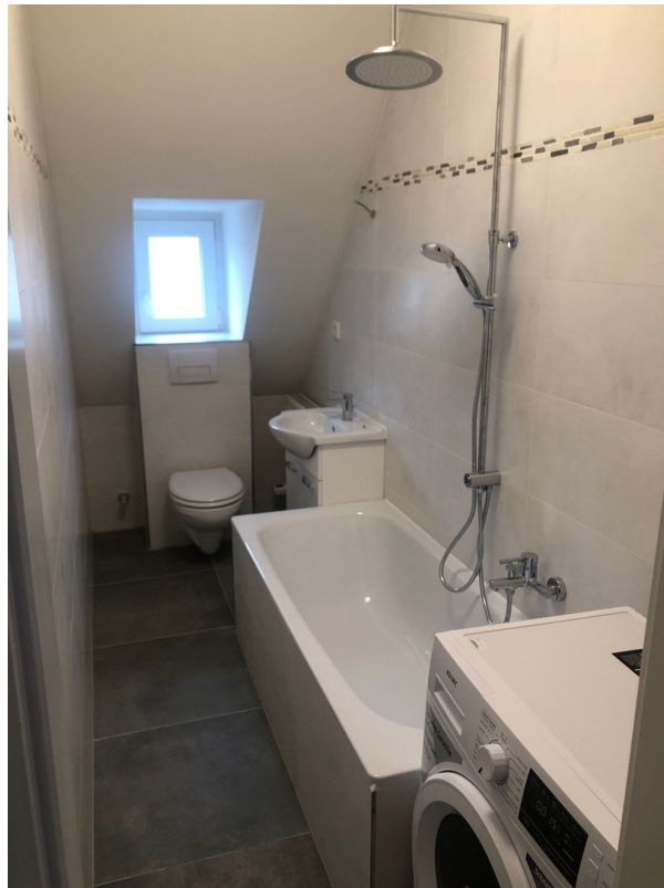
Neues Bad mit Fenster