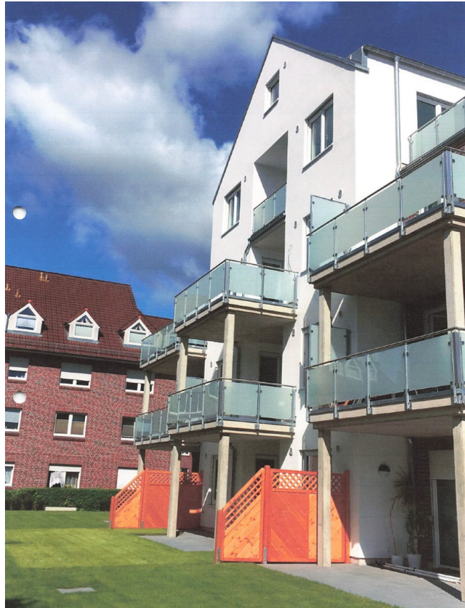
Rückseite mit Balkon