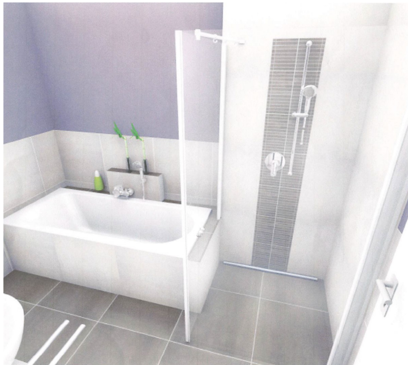
Dusche und Badewanne