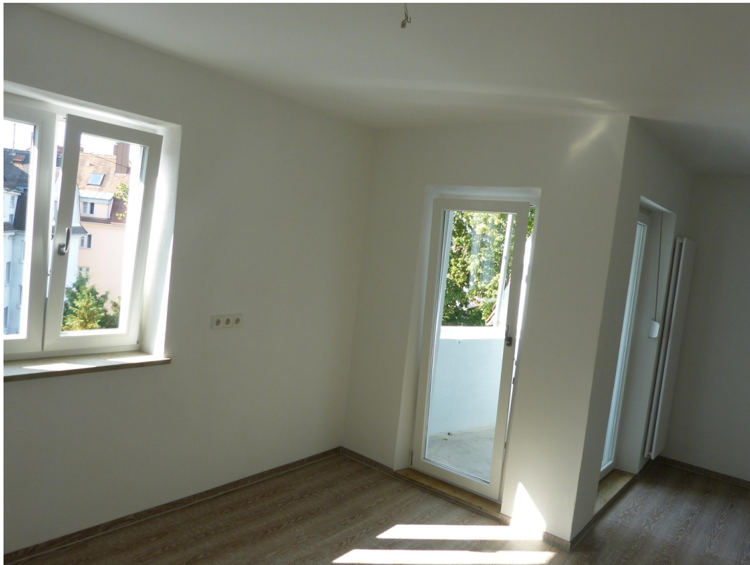
Küche, Blick auf Loggia