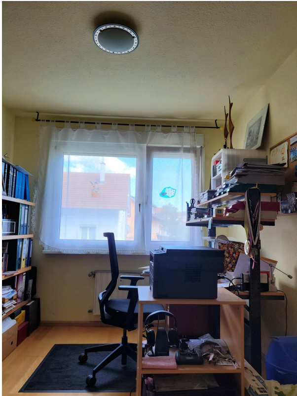
Arbeits- od. Schlafz./Ostseite