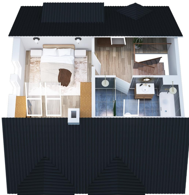
Grundriss DG 2