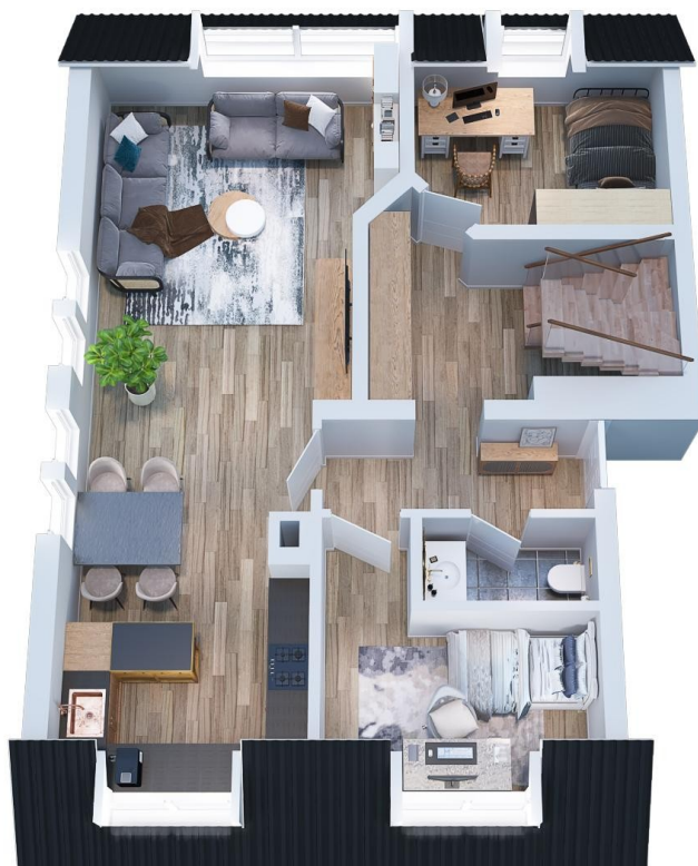
Grundriss DG 1