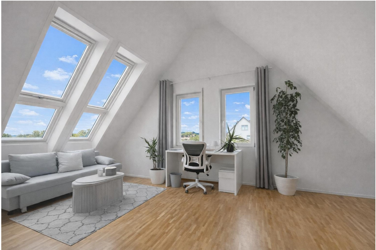
DG 2 Schlafen