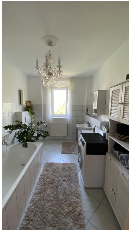
Riesiges Tageslichtbad 3. OG