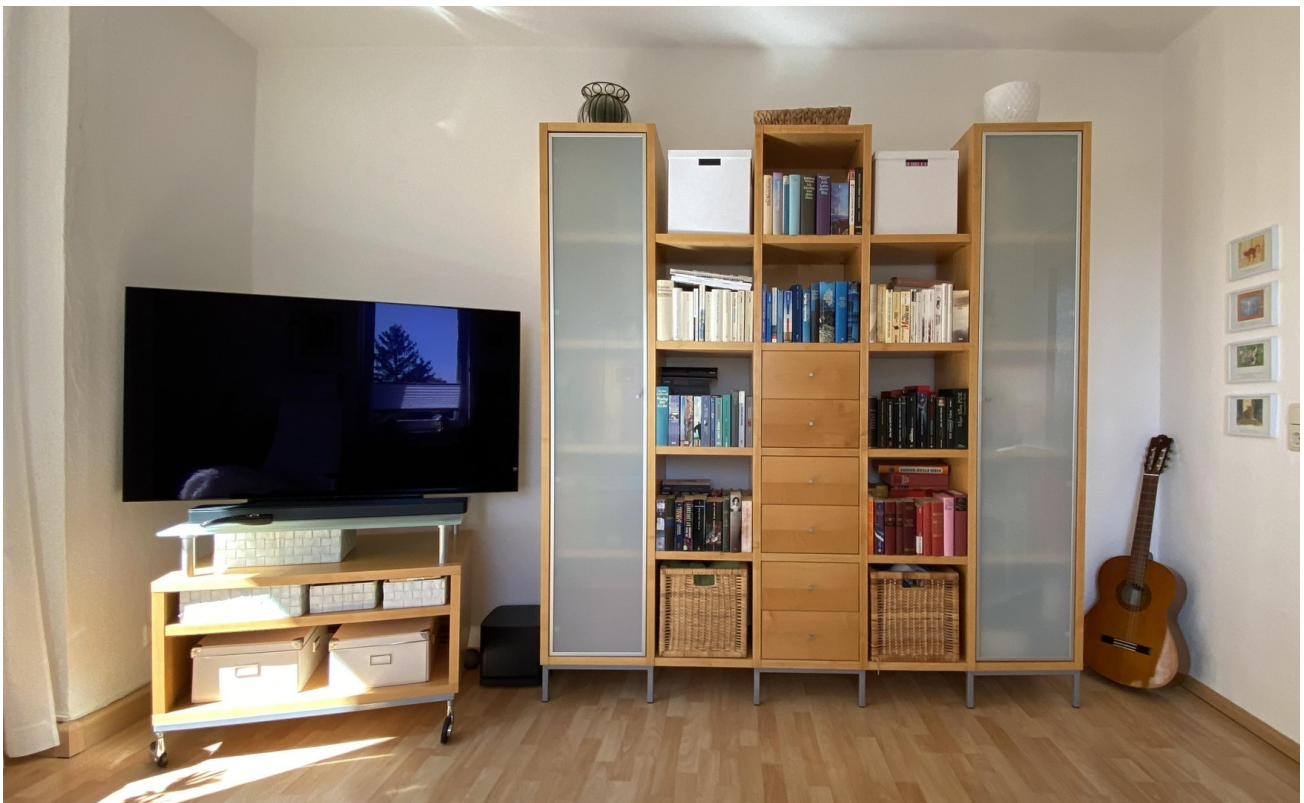
Wohnzimmer 3. OG