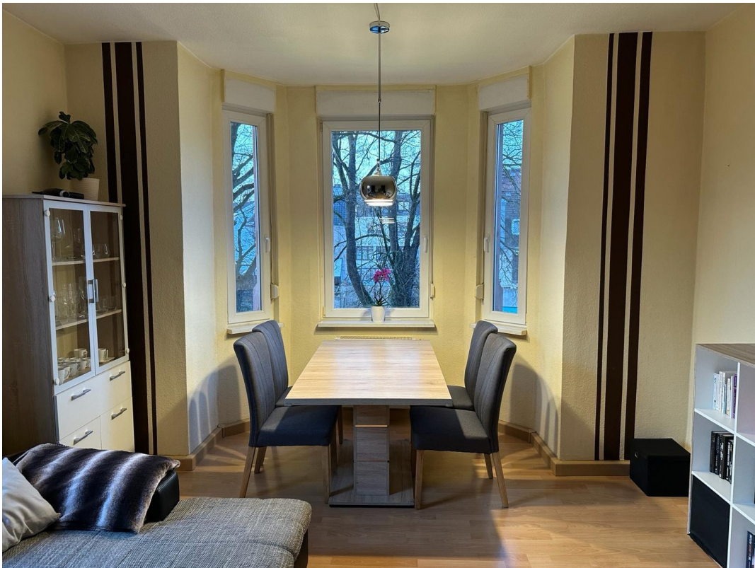
Wohnen 1. OG