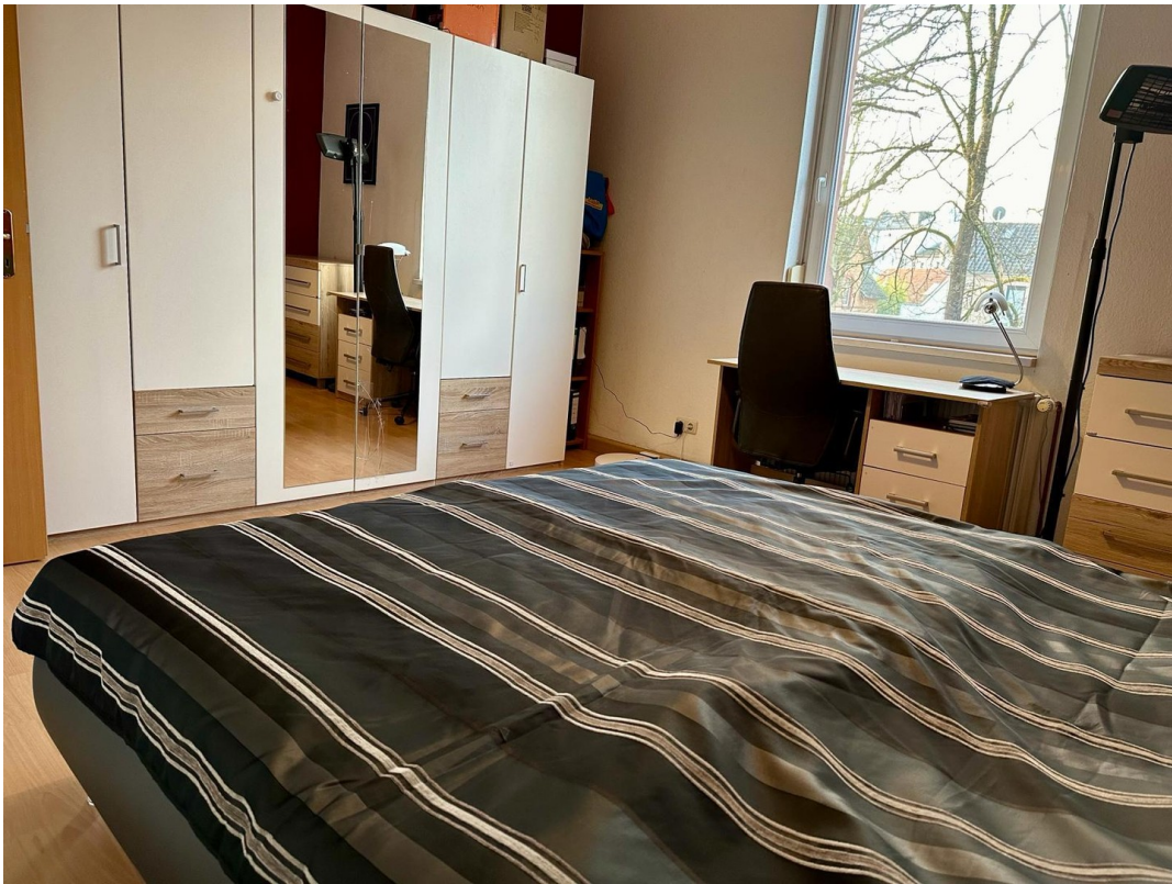
Schlafen 1. OG