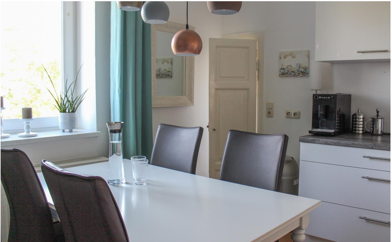
Küche mit Abstellkammer