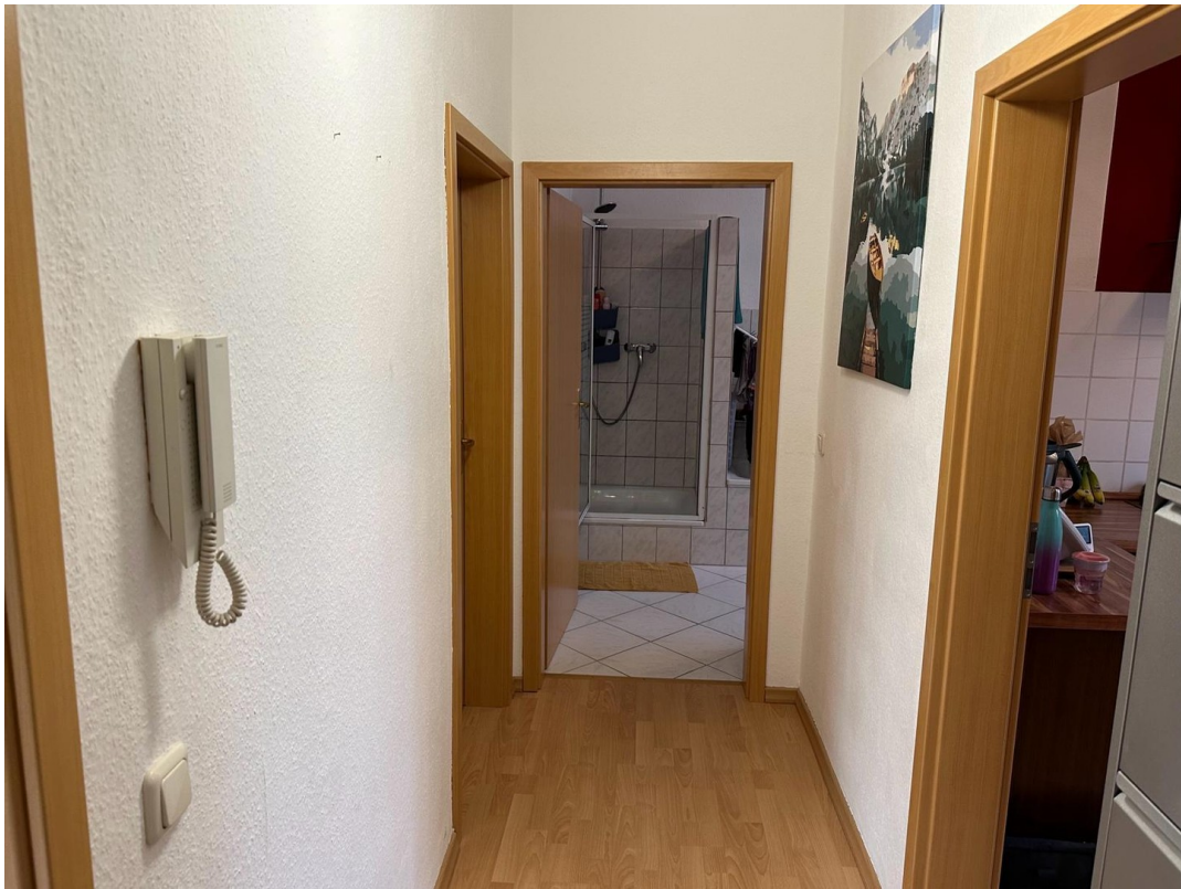
Flur 1. OG