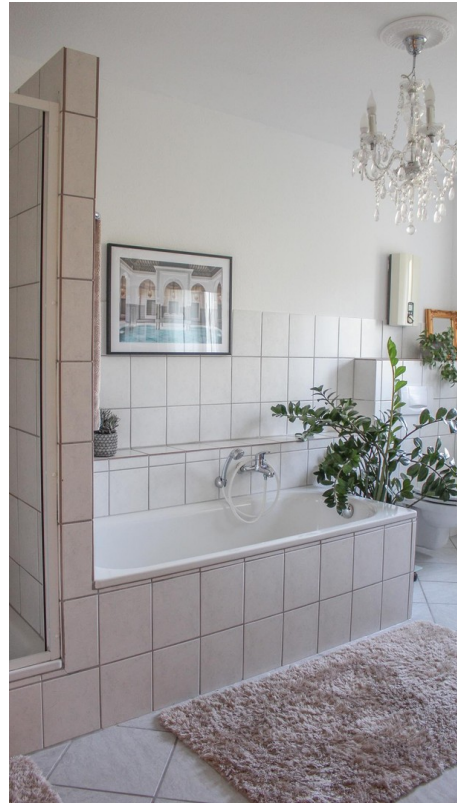
Dusche und Badewanne 3. OG