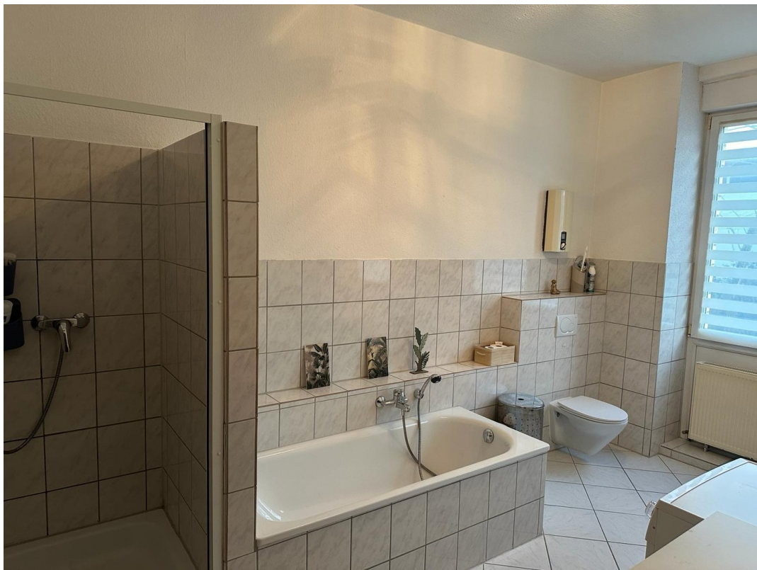
Dusche und Badewanne 1. OG