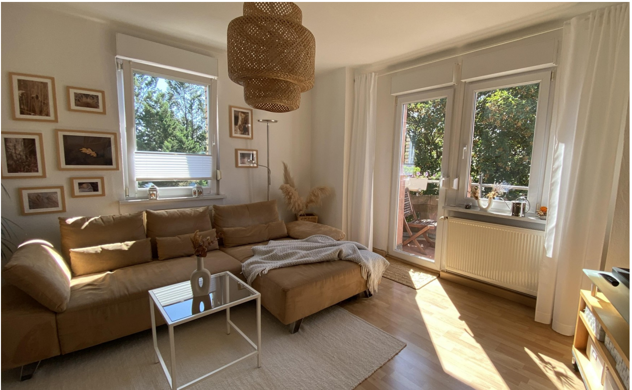
Wohnen 3. OG