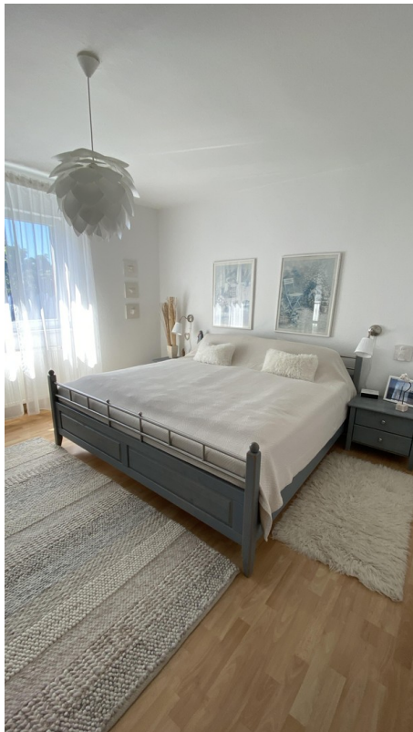
Schlafen 3. OG