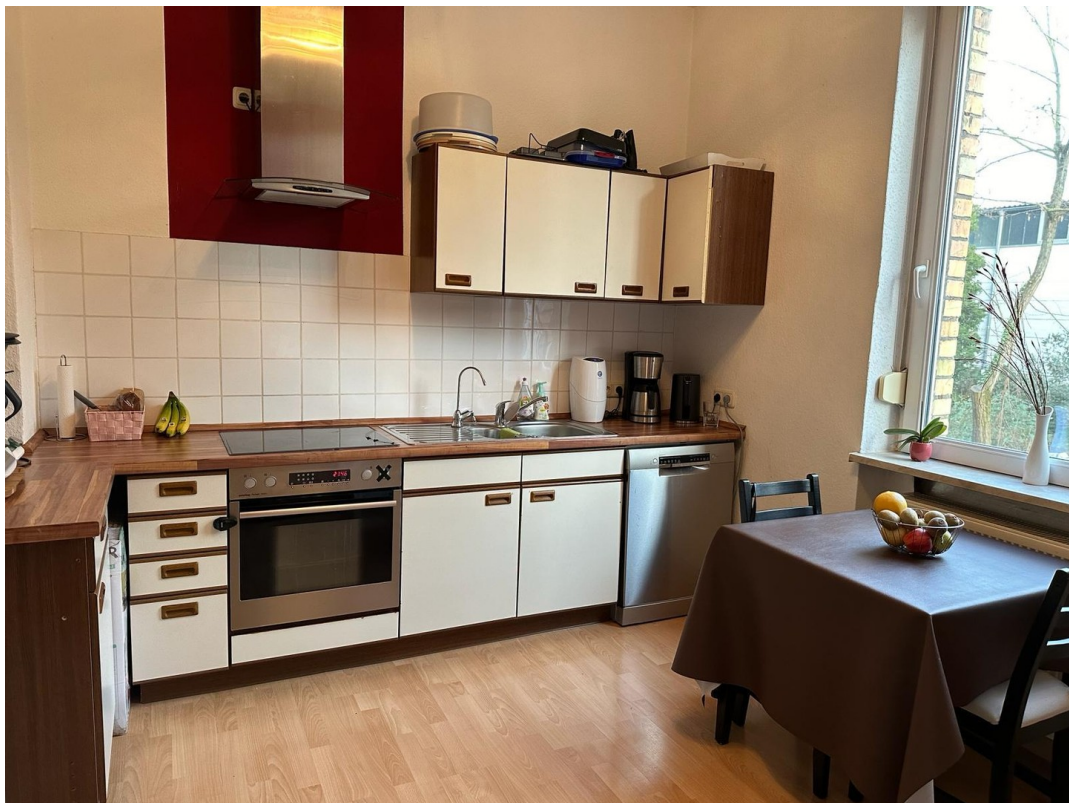
Küche 1. OG