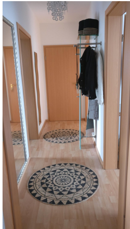
Flur 3. OG