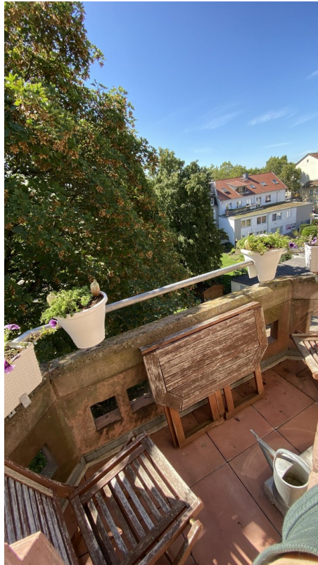
Balkon 3. OG