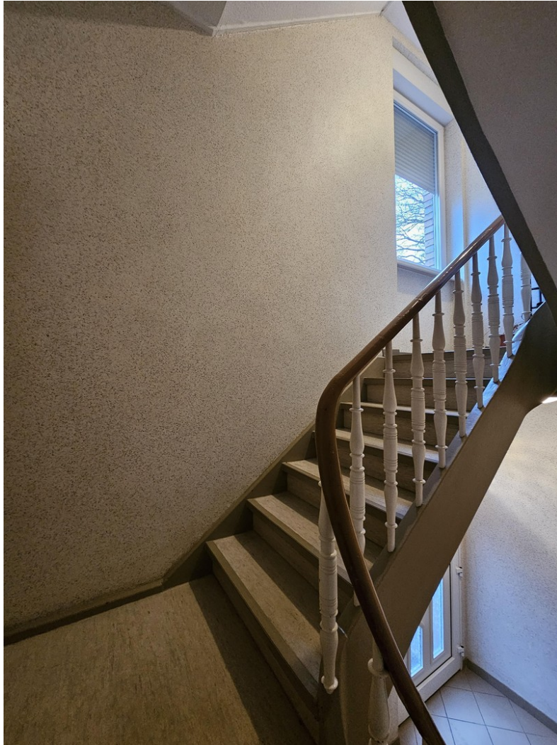
Heller, gepflegter Treppenraum