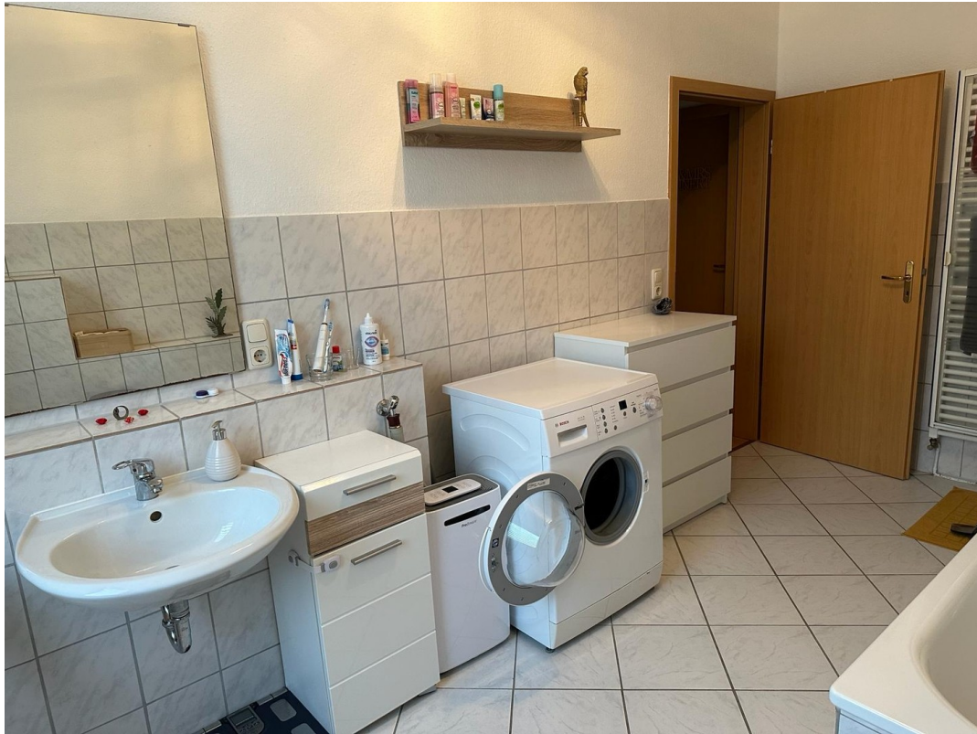
Riesiges Tageslichtbad 1. OG