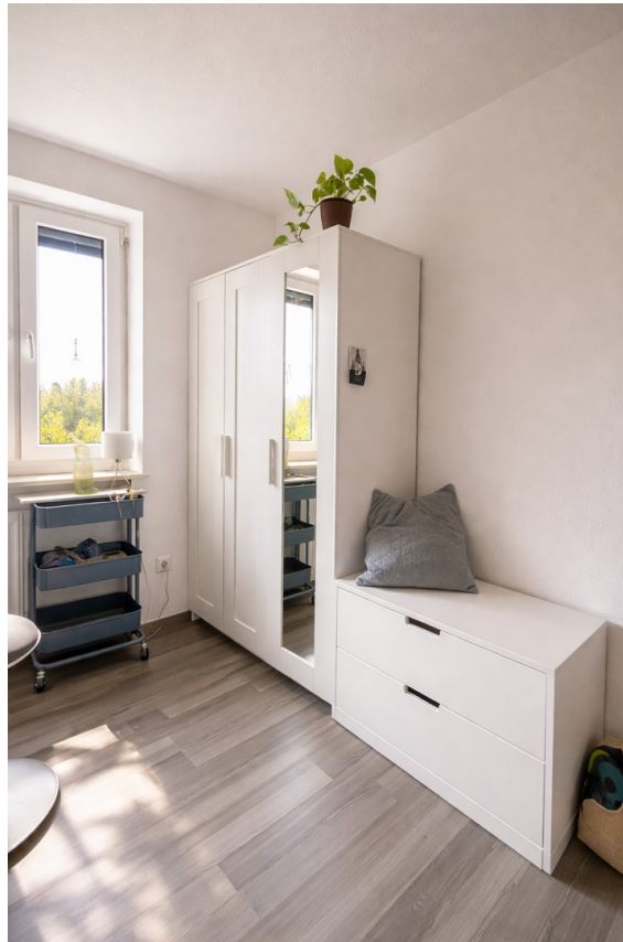
Zimmer: Alles passt rein