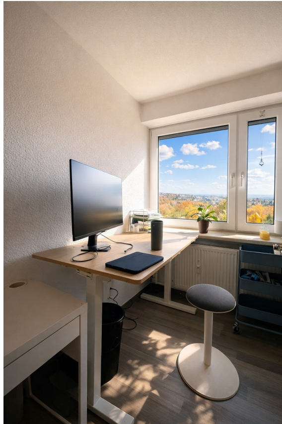
Zimmer: Lernen mit Weitblick