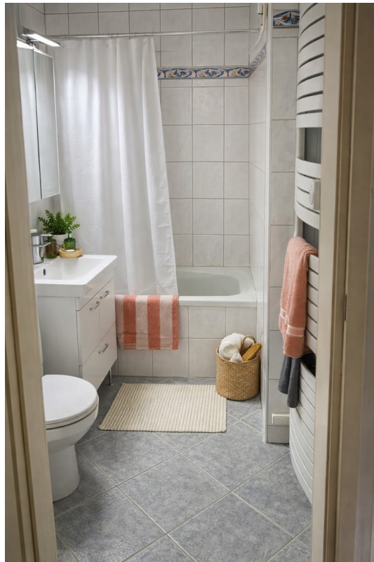
Bad mit Handtuchwärmer