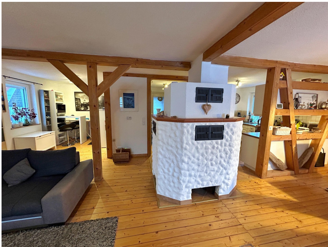
Offener Wohnbereich EG