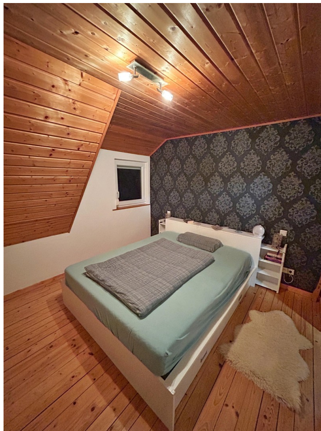
2. Schlafzimmer OG