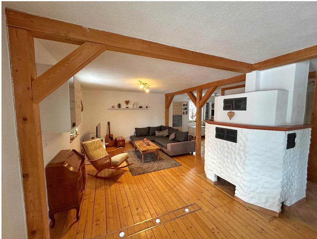
Offener Wohnbereich EG