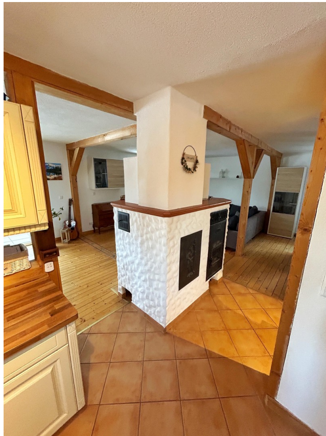
Blick aus der Küche EG