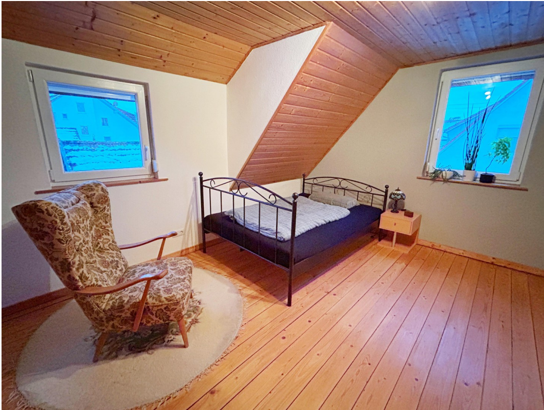
1. Schlafzimmer OG.