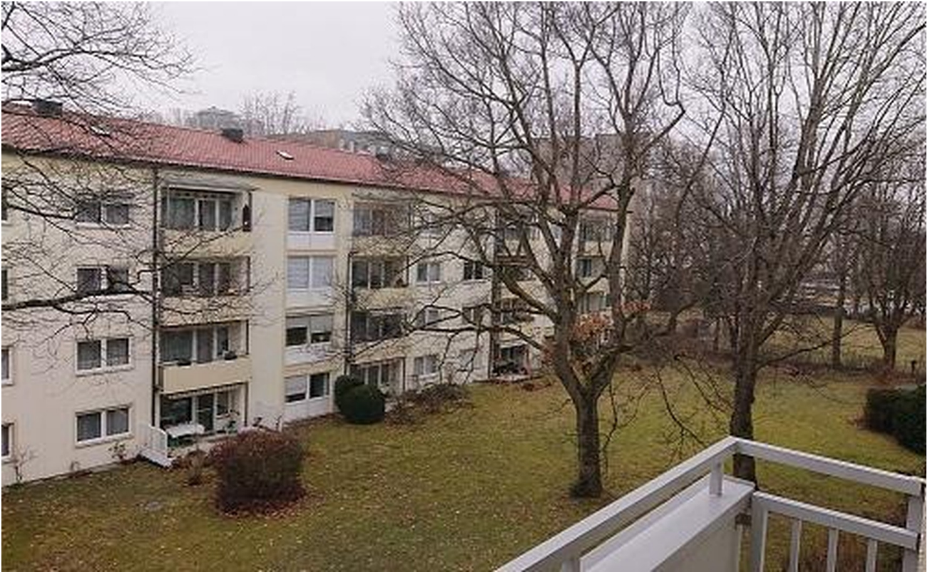
Ausblick Balkon Wohnzimmer