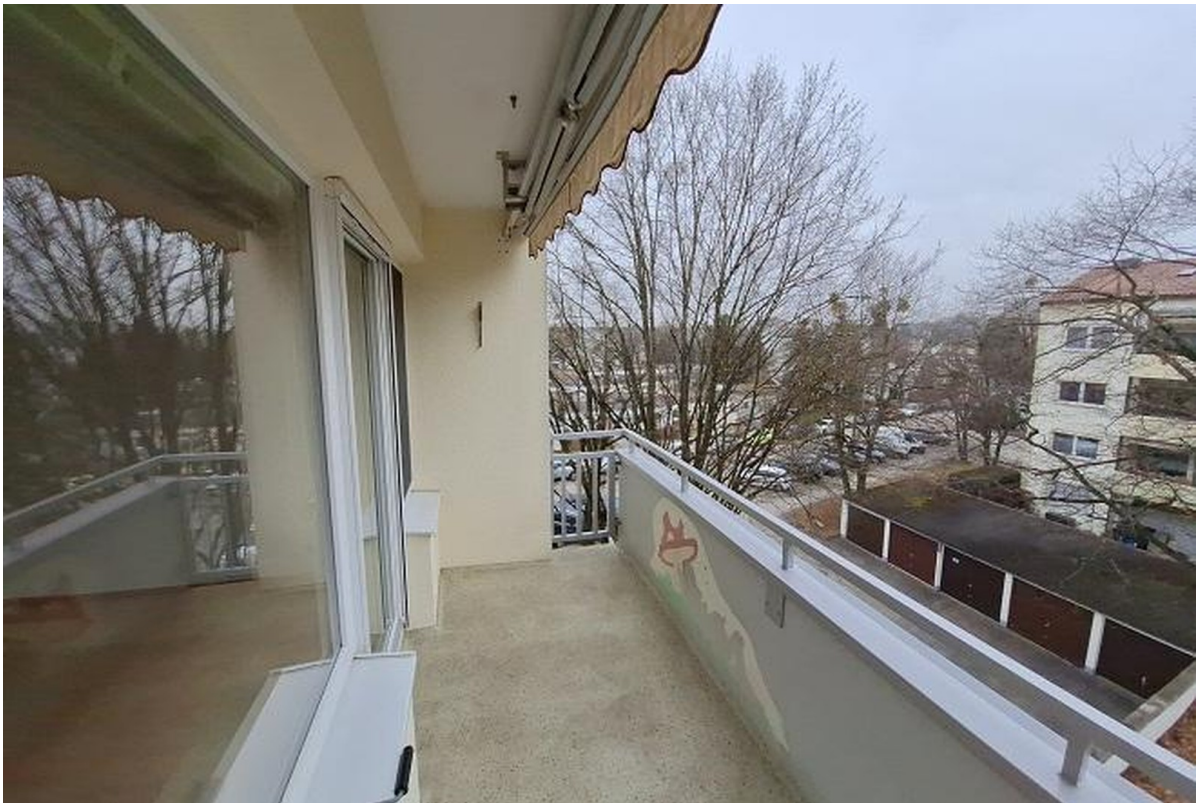
Ausblick Balkon Wohnzimmer