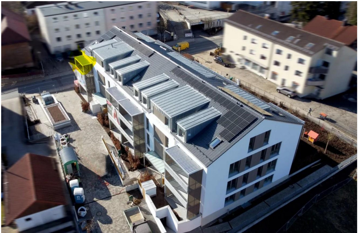
Vogelperspektive mit Markierung