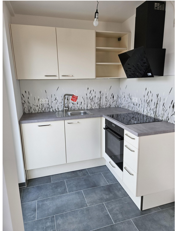
Offene Wohnküche mit AEG-Gerät