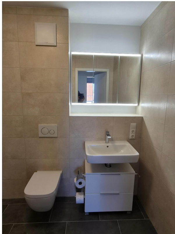
Bad mit Spiegelschrank