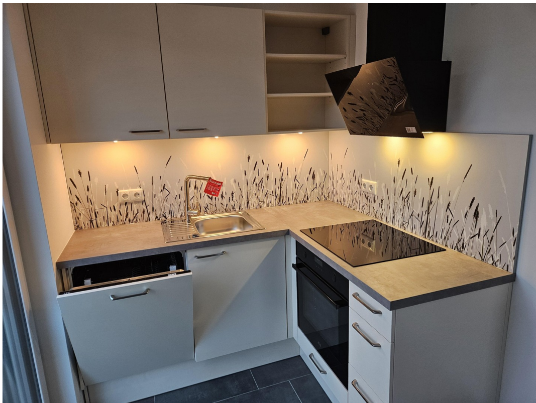
Küche mit Beleuchtung