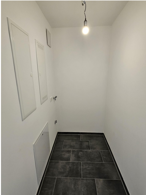
HWR mit Waschmaschinenanschluss