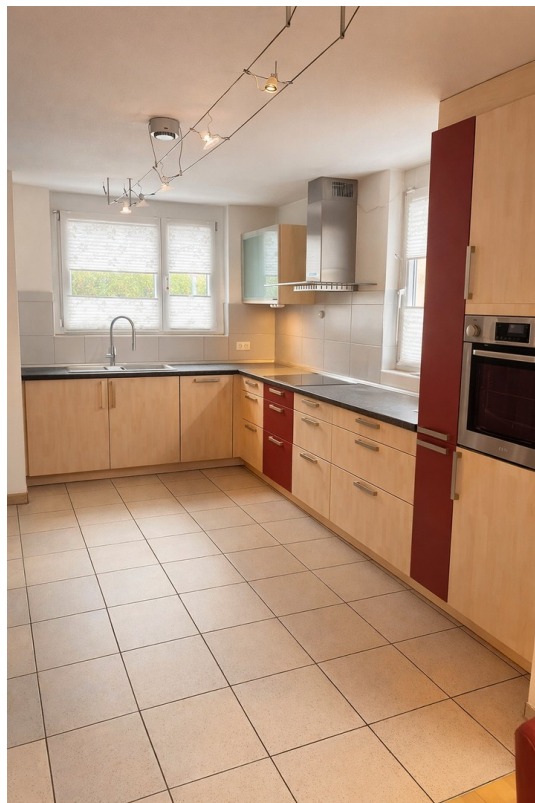
EG | Küche