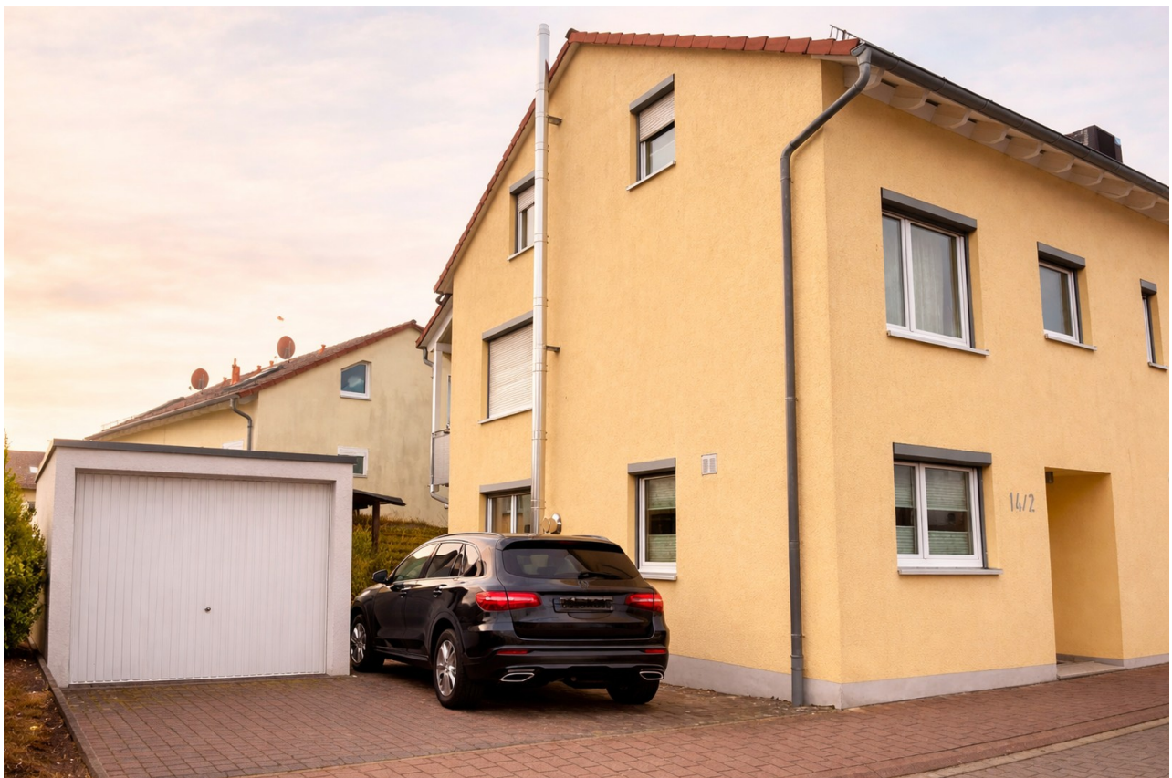
Frontansicht | Garage