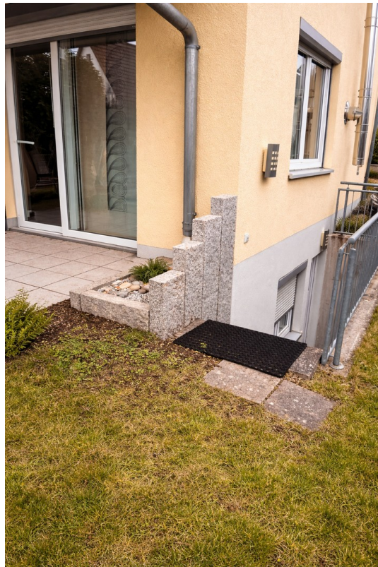
Seite | Abgang ELW