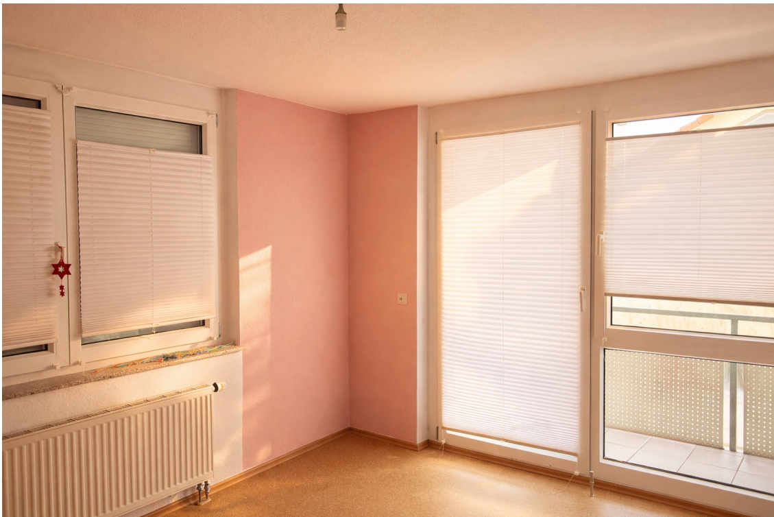
1. OG | Zimmer 1