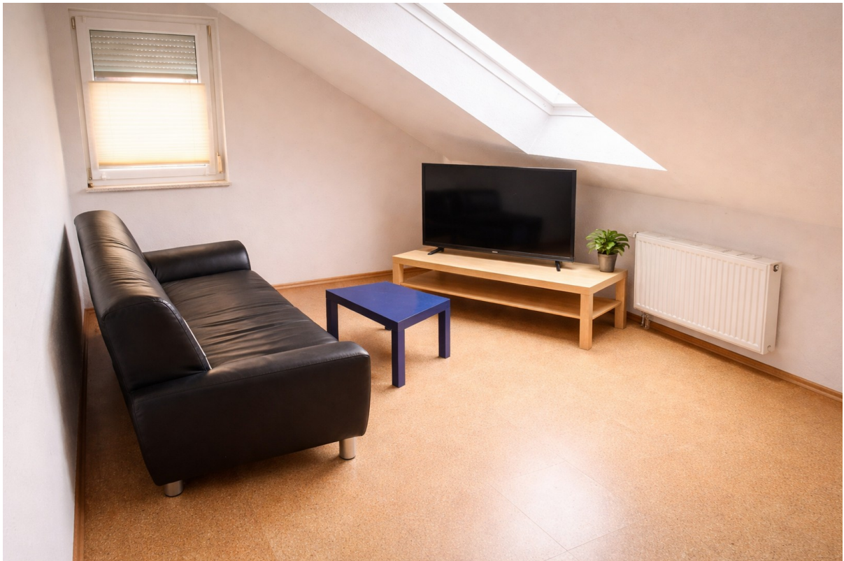
OG | Zimmer 2