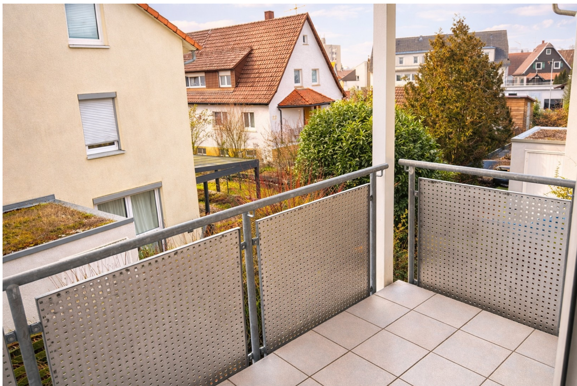
Rückansicht | Blick Balkon