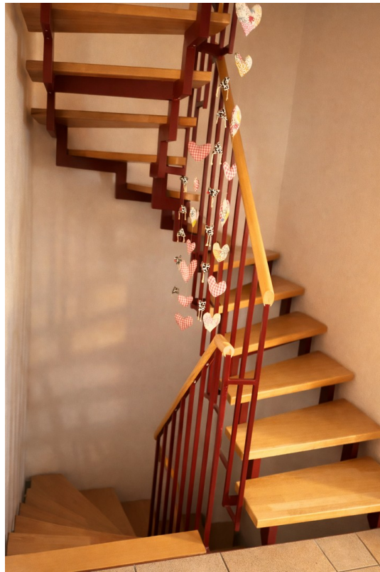
EG | Treppenhaus