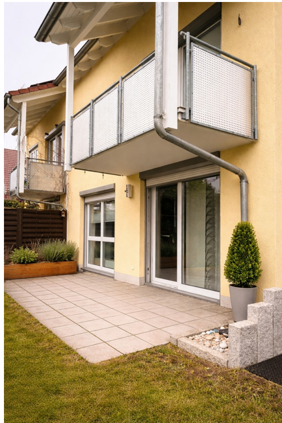
Rückansicht | Terrasse