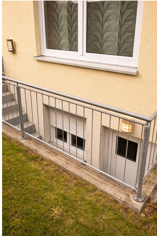
Seite | ELW