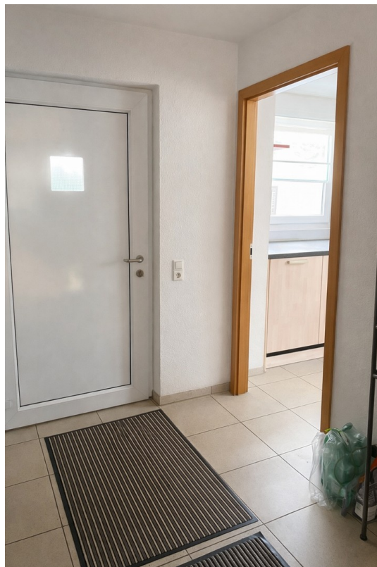
EG | Eingangsbereich