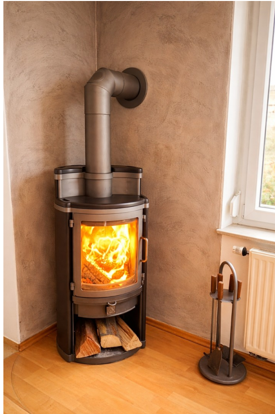
EG | Kaminofen Essbereich