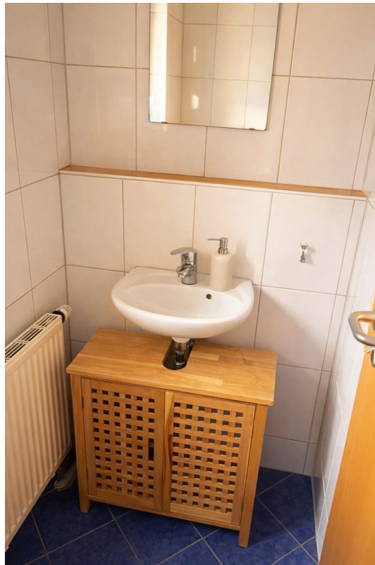
EG | Gästetoilette