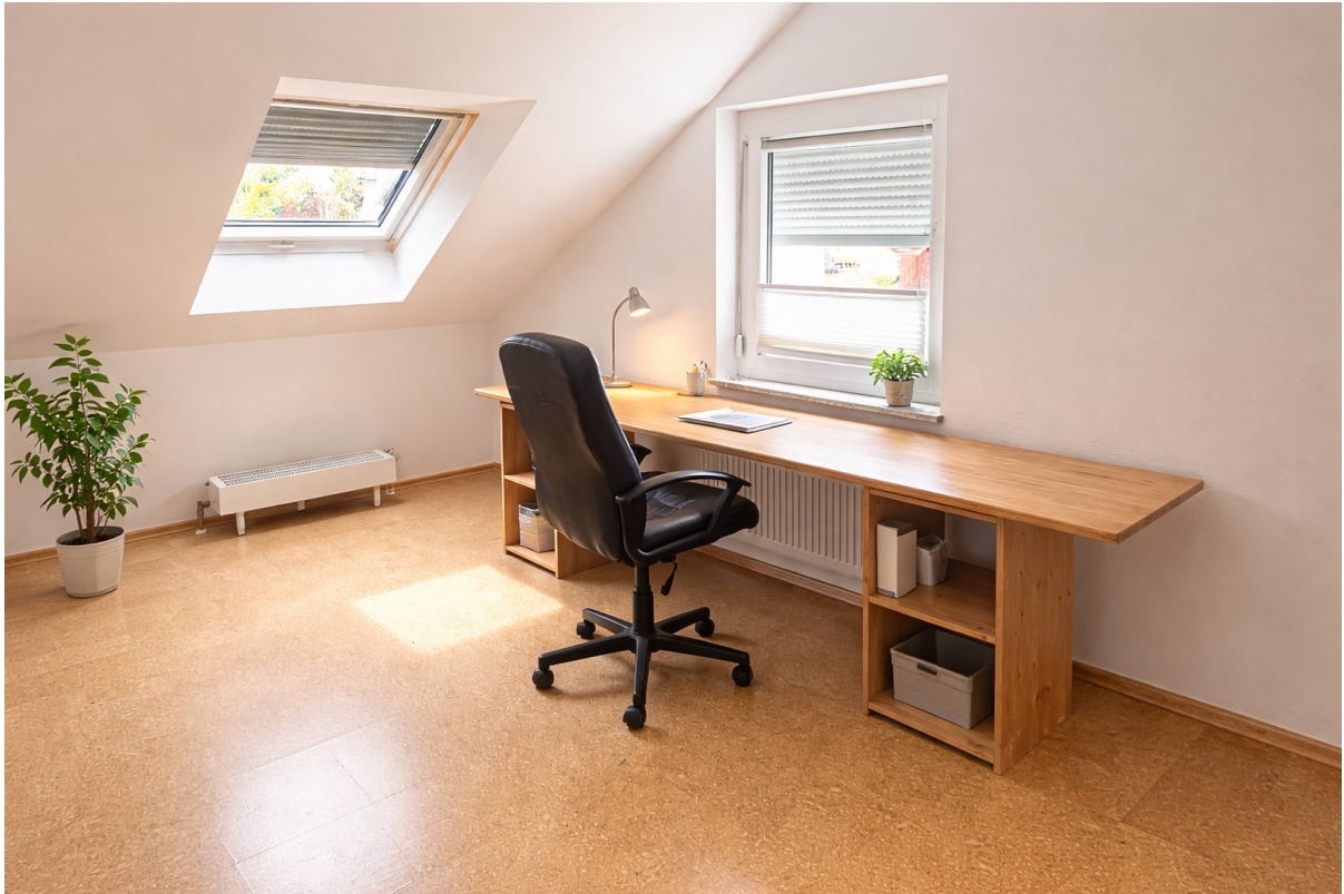
OG | Zimmer 1