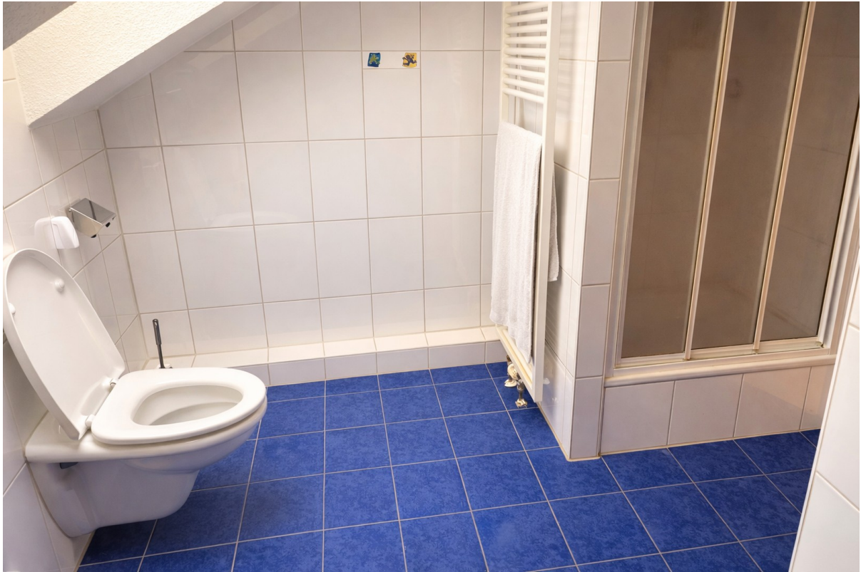
OG | Bad